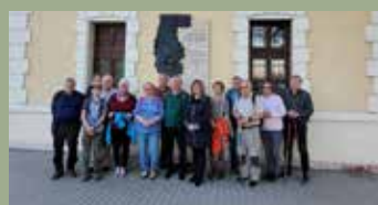
MÁJUS AZ EMLÉKEZÉS HAVA