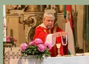
50 ÉVE A HIT ÚTJÁN