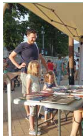
Bekerül az emlékpecsét a kvíz nyereménykönyveibe

Nagyon köszönjük a részvételt, öröm volt játszani!