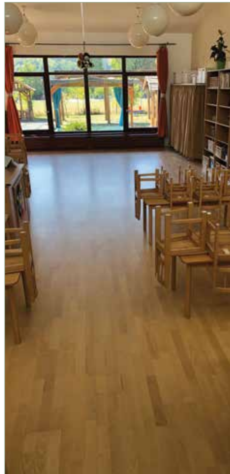
Parketta csiszolás után a gesztenyefa csoport

A beiratkozás e-mailben lehetséges: diotoro08@gmail.com címen.