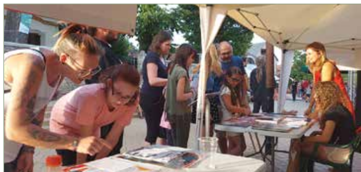
Búcsúi könyvtári kvíz az infosátornál

Örültünk, mert nagy volt az érdeklődés! Kicsik és nagyok egyaránt jöttek, mindenki szívesen kapható volt egy kis játékra. Nem mellesleg, értékes