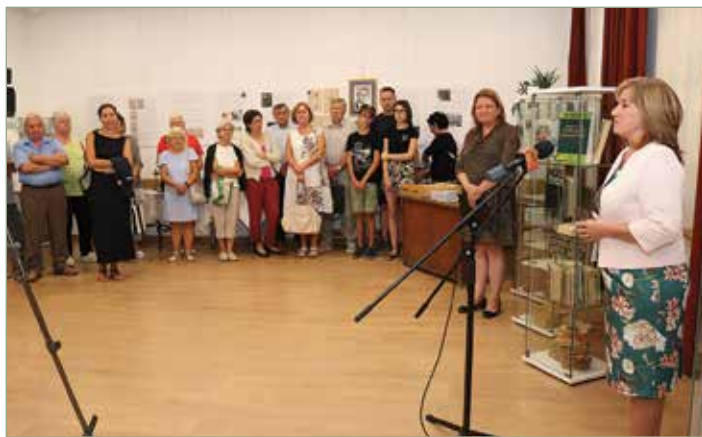
Polgármesteri köszöntő a helyismereti kiállításon

Feltétel az is, hogy születessenek regények, okos-tanító irodalmak, szép, gyerekeket vonzó képeskönyvek, izgalmas kalandkönyvek, vidám könyvedek, amelyekről tudunk pihenni egy feszült nap után.