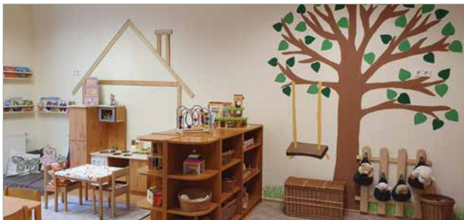
Nyári munkálatok Maci csoport újra álmódása a szülőkkel

szükségessé vált a meglévő játékok nagyobb volumenű karbantartása és felújítása. Két hintaállvány, két mérleghinta és két óriás mászóka komplett felújítására került sor a fa elemek elhasználódása, korhadása miatt. A Dózsa György utcai Forrás tagóvodába induló új kiscsoport (Maci csoport) szobájának kialakításában végzett önkéntes munkáját nagyon köszönöm a résztvevő szülőknek és munkatársaknak. Köszönöm minden kollégámnak a sok-sok munkát, mellyel a nyár során segítették az óvoda szeptemberi sikeres indulását.