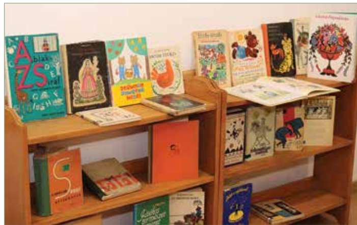
Emblematikus – korszakkijelölő könyvek a hatvanas évek sarokban a helyismereti kiállításon

A kiállítás 2022. október 7-ig látogatható, a könyvtári nyitvatartás szerint.