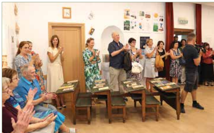
A kiállítást megnyitottam

Fontos a fenntartói akarat és lehetőség, hogy a körülmények biztosítva legyenek.