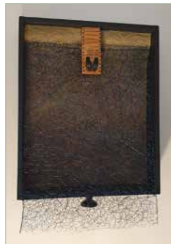
Kiürülés 2020 1.

Remélem, egyszer itt Nagykovácsiban is meg tudom majd mutatni a szobraimat.