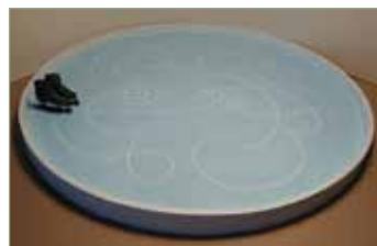
Jégbe zárt koreográfia 2020

két napot rajzot és technikát, vagyis át kellett állnom az online oktatásra. Újabb és újabb feladatokat dolgoztam ki a tanítványaimnak, amit aztán le is kellett ellenőriznem és osztályoznom. (Több, mint 210 tanítványom van.) Meg hát a Karitászt feladatokat, ahol ebben a nehéz időszakban még több rászoruló került a látóterünkbe. Őket sem lehetett-lehet elfelejteni. Nahát mindezek után jöhetett csak a művészet, a szerelem, az alázat,