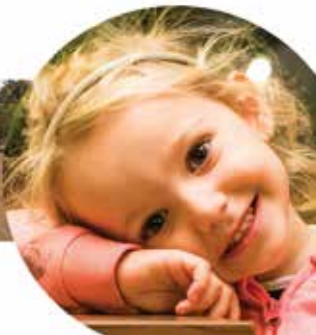
Nagykovácsi Önkormányzata az Alapítvány fő támogatója