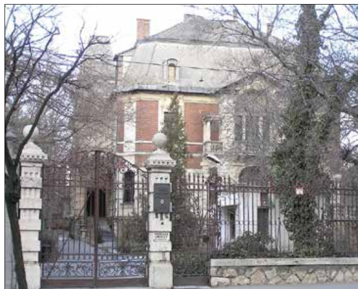
A gyilkosság helyszíne, a Tisza által bérelt, 1900-ban épült Róheim-villa napjainkban (Budapest, XIV. ker. Hermina út 45.)

„Sohasem voltam az ancien régime feltétlen híve, de kérdéses számomra, hogy a politikai bölcsesség jelének tekinthető-e, hogy a sok gróf közül a legokosabbikat (Tisza Istvánt) meggyilkolják, a legbutábbikat (Károlyi Mihályt) pedig megteszik miniszterelnökek.” írta Sigmund Freud.