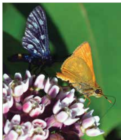
Megporzói bőséges nektárforrásra találhatnak benne.

Betelepítését egyfelől dekoratív megjelenésének köszönheti, másfelől elővigyázatlan elődeink olyan hasznokat véltek húzni, melyek aztán nem realizálódtak. Fialt hajtásait (ekkor még nem annyira mérgező) alaposan mosva, főzve spárga helyett fogyasztották. A 19. század második felében természetették abban a reményben, hogy virágjából szörpöt, bort, illóolajat készíthetnek. Magjából olajat, tejnedvből pedig kaucsukot szerettek volna gyártani, de próbálkoztak magszöreiből selymet, majd később szigetelő anyagot is előállítani. Mikor minden kísérlet dugába dőlt, akkor felhagytak a természetésével, de a megmaradt sarjtelepek az invázió kiinduló pontjaivá váltak. Mára a virágkötészet használja terméseit (kidobva a csokrot aztán persze ez újabb terjedési forrás lehet), virágjaiból gyűjtött nektár pedig karakteres ízű mézet ad. Persze ennek is vannak árnyoldalai, hiszen monokultúrák állományaiiban más virágos faj alig él meg, már