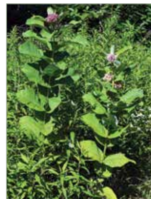
Külső megjelenésében első ránézésre valóban hasonlít a dohányra.

Nálunk jelentős természetes ellensége nincs, s attól is erősen óvni, hogy ilyet betelepítsünk, mert nem nagyon tudunk arra példát, hogy ez nem fog nagyobb gondot okozni később. Ezúttal is beigazolódtott mint oly sokszor az emberiség történetében, hogy az előbb cselekszem, majd utána gondolkodom módszer nem vezet jóra! Ezért is nagy a felelőssége a növényforgalmazóknak, farmereknek és a törvényhozóknak. Ne hozzanak/hozzassanak be, terjesztessenek olyan fajokat, amikről még nem bizonyosodott be, hogy nem okoznak kárt, nem válnak inváziós fajjává eredeti élőhelyeiktől messze, mert míg az esetleges haszon a terjesztőké, a kár következményeit mindannyiunknak kell viselni. Ugye milyen ismerős ez a modell a természet- és környezetvédelem szinte minden területén?