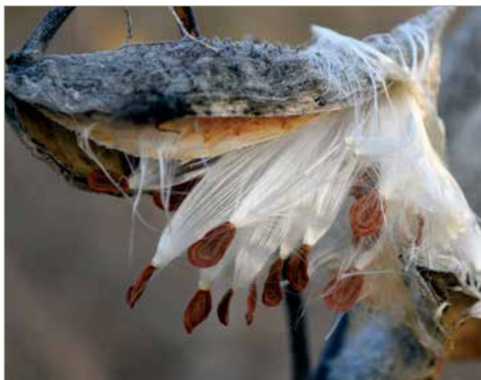
Magszörei selyemszerűek, ez az eredete másik közismert nevének, a selyemfűnek.

Körülbelül 1–1,5 méter magas, élvelő lágyszárú. Leveleik egyszerűek, nagyok (15–25 × 5–9 cm), átellenes állásúak. Tarackszerű gyökerei többnyire vízszintesen a talajfelszínhez közel futnak, de akár 3 m-nél mélyebbre is lenyúlhatnak. Júniustól–augusztusig nyíló virágaik hímzősek, bogernyőbe rendeződnek, színük a fehértől a vörösre terjed. Erős illatuk van, s nagyon sok beporzót vonzanak. Szarv alakú, felnyíló tüszőtermésük van, melyben 100–200 szőrös mag van.