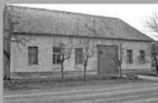
Öregiskola Közösségi Ház és Könyvtár 2094 Nagykovácsi, Kossuth utca 78. https://www.facebook.com/nagykovacsiolegiskola/ www.nagykovacsikronika.hu