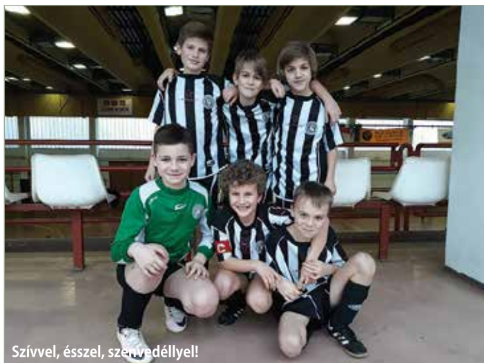
Szívvél, ésszel, szenvedéllyel!