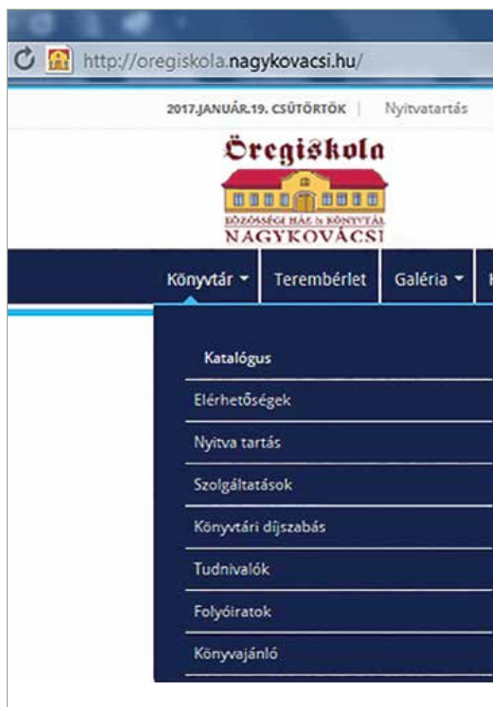
1. Katalógus a honlapon