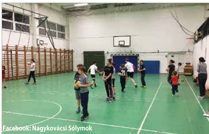
Facebook: Nagykovácsi Sólymok

Mindezzel együtt a legkisebbeink képzése is folytatódik. Az elmúlt félévben sokat ügyesedtek, szépen fejlődtek, koordinációs képességeik egyre koncentráltabbak. Folytatjuk velük az elkezdett munkát hogy év végére lefektessük a játék alapjait.