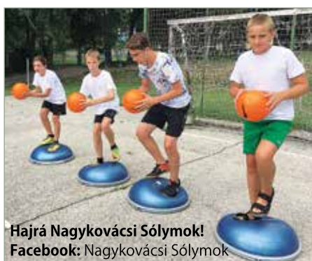
Hajrá Nagykovácsi Sólymok! Facebook: Nagykovácsi Sólymok

Egyik délután kvíz vetélkedőn teheték próbára a tudásukat fociról, kézilabdáról és az éppen aktuális Vizes VB-ről szóló kérdésekben.