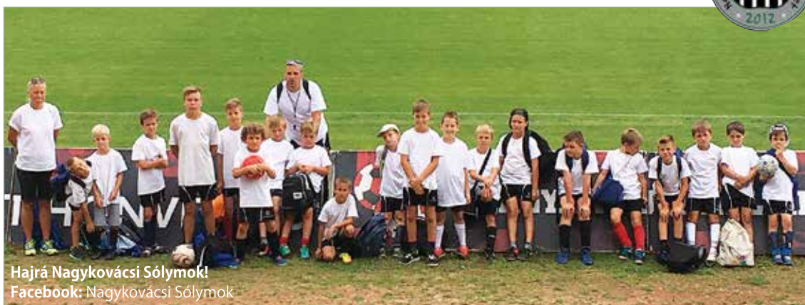
Hajrá Nagykovácsi Sólymok! Facebook: Nagykovácsi Sólymok