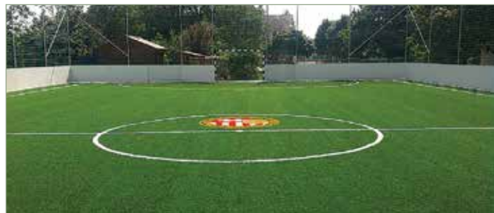
A kép egy azonos terv alapján megvalósult kispályát ábrázol.

Az MLSZ a vonatkozó közbeszerzési eljárást lefolytatta, a nyertes vállalkozással szerződést kötött. Előzetes tájékoztatásuk alapján a kivitelezésre idén augusztusban kerül sor. A pálya elkészítésének összköltsége meghaladja a 28 millió forintot.