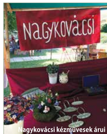
Nagykovácsi kézművesek áruja