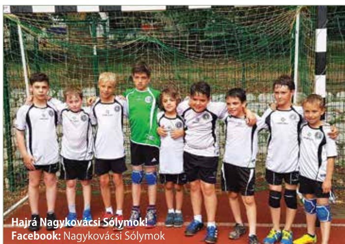
Hajrá Nagykovácsi Sóllymok! Facebook: Nagykovácsi Sóllymok

Júniusban szezonzárásra készültünk. Május végére minden Országos Gyermek Bajnokságba résztvevő csapatunk befejezte a versenyzést kiváló eredménnyel. FU14-es fiú csapatunk 3. helyezést ért el az alsóházi viadalokon. LU13-as leány csapatunk is kiváló helyezéssel zárta a szezont. Ők a felsőház 5. helyét szerezték meg maguk mögé utasítva egy nívós egyesületet. FU12-es fiú csapatunk nagy küzdelemben 1 ponttal maradt le a dobogó legfelső fokáról, így a második helyen végzett az alsóházban.