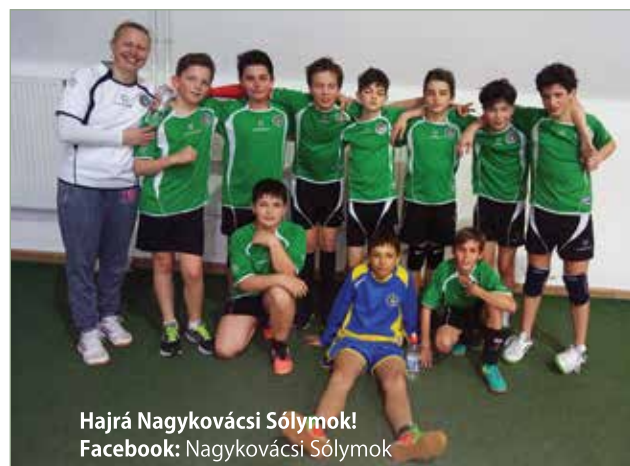
Hajrá Nagykovácsi Sóllymok! Facebook: Nagykovácsi Sóllymok

Február hónapban egyesületünk több tagja is részt vett az Országos Diákolimpia körzeti döntőjében. Büszkeséggel tölt el, hogy a 7-8. osztályos fiúk aranyérmeket nyertek a körzeti döntőn, így biztos továbbjutók a soron következő fordulóra, és a 7-8. osztályos lányok is biztos továbbjutók miután parádés játékkal győzték le Mogyoród csapatát 14-4 arányban.