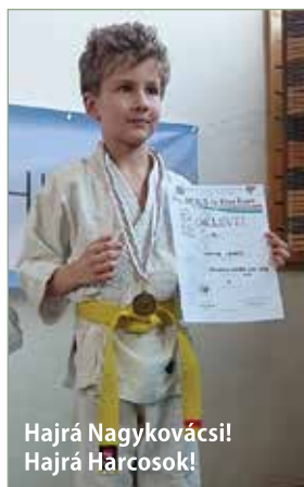
Hajrá Nagykovácsi! Hajrá Harcosok!

Bár nekem főbíróként kötelességem volt a bíraskodás felügyelete is, de sikerült végignéznem a harcosaink összes meccsét. Szívem egyszerre dobbant az egész csapattal, akik szintén olyan egységes arcot mutatnak, amire csak egy igazi csapat képes. Bátran kijelenthetem: A TIGRISEK MEGÉRKEZTEK mindannyiuk szívébe! BÜSZKE VAGYOK RÁTOK! Irány a következő verseny, még több indulóval!