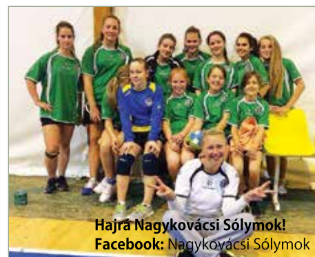
Hajrá Nagykovácsi Sólymok! Facebook: Nagykovácsi Sólymok