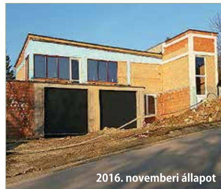
2016. novemberi állapot

Továbbra is szeretettel várjuk azokat a Lakosokat, akik önzetlenül csatlakoznának egy jó csapathoz, amiben az itt lakókért, értékeinkért, életükért teszünk, felelünk egy emberként!