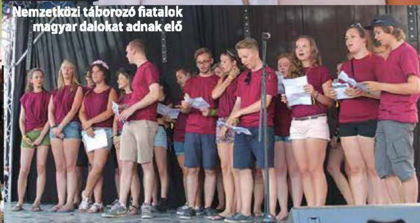
Nemzetközi táborozó fiatalok magyar dalokat adnak elő