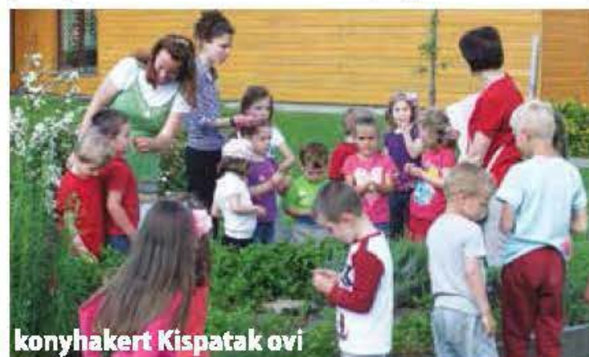
konyhakert Kispatak ovi

Az országos verseny lezárta után a programról részletesen beszámolunk a következő számban.