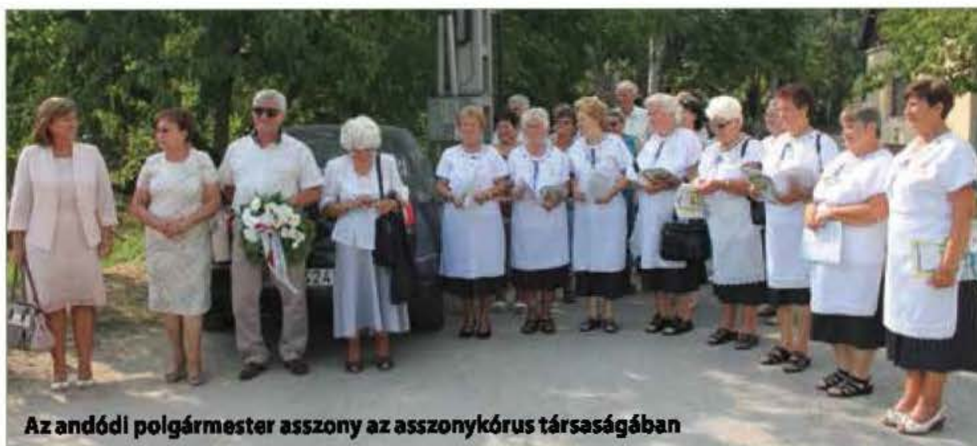
Az andódi polgármester asszony az asszonykórus társaságában

Ápoljuk, őrizzük, szélesítsük kapcsolatainkat Nagykovácsi épülése, fejlődése érdekében! Biztos vagyok benne, hogy a befektetett energiák idővel megtérülnek.