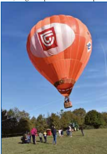
Druženje se je končalo ob velikim toplozračnem balonu.

srečanje otrok in strokovnih delavcev iz omenjenih štirih porabskih vrtcev. »Želim, da skupaj preživimo prijeten, ustvarjal in jezikovno obarvan dan na kmetiji,« je pouda-