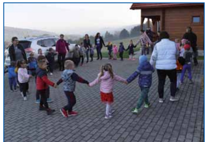
Brez plesa tudi ni šlo.

srečanje otrok in strokovnih delavcev iz omenjenih štirih porabskih vrtcev. »Želim, da skupaj preživimo prijeten, ustvarjal in jezikovno obarvan dan na kmetiji,« je pouda-