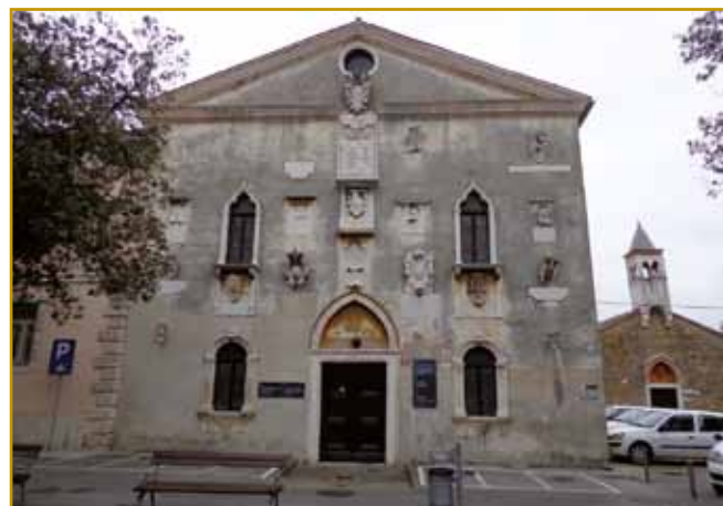
Te viske pa trno kuste stejne ménje Fontico majo. Zmejs med stenami so pšenico, riž pa oves meli. Gnes bi njemi po slovenski skladišče za zrnje prajli. Najbole je iz njega vse tau vöprišlo, gda so za časa bojn ali velki katastroflidam iz Kopra talali. Takše fontice so v davni časaj vsi varaši v Beneškoj republiki meli, spod stere je Koper tó spadno.

vösklesani. Tau nam zvekšoga od koprski podestatorov pripovejda. Podestati ali kak v Istri pravijo, podeštati, so velki glavaške bili. Tau je biu človek, ka je navjekšo civilno funkcijo v varaši emo. Tau funkcijo njemi je velki dož iz Be-