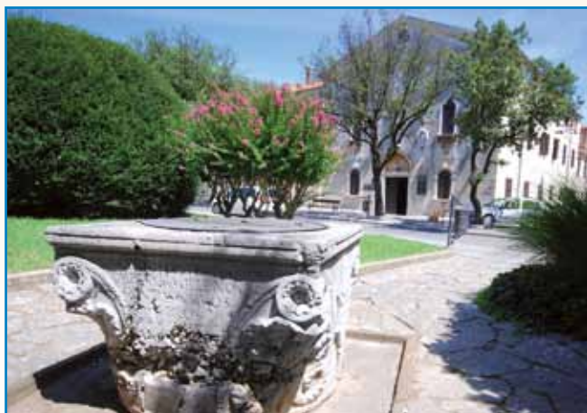
PRIPOVEJSTI O SLOVENSKI KRAJINAJ stran 9