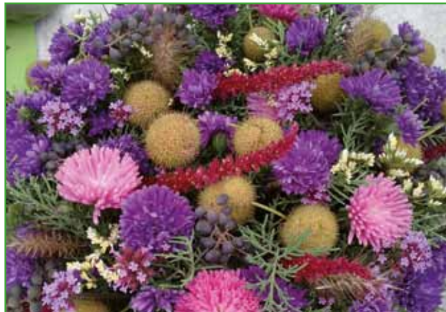
Sveži aranžma. Če le ne bo slane, si natrgajmo enoletne modre astre, malo kleka ali sive cedre, jesenske astre v roza in lila barvi ter malo plodov platane.