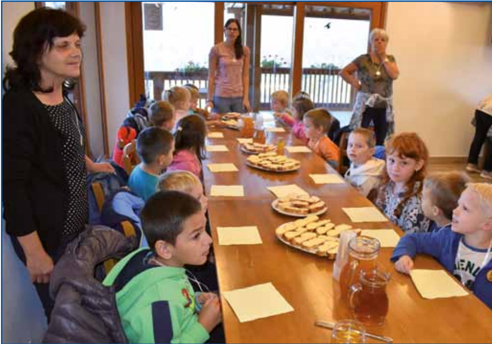
Pred začetkom delavnic se je bilo treba okrepčati s pravim slovenskim zajtrkom.

znanja slovenskega jezika. Druženje porabskih otrok se je končalo na travniku za kmeti-