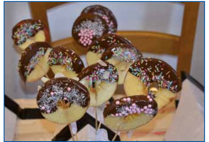
S čokolado oblita jabolka so se spremenile v slastne lizike.