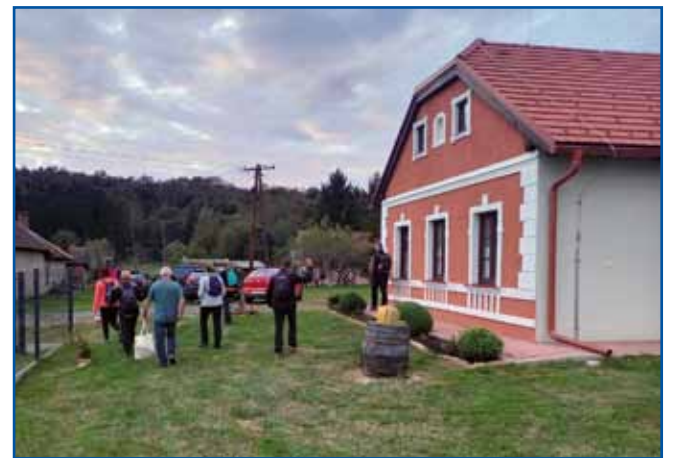
Gda smo slobaud vzeli, se je že kmica delala.

Na edenajsto vöro smo meli pogučano srečanje, mi pa kak švicarska vöra smo točni bili, ka je pri nas pri Andovčanaj fejst rejdko. Po dugoj pauti smo se fejst tazmantrali, tak ka zaslüžili smo si palinko, li-