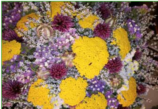
Suha dekoracija, ki ostane dolgo na grobu. V njej so: rumeni rman, krilata mrežica, pisana enoletna statica, črna kumina in drobni luk.

so bili pred nami v nekem času, delavni in skrbni, predvsem pa ljubeči in ljubljeni.