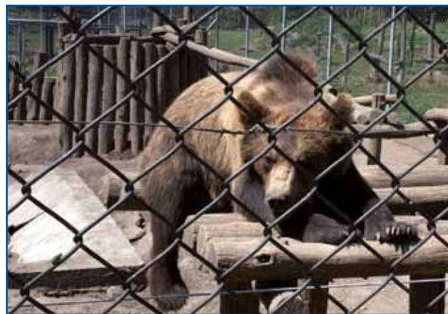
Toga maloga medveda so rejšili s temišvarškoga živalskoga vrta, šteroga so mogli zaprejtí. »Medvedji dom« v Veresegyházi gorprija nesrečne stvarine.

Trbej je znati, ka so tau nej takše stvarine, štere so v divdjini vküpdzajjali. V Veresegyház pridejo s cirkusov pa drügi živalski vrtov, gde majo lagvo življenje. Dosta geste med njimi takši, šteri so se v »robstvi« naraudili, zatok več nikdar ne smejo nazaj v nara-