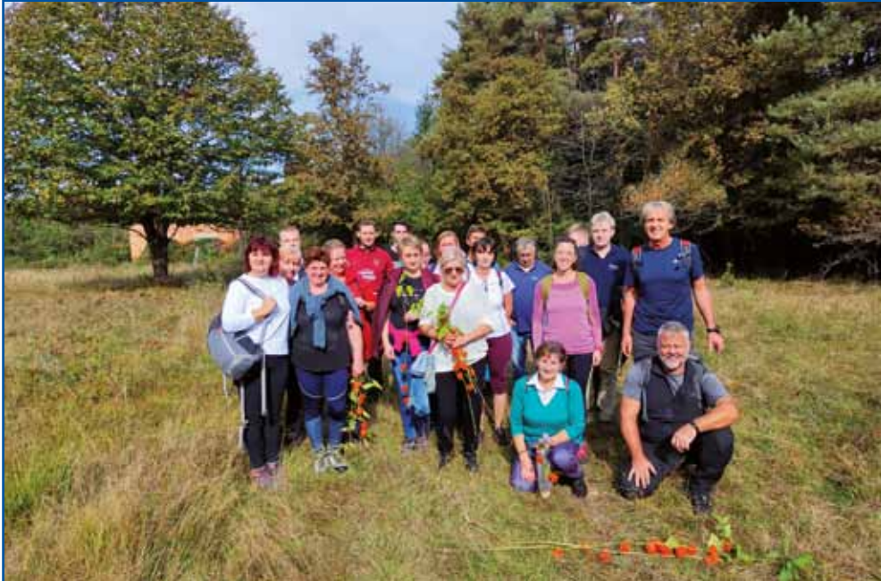
Andovčani in Sakalovčani na Prlongaj, ge so jih gostitelji počakali.

ka naj delamo, gda je Laci Nemeš kukrco pripelo s taligami, tašo stera še nej voolüpana. Tak ka leko smo probali, kak so gnauksvejta kukrco lüпали pa goravezali. Gda smo s tejm zgotauvili, te smo si nazaj k