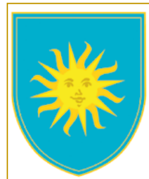
Grb Kopra nas od inda v gnešnje čase pela. Če je inda koza simbol za davne lidi iz staroga Caprisa bila, je za moderen Koper gnes sunce gratalo. Daubili so ga, gda so Napoleonovi lidge tó doj do mordja prišli. Ranč Napoleon aj bi zapovedo, ka pod tem suncom Koper mora stati.

Tau nej mogauče bilau, ka velki dož ji je na vsikši 16 mejsecov zameniu. Mogli