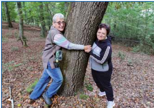
Po pauti smo objeli več sto let stare bükvi pa hraste.