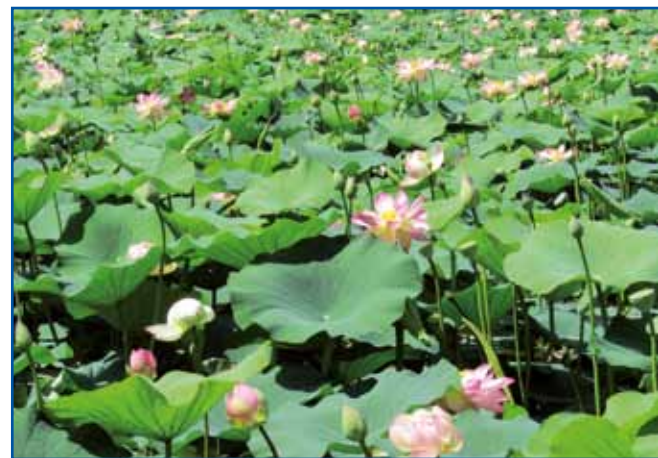
Indijski lotusi v Narodnom botaničnom gračenki v Vácrátóti. Tau so najbolje sveite rauže hinduistične in budistične mitologije, simboli življenja in narodjenja.

Smo se pa leko čüdivali indijskim lotusom, šteri so – kak eden veuki roza-zeleni tranik – cveli vrnau te. Paut nas je