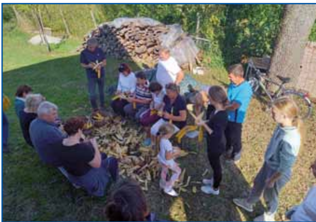
Na srečanji smo lüпали pa vezali kukrco, kak so tau delali indasvejta.

stauli vseli pa kak se šegau ma, gda stoj povesi dé, pripovejdali smo gnauk z ednim, gnauk z drüгим. Tak smo se spozabili, ka je gnauk samo začnila kmica gartüvati. Brž