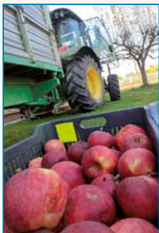
KVALITETNE DJABOKE ... stran 4