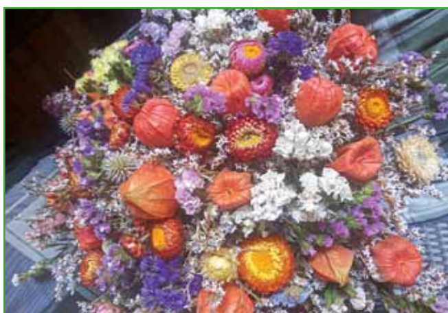
Suhi aranžma v oranžnem, kjer je strnjeno cvetje, ki ostane dolgo na grobu.

Morda niste vedeli ... Cvet krizanteme velja pri vzhodnoazijskih ljudstvih za