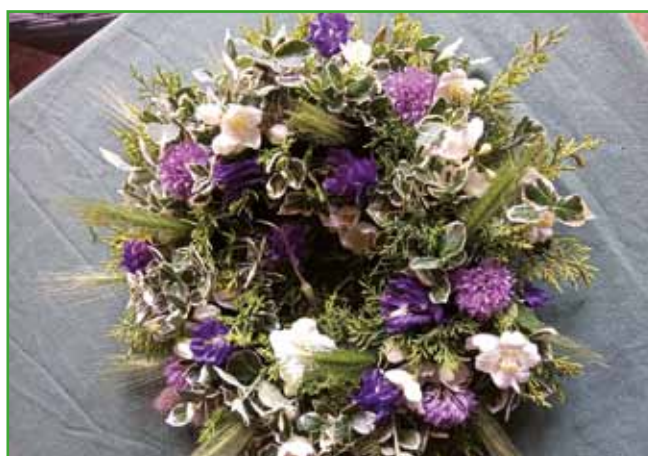
Beseda venec predstavlja zaokroženo celoto, predstavlja nam dekoracijo cvetja v življenjskem obdobju, ki se strne in zapre z odhodom.

tišine in nas prisili v premišljevanje o minljivosti. Rada se ustavim in preberem različna sporočila, namenjena umrlim, pa tudi nam. Še posebno ob