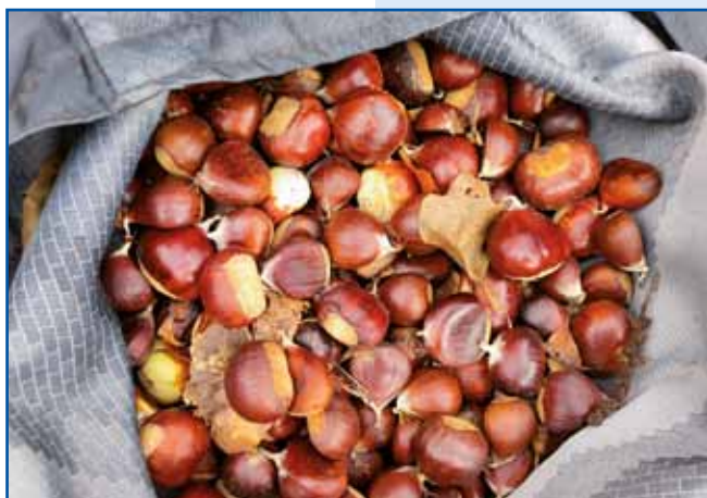
Nej smo dosta kostanjov najšli, vej so pa müši, veverice pa divdje svinje bole flajsne bile.

je, aj se počütimo veselo, najdemo dosta kostanjov, ka škejo sküjati, da do v Števanovci lüпали tikvine goščice.