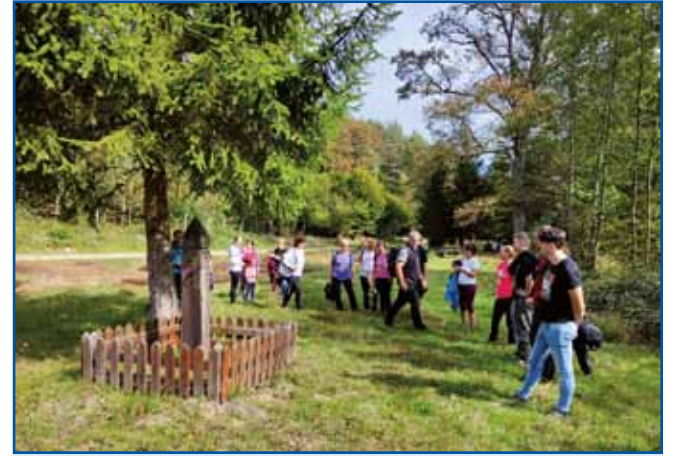
Poglednili smo si nekdešnji spomenik za najbolj zahodno točko Vogrske. Tau je valalo v tisti časaj, gda so turisti eške nej mogli titi na Gorenji Senik, ka je Senik biu v ozkom mejnom pasi.

Gda smo se proto vesi napautili, nej zaman, ka s planin veter fudo ranč prauto nas, že na okrajmi vesi je denilo kak se mesau peklo pri Etični hiši,