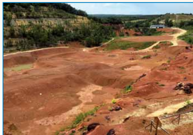
Z ZELENOGA NA REDEČI PLANET stran 10