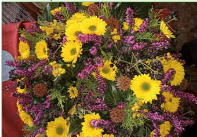
Sveži aranžma. Vsebuje domače marjetice z vrta, drevesasti bršljan, klek in jesensko reso.