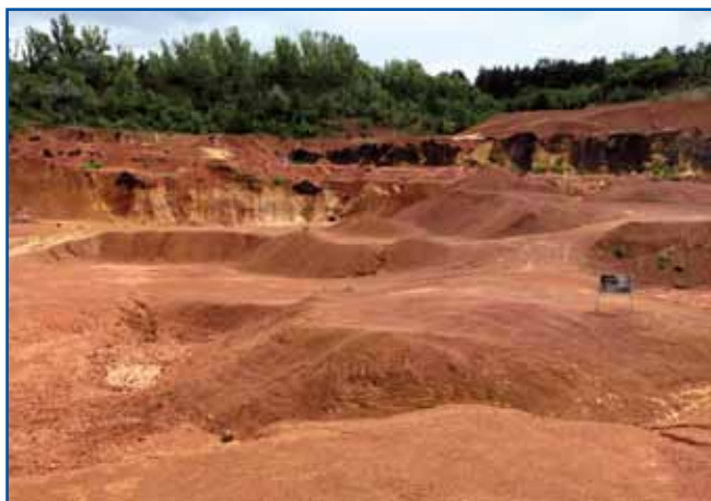
Nej, tau je nej Marš, tau je zaprejtí rudnik bauksita v vesnici Gánt v županiji Fejér. Na učnoj pauti geološkoga muzeja leko spoznamo indašnje čase naše Zemlé.

pelala nimo potokov, nad šterimi so se lovili sivi kački pastérge. Najbole zanimivi pa je venak biu tisti paukraug, v šterom so sortérali osemdeset fajt rastlik. Tak so bili na priliko na ednom küpi vsefelé