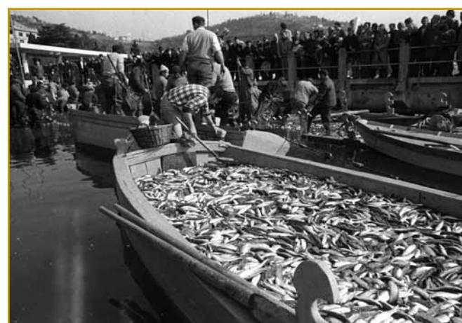
Tak so inda v ribiški čunaklinaj sardele v fabriko v Izoli vozili. Lepau se leko vidi, ka ribdja žetev je dobra bila pa dosta lidi jo je pozdravlat prišlo. Lidge so že stau pa stau lejt nazaj sardele radi na talejri meli. Za gesti srmakov je ta riba valala. S konzervami pa je v varaše prišla pa nej dugo trbelo, ka so jo za delikateso vōzglasili.