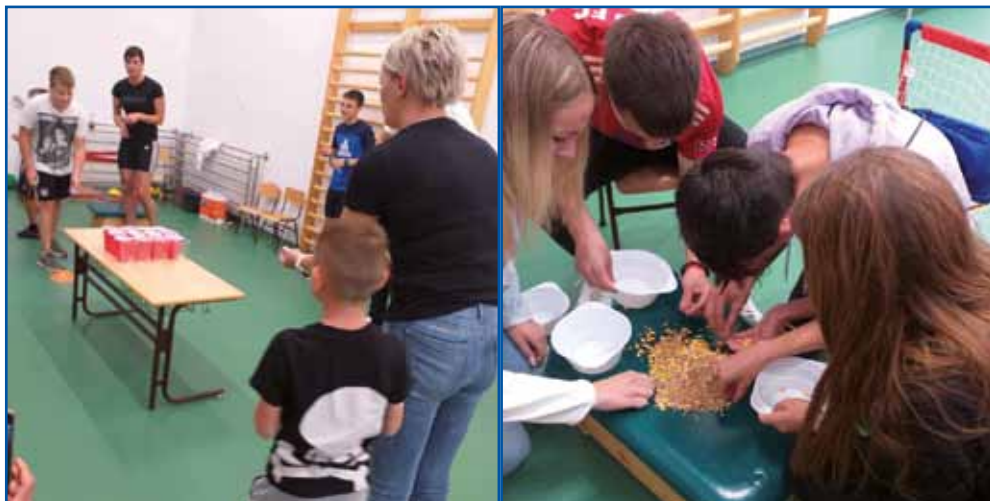
Udeleženci športnega dneva so se morali izkazati v raznih spretnostnih igrah.

Hvala vsem, ki so bili z nami na ta deževni dan. Hvala tudi za organizacijo vsem članom