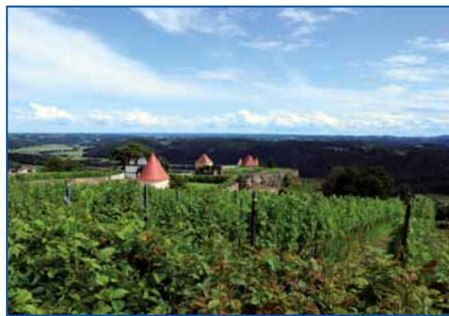
Grad se zdigava na vzhodnom tali avstrijske Štajerske. Kak više pridemo, se nam srejudi grauzdja vsikdar bole opéra lejpi pogled na krajino.

Vse tau leko zvejmo na gradi Riegersburg, če malo preštemo napise na leta 2017 obnovlenoj razstavi »Čalarice in čalejri« (na papéraj so vödjana pisanja v slovenskoj in vogrskoj rejči tö). Grad má v svoji 30 sobaj eške dvej drugivi razstavi. Na ednoj leko na priliko vidimo, kak so té veuke iže vögledale v 17. stoletji, gda so v krajini Törki robili. (V bitji pri našom Varaši leta 1664 je spadno drügi mauž