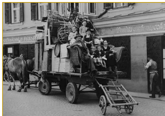
Optanti so na svojo paut leko vzejli, ka je na kaula šlau. Zidine v vesnicaj, v varašaj so za njimi ostanole. Bogati so velke žlate na Talanskom meli, uni so nej tak lagvo obodili. Pavri so svoje življenje vcejlak na nauwo mogli začniti. Vnaugi so v fabriko za delo prijali, eni pa so zemlau daubili, na njoj so delali.

Istran. (Kejp na 1. strani: Ta palača velke pa bogate držine Ughi je leta 1781 bila zozidana. Na njenom mesti je že več kak 300 lejt nazaj njiva prva palača stala. Depa, nauvi stil, barok, je naprej prišo, staro so cejlo v nauwo