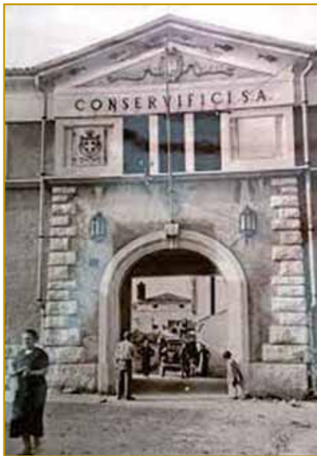
Prva fabrika ribdji konzerv skrak Jadranskoga maurdja je leta 1855 v Izoli s svojim delom začnila. Po tejm so s takšnim konzervejranjom rib eške v drugi varašaj začnili. Najprva je mala fabrika na taum mesti stala, leta 1882 pa je ta bila napravljena, kak jo leko na fotografiji vidimo. Gor jo je dau postaviti Slovenec iz Beča, Werhanek je njegvo držinsko ménje bilau.

ke spremenila. Gvüšno, ka skrak maurdja je nikak ovak nej bilau. Lidge so ribe pa drugo mesau tō po indašnje konzervejrali, na zraki so ga sišili, v sau so ga dejvali. Mi najbole okaje-no mesau poznamo. Revolucija, stera je industrijo naprej prinesla, je ovak gesti začnila konzervejtrati. Iz toga rejč konzerva vōpride. Prvi je konzerve Napoleonova grande armee - velka armada - gor opejrala pa vō iz nji mesau gejla. Prve ribe so nut v konzerve začnili klasi v francuskom varaši Nantes, leta 1822 se je tau zgodilo.