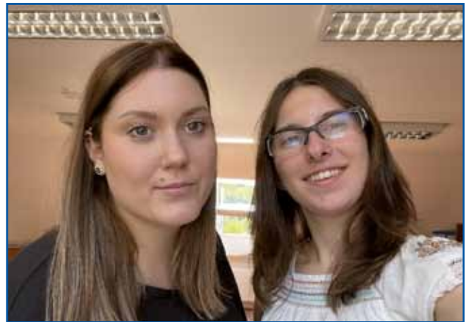
Skupaj se veseliva izzivov, ki nama jih bo prineslo delo z vašimi malčki v vrtcih. Meniva in upava, da lahko veliko prispevava vaši porabski skupnosti.

Moja izobraževalna pot se je začela na Osnovni šoli Kuzma. Že kot osnovnošolka sem rada obiskovala vrtec in se spoznavala z delom vzgojiteljev. Tako sem vzljubila poučevanje in nasmejane obraze otrok, ki hrepenijo po novih znanju, raziskovanju, odkrivanju in razigranosti. Odločila sem se nadaljevati šolanje v