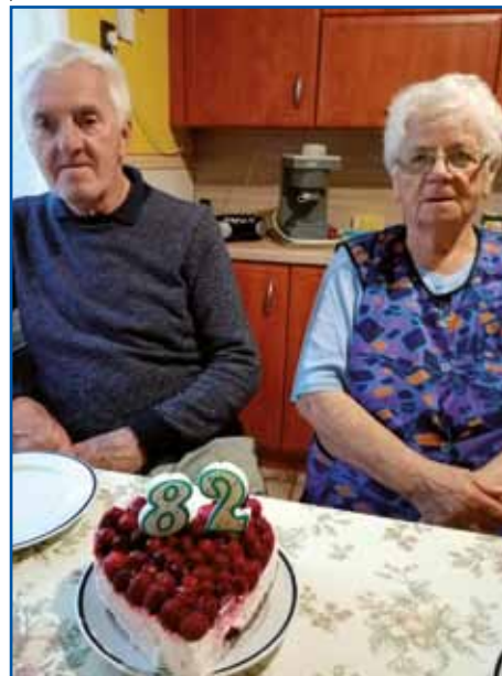
Tetica Iluš z možaum

spali, te nej bilau tak, ka vsikši emo svojo postelo. Tau je tašoga reda dobro bilau, če nas je mrzav trauso, te smo se vtjüppotegnili pa včasim je baukše bilau.«