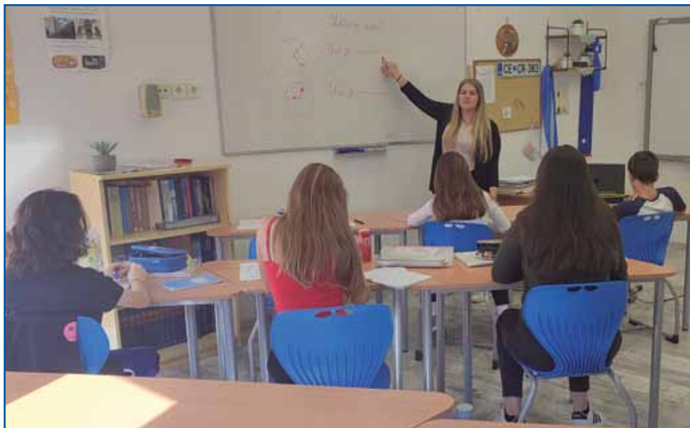
Pouk slovenskega jezika v 7. razredu

Kmalu boste torej končali šolanje na Pedagoški