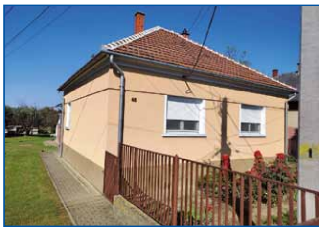
Iluška pa njeni mauž velki red mata kauli rama.

»Tau je bole takšo malo, rajo perdje bilau, velko nej, zato ka tisto bi pikalo v vanki-