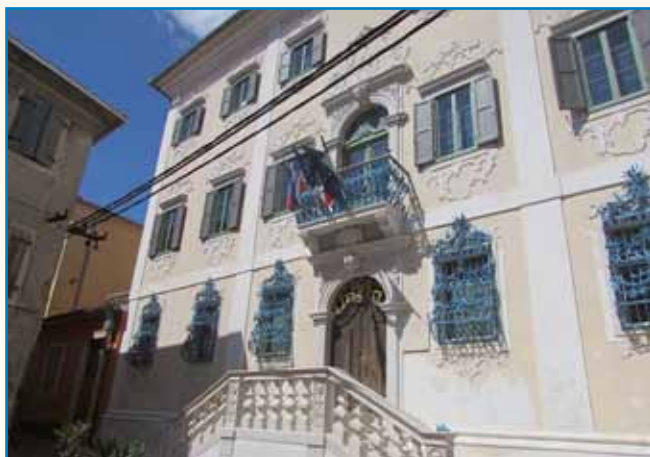
PRIPOVEJSTI O SLOVENSKI KRAJINAJ stran 9