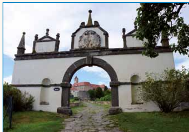
TAM GOR NA VISKOM KAMLI ... stran 10