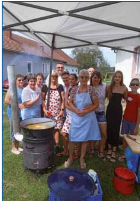
Kuharice in pomočniki so čakali goste s hrano, pripravljeno z veliko ljubeznijo.