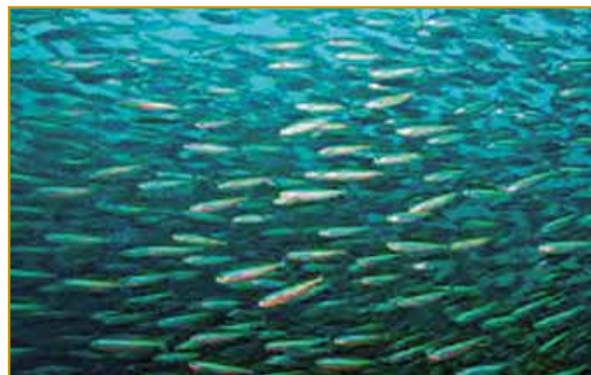
Sardele v velki jataj v maurdji plavajo. V najvejšoj do gnes poznani jati je 5 milijard sardel bilau. Ovak pa riba na rejci prejk 20 cm zraste. Pravijo, ka najbaukša sardela je tista, ka se v mejseci maji zgrabi. Njeno mesau je v tom časi bole trdo gé.

Fulvio Tomizza (1935-1999) piše. Tomizza bi po naše Tomica napisali. Njegva držina je tō optejrala, un je nazaj prišo, v svojoj vesi dadale živo pa piso. Od toga tō, ka nigdar se je nej za Talana pa nej Slovenca ali Hrvata čüto. Za sebe je vsigdar povedo, iz Istre sem, ge sem