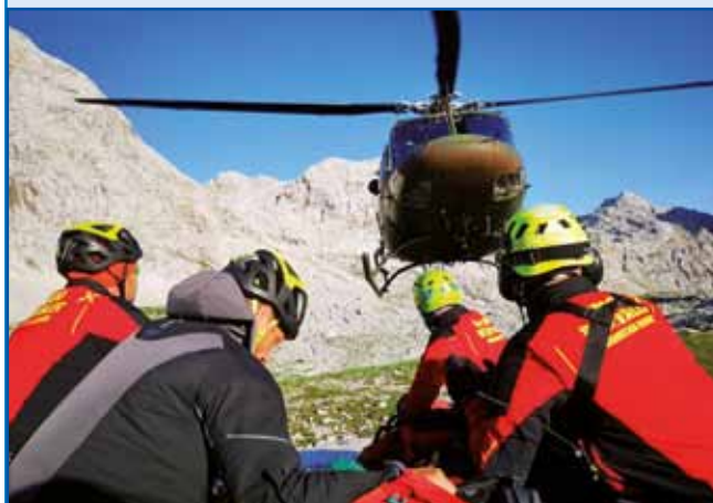
Helikopter z gorskimi reševalci vsikši den mora v akcijo iti. Zmejs se zgodi, ka do 10-krat ide koga takšnoga rešavati, steri je spadno, zablauo ali pa zavolo zmantranosti nej dale mogo. Žalostne numere so tau. V zadnji 10. lejtaj je v slovenski goraj 175 lūdi preminaulo.

... se že dolgo vej, ka slovenske gore za trno lejpe valajo. Lidge radi na nji ojdijo, takša rekreacija je vsikšo leto bole popularna. Vse več lidi iz drugi rosagov tō po goraj ojdi. Depa, vsikšo leto se takše godi, ka bi se nej smelo zgoditi. Tau leto se je že telko nesreč zgodilo, kak ji je v goraj eške nigdar nej bilau. Tau leto je že 10 lūdi soja življenja v slovenski goraj zgibilo. Leko povejmo, ka gorski reševalci cejli čas delajo. Do konca mejseca augusta 571-krat so na intervenciji bili. Največ nesreč se na pauti zgodi. Tam se vej človeki spoškaliti pa po tejm globko dojspadne. Gorski reševalci cejli čas lidam gučijo, aj v gore idejo kak trbej iti: dobro oblečeni pa obūti, zavole vode pa gestija s seuv naj majo pa tak tadale. Depa, ranč tau je tisto, zakoga volo največ lidi premine ali pa je rešavati morajo. Kak bi glūpomi pripovejdo, se tau leko povej tō. Tak se prejk