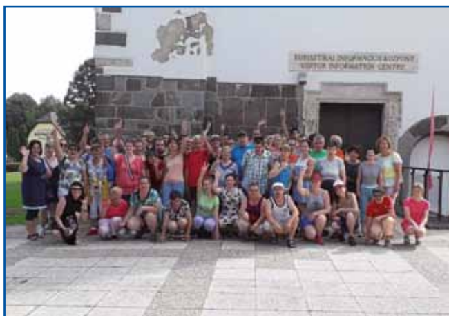
Invalidi in spremljevalci pred stavbo monoštrskega gledališča