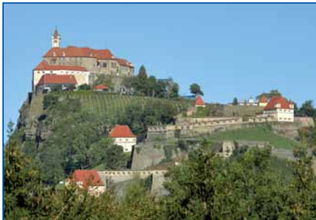
Grad Riegersburg je svojo gnešnjo formo daubo na srejudi 17. stoletja. Má blüzi tri kilomejtere sten, sedem dveri, dva djarka in 108 iž.

Letos juliuša sem pauzvo svojoga padaša v Porabje, ka bi ma malo pokazo naše slovenske vesnice. Nej sem sto vönjati razgledni törem na Verici tö nej, zatok sva na tau leseno strukturo ranč tak splezdila. Gda