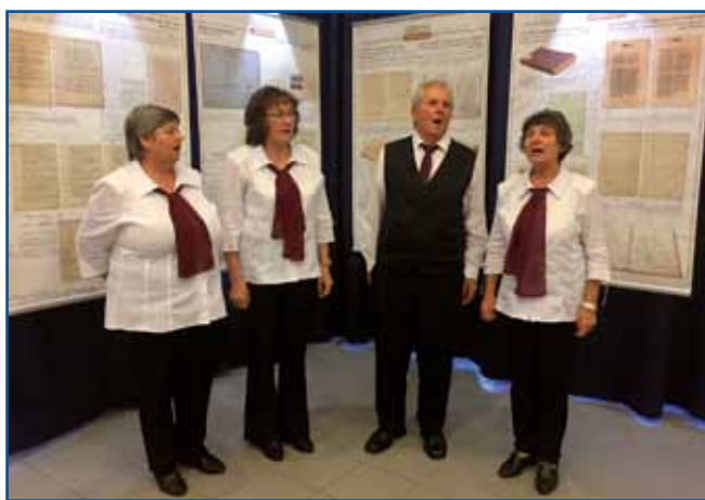
Štirje porabski ljudski pevci Veselega kvinteta so na odprtju razstave zapeli pred posterji z najdragocenejšimi zakladi slovenskih arhivov.

Dogodka sta se udeležila tudi voditelja osrednjih arhivskih