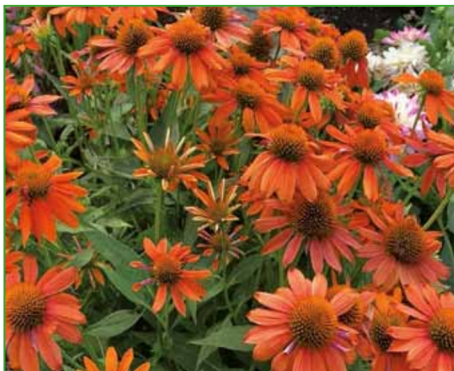
Sprotno odstranjevanje odcvetelih stebel ameriških slamnikov je poletno opravilo, saj s tem spodbudimo razvoj novih in tako podaljšamo čas cvetenja.

poležejo. Nekateri ljubitelji rastlinja jih privezujejo na različne načine in z različnimi tekstilnimi tra-