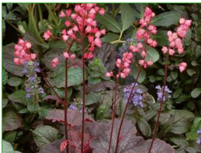
Pri nekaterih iskričkah stebela po cvetenju ostanejo dolgo na rastlini, šele ko so neugledne, jih porežemo.

kovi, vendar s tem rastlini večkrat uničijo vso njeno lepoto. Priporočljivo in bolj