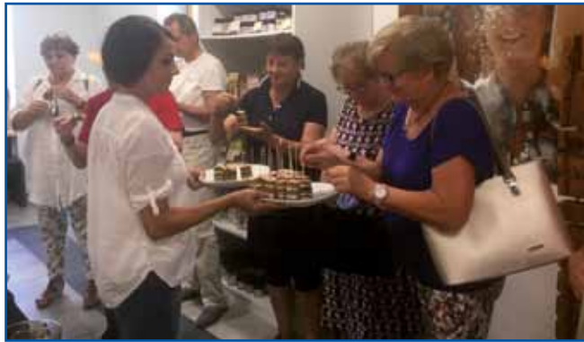
V Renkovci pečéjo gibanice s prekmurske mele in prlečki djabk, pri drugi figicaj pa nücajo ribez in tikvi z domanji njiv.

Letos 13. julišu so graubi viherge divdjali po cejloj Sloveniji, najüše pa je bilau venak vrnau na našom konci, v Prekmurji. Vöter je dojrigo streje, voda je zalejala več poštij, v dosta domauvaj je nej bilau elektrike. Sombotelski Slovenci smo z žalostnim srcom šteli novice o tajoj nesreči, dva dni kisnej, 15. julišu pa smo se donk napautili