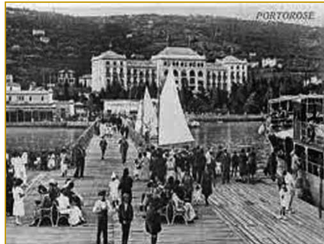
Palace hotel je prvim turistom leta 1911 dveri gor aupro. Té največki hotel daleč kaulakvrat v tistom časi je ranč tak zdravdje v solenom blatu reklamejro. Depa, ta hotel je za daleč najbolje bogate lidi valau. Gnes za tak malo romantičnoga vala, depa, pod seuw je vilo San Lorenzo pokopo, stera pa je tisto kapejlico na nikoj djala, po steroj je Portorož menje daubo.

Ovak pa na vreki turistične sezone vej po hotelaj pa drugi sobaj nagnauk do 100 000 turistov biti. Ve se, ka zavole