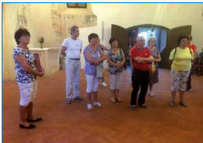
GESTI ZA TEJLO IN DŪŠO NA DOLINSKOM stran 4