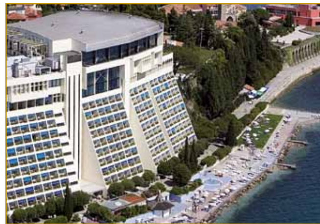
Staro se vküper z nauvim oženi, bi leko prajli. Zar na pravom kraji fotografije se cerkev sv. Bernardina vidi, hotel Bernardin pa se nut v maurdje »riši«. Spodkar pod njim so indasveja čunakline pa šifite delali. Gnes si tam malo bole pejneznati lidge svoja tejla namačejo.

vejdajo tau tō, ka že prva so se bratovge dominikanci v klastër svetoga Lovrenca naselili. Klastër pa tisto Ma-