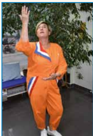
VBÖLTINCAJ JE FAJN ŽIVETI stran 3