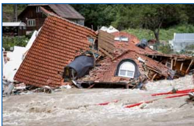
Dauma, v sterom je držina samo tri dni živela, več nega. Ogen leko pogasiš, vode pa staviti ne moreš, je v skuzaj povejdala držina.

fundament ne dojdejo. Depa, tak nut v papiraj piše pa amen! Gvüšno, ka zatoga volo lidge