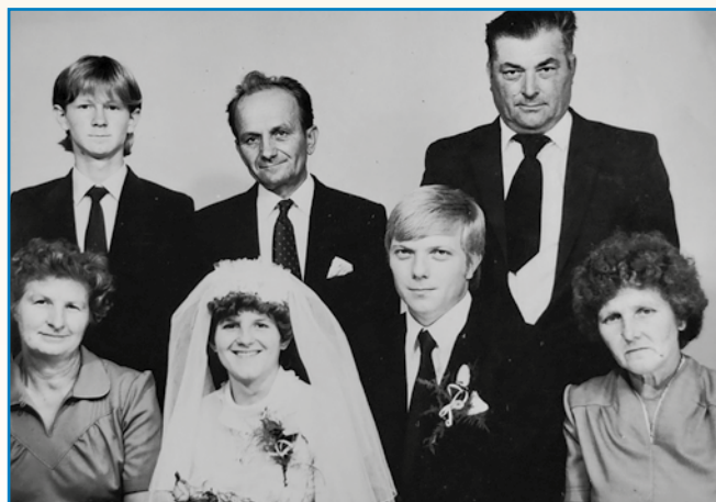
BOLA SMO ZDRAVI PA VESELI BILI stran 8