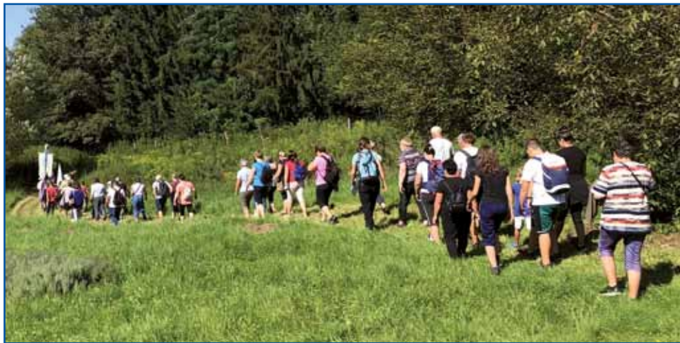
Duga kača božepautnikov se je dostakrat vlejkla po mezevaj pa lesaj, so pa po asfalti tō ojdli.

cejloga rosaga pa zvün njegvi grajnc napravimo tej dosta stopajov,« so nam med potjauv eške povödali plebanoš Horvat. Gda je patija za sebov njala Sakalauvec, je prauti Slovenskoj vesi ojdla v senci visiki drejv, nej pa po glavnoj poštiji. »Fejst sunce sije, depa nej baja. Vej je pa telko deždji bilau, ka zdaj že gnauk dobro spadne,