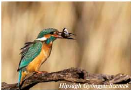
Hipságh Gyöngyi: Szemek