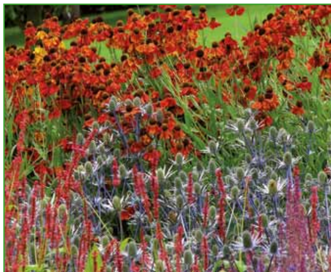
Visoke trajnice kot je helenij v družbi z ostalimi trajnicami se rad poleže, zato je dobro, da namestimo lesene loke, na katere potem privezujemo nestabilna stebela.

izgubljati veliko časa z raznimi opravili in hočejo uživati pri delu in ob rezultatih