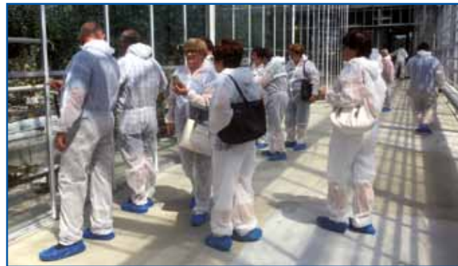
Paradajze firme Lušt odavajo po cejloj Sloveniji. Če štoj šké vleti pogledniti njime glažojnatne iže, more švicati v »skafanderi«.

Vözošvicani smo dojrismetali svoje bejle anorake, te pa smo