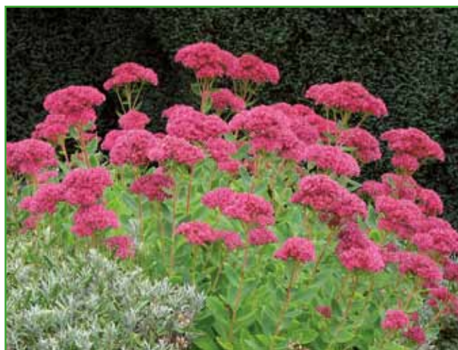
Cvetove pri hermeliki pustimo do spomladi.

svojega dela, sadijo trajnice načrtovano.