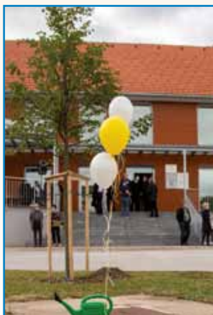
BALONČEK IZ SLOVENIJE... stran 4