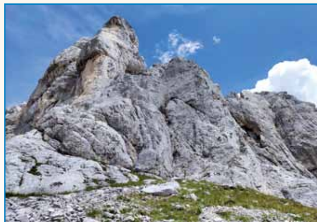
»OJ, TRIGLAV MOJ DOM« stran 8