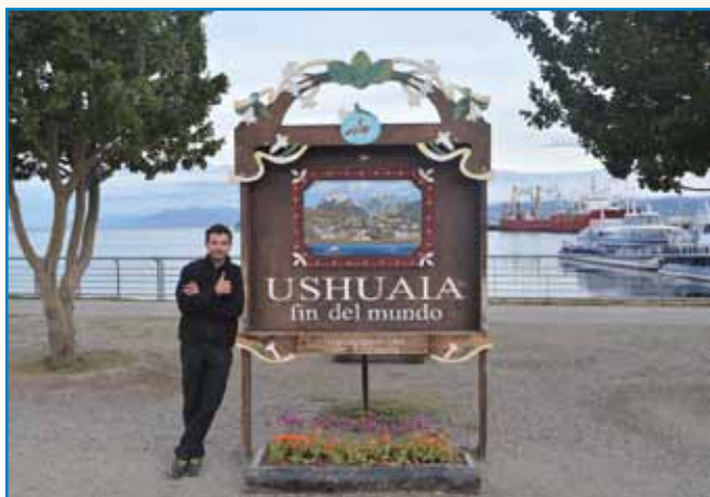
NARAVOVARSTVENI NADZORNIK NA GORIČKOM stran 3