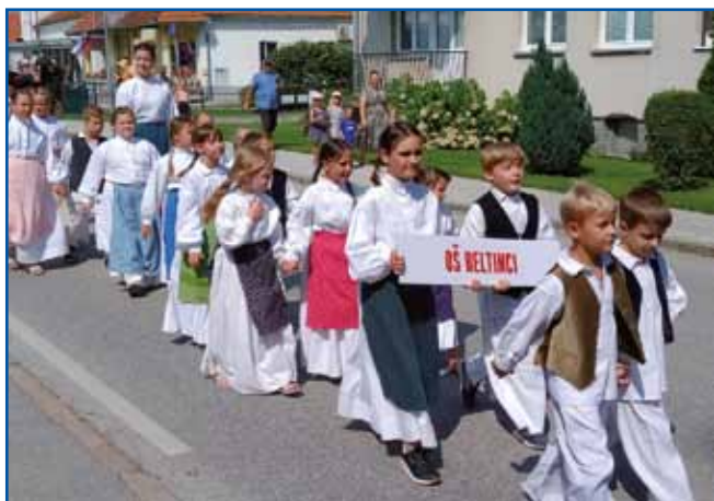
Najmlajša generacija beltinskih folkloristov

S srečanjem odraslih folklornih skupin Slovenije z naslovom Praznik slovenske folklore se je končal 51. mednarodni folklorni festival Beltinci. Sklepna prireditev se je začela s povorko nastopajočih folklornih skupin na prireditveni prostor v beltinskem parku. Do tja so se sprehodili ob zvokih domače Plej bande Böltinci, ki je šla na čelu povorke za tremi pozvačini.