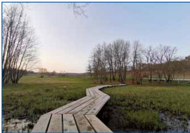
V Lončarovcaj so vrejdvzeli Paut v močvaro.