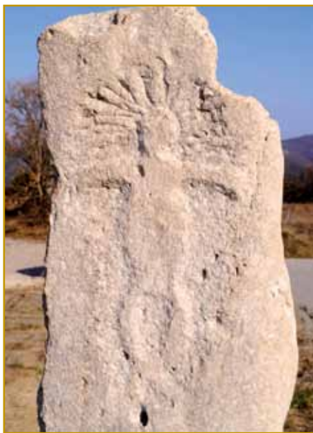
Domanji tomi melhirji bejli kamen pravijo. Dva pa pau mejtra visiko sega, eden mejter v zemlau je zakopani. Na obeh krajaj je relief nutusejkani.