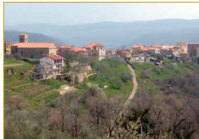
Tak Koštabona gnes vögleda, gda so že vküpersünjene rame lidge iz »kontinenta« dojküpili. Tau se po tejm tō leko vidi, ka ciglene (črepnje) streje majo. Starim ramom v Istri pa v Koštaboni ranč tak so streje s ploščami iz kamna pokrivali. Na pravom kraji se lepau leko vidi, kak če bi se skrak vesi zemla dojutrgnola. Tam spodkar skrak reke Dragonje so lidge indasvejta svoje njive pa paula meli. Tisti tradicionalni pavrov gnesden več skurok nega.

tau pogansko mauč dojstavo. Vejmo, arhangel Mihael za najbolje prejgnjoga bože sodačije vala. Cerkev je melhir za vrajži kamen dala vözglasiti. Depa, niške ga