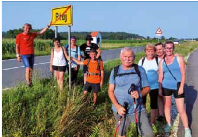
Zmantrani pohodniki pri tablici Ptuj, od tü nas je še čakala duga paut.

naprej. Baja samo telko bila, ka smo sploy velke višine zopodli, tau je pa nam peti den že sploy nej falilo. Depa dosta nam pomagalo, ka tü so se nam že planine odprle, taše razglede smo meli na Krvavec pa na bližnje hribe, ka bi lepše namalati nej mogli. Šesti den smo do Pokljuke šli, depa tü smo že naletja bili, pridružile