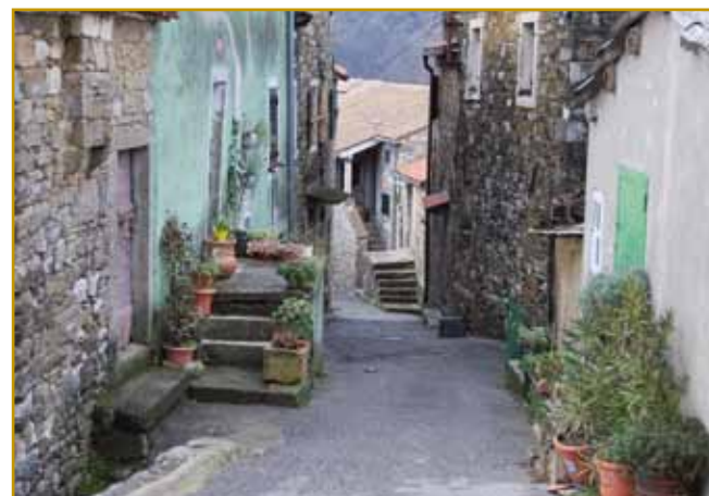
V Krkavčaj mrtvi rami skrak živi stojijo. Tau se po tejm tō leko vidi, ka so fasade gor na kamen napravli. S tejm veliko škodo stari arhitekturi delajo. V Istri so kamen nigdar nej v kakšo farbo nutzravnali.

je nej vüpo dati dojpodrejtj. Stra je velki majster, se eške gnesden tomi pravi. Lidge radi na tau mesto puno mis-