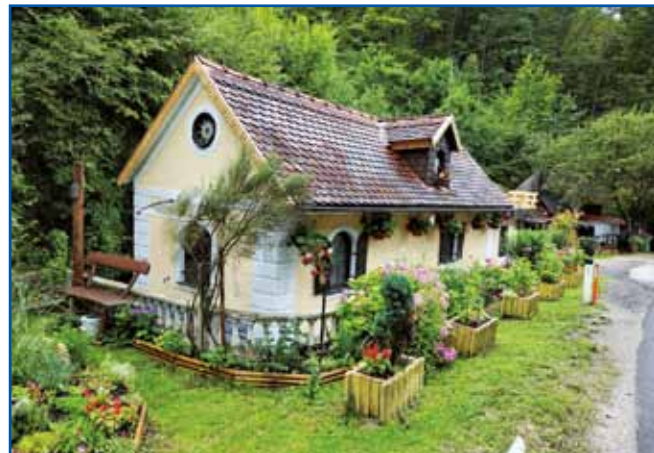
Med potjauw smo vidli trno lejpe hišice.

združuje slovenski narod, tak nas, porabske Slovence tö. Tau pravijo, ka si nej pravi Slovenec, če si še nej odo na Triglav. Mi smo letos že desetič zopodli tau nej kratko paut od Andovec do Triglava. Na tej dugi pauti je mir, samo ti pa düša se sprvajata. Tau najbola te čütiš, če si malo dolazaausto, če si sam austoy, gda te sonce pa veter baužata.