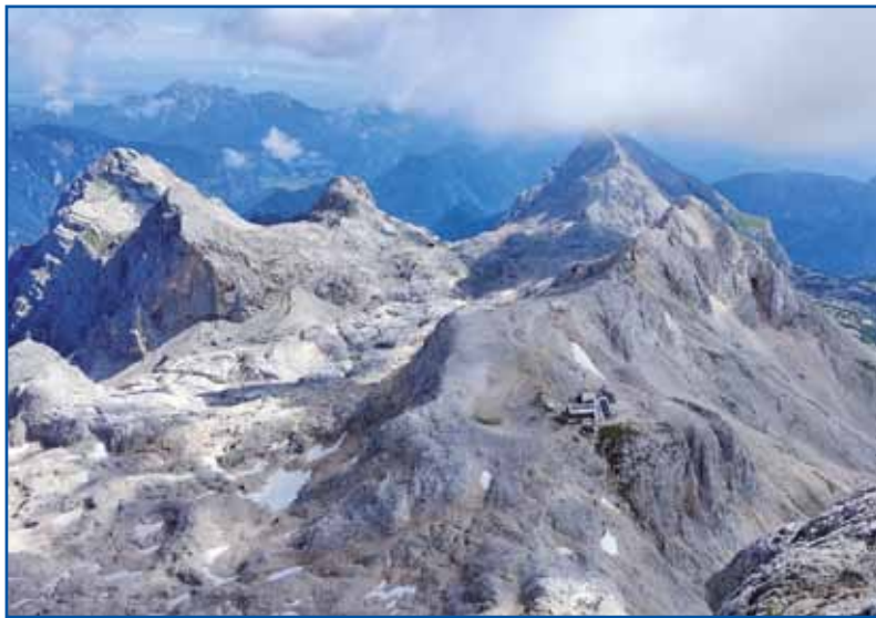
Pogled z vreaka na Triglavski dom na Kredarici

oni so tö nej zdaj začnili, cejlo Slovenijo so že zopodli, od Novega mesta do Kranja, vse. Gde mo spali med potjauw, so pitali. V hosteli, v apartmajy,