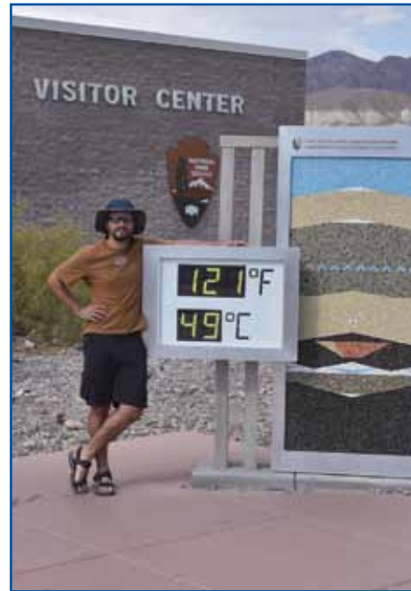
V Meriki je bilau fejst vrauče.

Brodim, ka tudi vas zanima, ka dela naravovarstveni nadzornik: »Nam bi se leko po domanje pravlo tudi rangeri, tak kak jih majo v Meriki v nacionalnij parkaj. Naša naloga je, ka pazimo, ka se v naravi ne bi delali prekrški, se pravi, ka se dela tak kak pravijo zakoni, spoj tisti, steri se spravljajo z