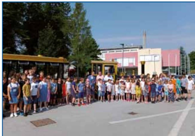
Otroci iz dobrovniškega vrtca in dvojezične osnovne šole so bili nad vožnjo navdušeni.

za upravljanje, torej vožnje z vlakcem, skrbel Zavod za okolje in turizem Dobrovnik. Uporabljali ga bodo za potrebe turizma v dobrovniški občini. S PMSNS, ki je lastnik vlakca, so se dogovorili, da bo na voljo tudi sosednjim občinam.