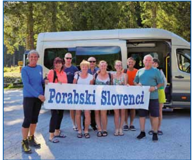
Gasilski kejp na Pokljuki

Zavolo napovedanoga lagvoga vremena, so na paut šli že dva dni prva, tak ka so do ponedjilka, gda je biu