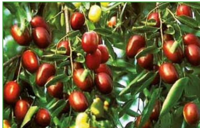
Žižola ima veje posute s trni.

Spomladi se najprej pojavijo cvetovi čokoladne barve, ko listi šele začenjajo poganjati. Asimina je drevo, ki zraste 4-5 metrov