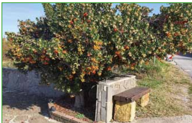
Jagodičnica - plodovi dozorijo leto dni po cvetenju.

in je nezahtevna za gojenje, saj jo sadimo v ilovnato zemljo z dodatkom domačega komposta in malo peska. Dobro je, da v prvih dveh letih cvetove odtrgamo zaradi izčrpavanja hranilnih snovi ter napravimo zastirko. Asimino uporabljamo tudi v okrasnem vrtu, saj ima lepo pi-