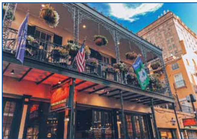
New Orleans je nej več tak živi, kak je biu ške pred leti.

je Afričane iz Afrike pripelo v ZDA, vej pa se je jih dosta več vkrcalo v Afriki kak jih je te živih prišlo v Merko.«