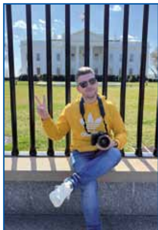
Sandi v Washingtoni, pred »bejlou hišov«

tičejo vsej zveznih rosagov. Ovak pa morem ške prajti, ka smo si poglednoli tüdi najvejši muzej zgodovine Afroameričanov in spoznali njihovo najbolje kmično zgodovino zasüžnjevanja. Ške ejkstra so me šokerale številke za vsakši šift, steri