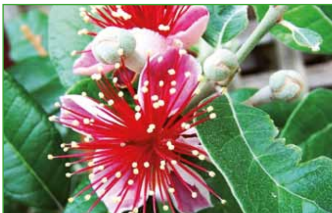
Fečoja z zanimivimi prašniki

Skorš kot pozabljeno drevo je pred desetletji krasilo skoraj vsako domačijo. Danes se dobijo sorte z nižjo krošnjo. Plodovi v obliki jabolok so zelo okusni, v polni zrelosti mehki in umedeni, to je v oktobru po prvi slani, okus je sladko kiselkast z veliko pektina. V enem socvetju tvori cel šop drobnih plodov. Dekorativne so tudi njegove veje v olivno rdečih do rdečih odtentkih. Pri sajenju bodisi okrasnih bodisi sadnih rastlin moramo biti pozorni pri nakupu sadike, imeti mora dobro razvit koreninski sistem in pripravljena tla, oziroma dovolj veliko jamo, kamor bomo sadili, ter pri mladih sadikah začetno oskrbo.