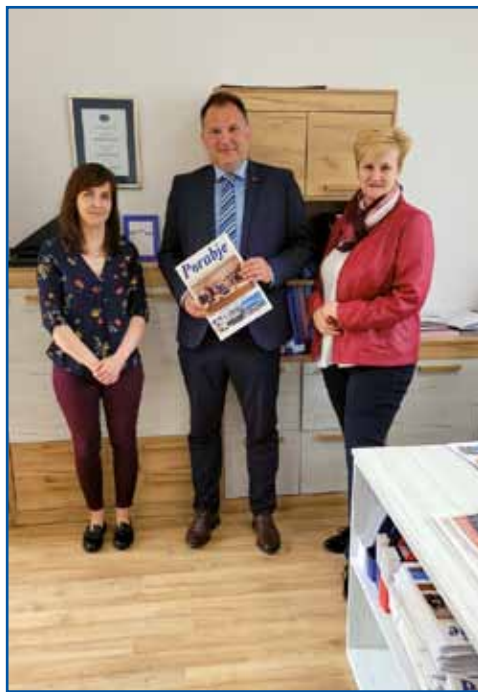
Župan je obiskal tudi uredništvo časopisa Porabje, ki ga redno spremlja.

V kulturnem in informativnem centru je soboški župan obiskal uredništvi časopisa Porabje in slovenskega Radia Monošter ter pohvalil oba medija, ki tedensko oziroma dnevno obveščata porabske Slovence v maternem jeziku in na ta način krepita zavest o narodni pripadnosti. Soboška občina prejema časopis Porabje in župan ga z zanimanjem prelista. Kot je povedal, se bo potrudil, da bo Porabje v prihodnje bolje spoznal in čim večkrat izkoristil priložnost za obisk. »Uradno sem danes prvič v Porabju, februarja pa sem že bil tu, ko sem se udeležil borovega gostüvanja v Števanovcih. Pokrajina in narava sta zelo lepi, tukaj živeči ljudje pa so res dobri in prijetni.