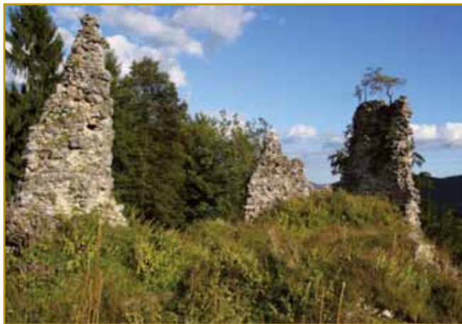
Tau je vse, ka je od indašnjoga grada grofov Ortenburški ostanolo. Grad je malo prejk 100 lejt živo, ka potejm so grofovge v centri Radovljice dali nauvoga gorpostaviti, kaulak pa velke pa kuste stejne napravjati. Vküper s tejm Radovljica svojo fvaro dobi. Vlatinski dokumentaj leko tapreštemo, sto je prvi dühovnik biu: plebanus Laurentius.

tal trbelo meti. Kak je stoj do toga prišo, tau pa že drugo pitanje gé. Vsigdar se je na velke norilo, kak gnes tak indasvej-