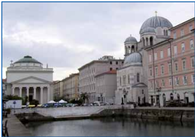
Konec Veukoga kanala s katoliškov cerkvov svetoga Antona na levoj in pravoslavnov cerkvov svetoga Spiridiona na pravoj strani

me gorprijali kak svojoga padaša, zvün nauvi poznancov pa so na srečanje prišli stari obrazi tö. Dugo v nauč smo se pogučavali od toga, kak uni v tistom veukom varaši pri maurdji skrb majo na svoj slovenski gezik in kulturo, pa kak tau činimo mi, tristau kilometrov kraj.