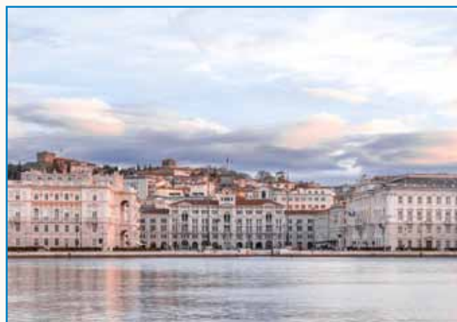
DVEJ VÖRI V VARAŠI S FARBASTOV KULTUROV stran 10