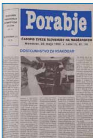
PISALI SMO PRED 30. LETJI stran 5