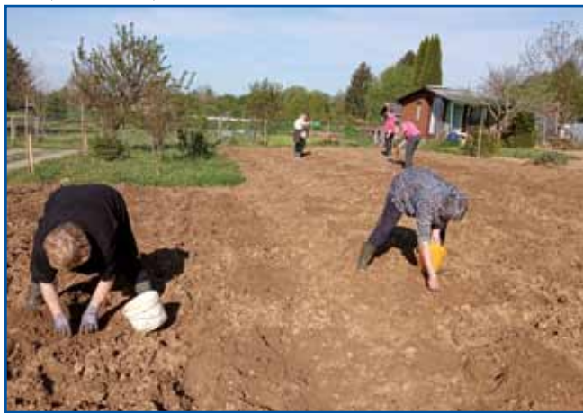
Flajnsne roke žensk so brž napuntile njivo z goškicami.

koj se on dobro razmej. Meli smo zgončano terek za sadit guščice, depa pauleg deža