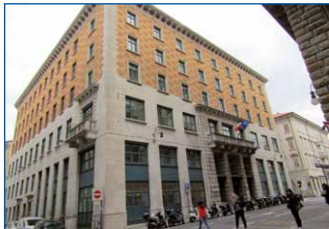
Tak gnes vövidi Narodni dom, šteroga so leta 1920 gorvužgali taljanski fašisti, stau lejt kisnej pa Italija povrnaula Slovincem.

pamet vzeu, ka je Trst rejsan eden pravi veuki varaš. Vseposedik sem vüdo zidine na več štaukov, štere so me spominale na poznano avstro-ogrsko arhitekturo. Po poštijaj so naglo lejtali autonge in busi, ka