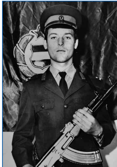
Laci kak sodak

lali, vejn zato, ka te je še nej bilau pametnoga telefona pa računalnika. Dja sem srečen bejo zato, ka skrak je bejla šaula, zazranka je nej trbelo