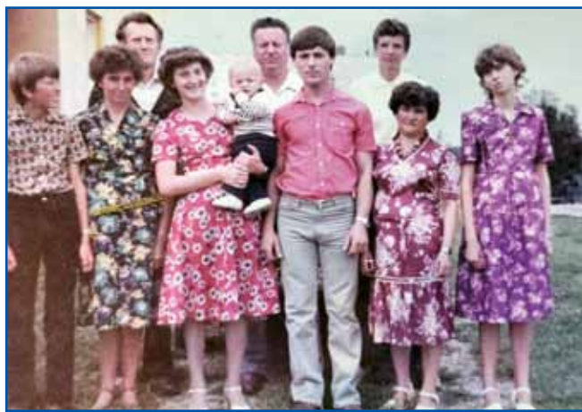
Laci kak mladi oče na srejni kejp, pri njem stoji žena z detetom v rokaj.

»V tretjom razredi je ranč tak vōprišlo, ka eno leto je name tō včila. Tau je nej bilau dobro, zato ka te sem se še bola mogo včiti kak če bi me druga učiteljica včila. Pa leko povejm tau tō, ka do mene je dosta bola sigurna (stroga) bejla, kak do drugi mlajšov. Sledkar, gda sem že v višje razrede odo, je tō nej bilau dobro, dja sem