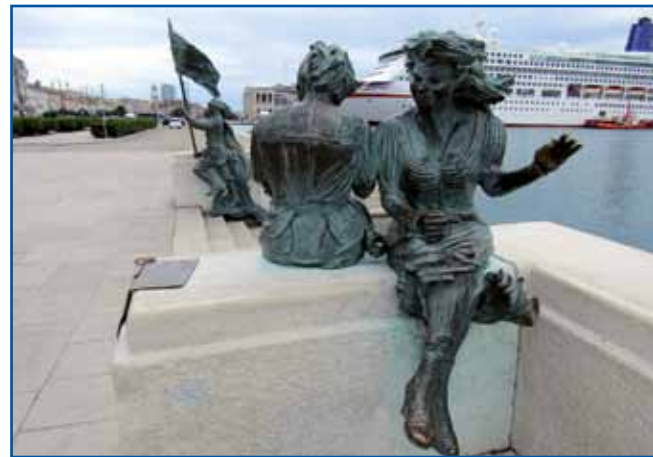
Spomenika sodakov pešakov in flajnsni sabolic na Trgi enotnosti Italije, včasik pri Jadranskom maurdji

Leko sem pa nutstaupo v cerkev svojoga pravoslavnoga patronuša. »Dušan« je staro slavsko ime, svetca s takšim imenom nega. Znamenüje pa »düša«, ka bi na grčki med drügim leko obrnauli