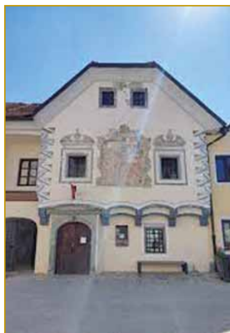
Šivčeva hiša je tō svoj stüdenec, vodnjak mejla. Kaulak leta 1580 je ram dala držina Kogančič zozidati. Mogli so bogati biti, od toga nam fasada pa freska na njoj pripovejdata. Prva držina Kogančič je že skur tapozablana, hiša ménje po zadnjjoj držini Šivec nosi. Ranč uni so jo leta 1970 svojomi varaši Radovljici v dar dali.