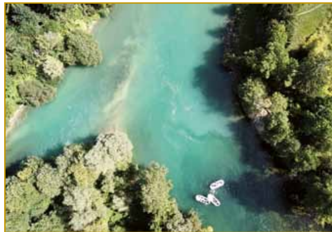
Tak doj z lufta vögleda, gda iz dvej menjši rek vekša grata. Obej menjši Savi doj s planin pritečeta, zatoga volo tak bistrivi, čistivi vögledata. Radovljica se je že od inda na terasi više Save naselila.

emo. Se je z velikaši zgučavo, kak do se med seuv razmeli. Gnes bi prajli, ka svojo prec velko avtonomijo so meli. Zdaj že leko špekulejramo, ka kakši Rado je pri kosezaj na