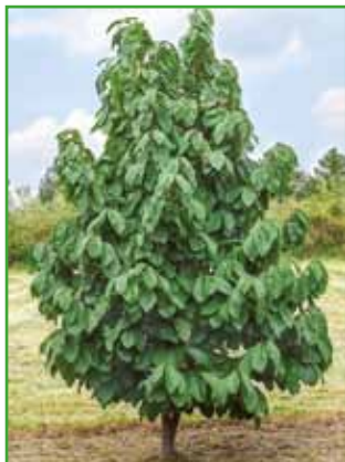
Asimina ima lepo piramidasto obliko.

Asimina - indijanska banana krasí naše vrtove že kar nekaj let. Je križanec med banana, mangom in ananasom.