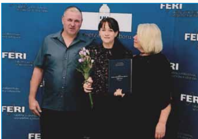
VNŮK JE V RAM PRINESO SREČO IN VESELDJE stran 5