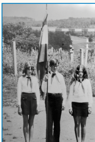
TE STANEM, GDA SE PREBIDIM stran 8