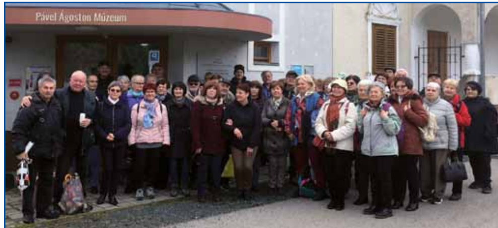
Pred 40 lejt starim Muzejom Avgusta Pavla

Letos je rano bila cvejtna nedela, 2. aprila. Fejst smo se gornaravnali, ka smo brodili, ka de mrzlo. Iz Sombotela do Monoštra smo se pelali s cugom, ništerni pa so z av-