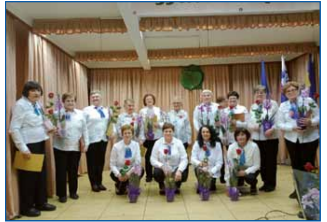
Lipovske ljudske pevke in moški pevski zbor večkrat nastopajo skupaj.

je povedala, da je bilo skupinsko ljudsko petje v Lipovcih zelo priljubljeno med ljudmi že pred ustanovitvijo skupine ljudskih pevkv. Že v dvajsetih letih prejšnjega stoletja je bilo petje v povezavi z verskim življenjem zelo dobro organizirano, to obdobje bi lahko poimenovali tudi ljudsko