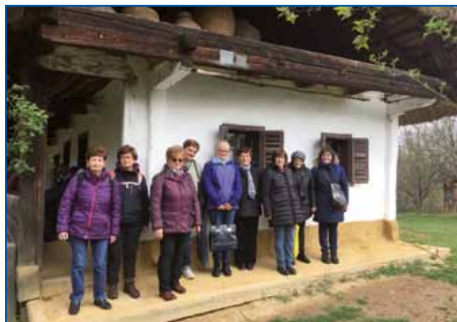
Ništerni sombotelski Slovenci v vési Szalafő

v jugozahodnem Prekodonavju, Slovenci v okolici Mo-