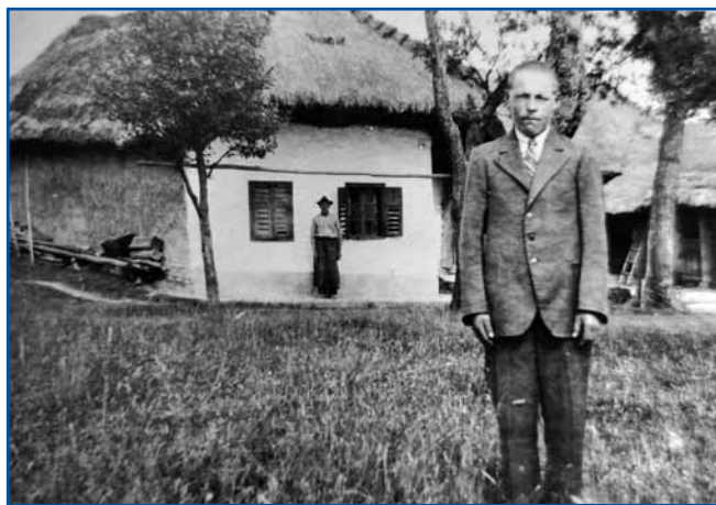
Njini stari, ešče s slamov pokriti ram. Naprej stodji stric (materni brat), zar, na podauknaj pa dejdek, steroga je Iluš nej poznala.

ram leta 1970 začnila zidati, dja na tau dobro vardjam, zato ka te sem že tak dvanajset lejt stara bejla.«