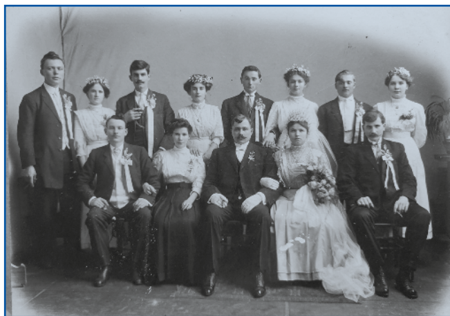
Zdavanjski kejptetice iz Amerike

- Če gledam te stare kejpe, spoj dosta je taši, steri so se