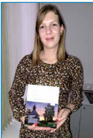
»GORIČANEC SIŠ, GEKOLI ŽIVEŠ« stran 5