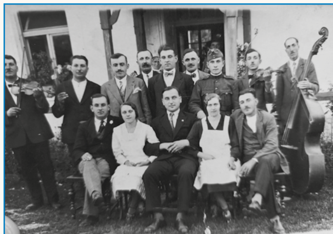
OČA JE SVOJO GRABO KOPO stran 8