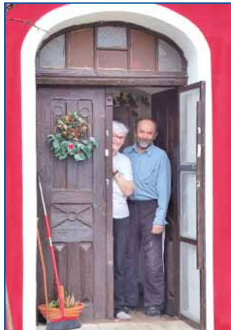
Marika z možaum Jožinom na pragi domanje izše

te je nazaj v Meriko odišla za matardjo. Tista dvera pa okna so tøj pri nas, zato ka gda je ram prazen grato, te so tista okna tøj nutrazozidali leta 1936. Zato ka odprejti