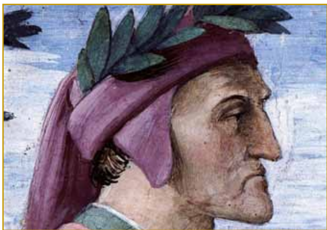
Velki pesnik Dante Alighieri je na glavej leko škrlat noso. V svojom časi je med velkimi največji biu, steri so pero v rokaj držali. Na toj staroj slici se zatoga volo leko vidi, za kak velkoga so ga lidge meli. Gnes škrlat leko vsi nosimo, kemija nam je tau naprajla

riške so ga v viske šaule dali, fiškališ je grato. Ka vse je delo, zdaj nemo dojdavali. Skrak