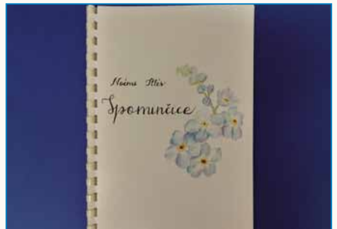
SPOMINČICE stran 10