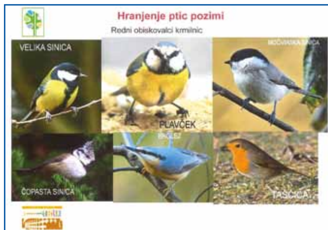
Del prezentacije o pticah. Strokovnjak je spregovoril tudi o najprimernejših načinih hranjenja ptic

Podal je tudi nasvet o hranjenju ptic – hranilnice ali podstavke za hrano, obešanke (lojna pogača) in drugo hrano pticam vedno nastavimo na kakšno drevo ali visok grm, kjer mačke nimajo dostopa, ptice pa imajo dober razgled na okolico. »Krmilnica pa mora imeti streho, da ne bi kakšen dež ali sneg namočil hrane, ker imajo ptice potem težave. Pomembno je še, da krmilnico čistimo, predvsem zaradi zajedavcev ali kakšnih bolezni. Enkrat tedensko bi jo morali očistiti. Glede hrane so klasika sončnice in kakšna druga seme-