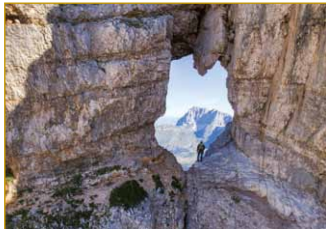
Gda so lidge indasvejta tau »okno« na gori Kanin vidli, gvüšno ka njim je dosta vsega na pamet prišlo. Tau 10x7 mejterov velko okno je mati narava naprajla. 2390 m visko stodji. Vsi go kak Prestreljeniško okno poznajo. Inda so njemi Vragovo okno tō prajli

baja naprej pride. Same nesreče bi se godile, lidi bi na nikoj dejvale. Gda je skur skrak nje prva velka bojna lidi vmarjala, se je vōrvalo, ka vila Škrlatica je nej pravi čas tistoga cvejta