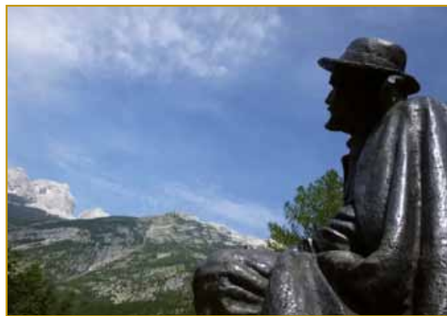
Kugyni so planinci pa alpinisti v Trenti spomenik dali postaviti. Za vsigdar gore gleda, stera je tak nebesko rad emo. Od nji je vnauge knjige napiso, od planinski korin pa bildja je piso, vnaugim je prvi ménje dau. Julius Kugy je alpinizem popularnoga naredo, sploj se ne vej, na sterom vřiji je nej biu. Zavolo njegovoga znanja so alpinistične sodačke divizije gratale, za inštruktora so ga meli

se je 1858 v Gorici naraudo. Doma so slovenski, nemški, talanski pa ške v staroj furlanskoj rejči gučali. Oba stariša sta Slovenca bila, oča s Koroške se je Kogej piso, sledi se je tau v Kugy vōobrnulo. Depa, Gorica je na granici vsej tej štiri kultur pa rejči živela. S tejm se je Julij že kak pojbič srečo. Sta-