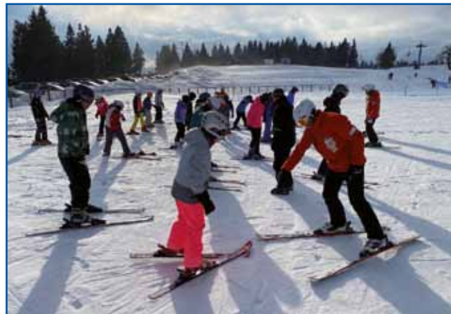
Pri Zvezi Slovencev bodo tudi letos organizirali šolo v naravi na Rogli

organizacija seveda največ pozornosti namenja kulturi, se - predvsem prek Razvojne agencije Slovenska krajina - ukvarja tudi z gospodarskim področjem. V okviru programa spodbujanja gospodarske osnove avtohtone slovenske narodne skupnosti na Madžarskem 2021-2024 so se v