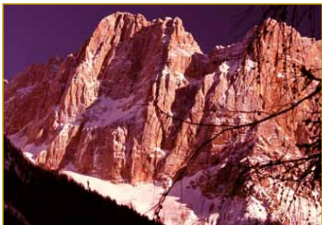
Pravijo, sto Škrlatico takšno v živo vidi, nigdar jo ne pozabi. Kelko je poznano, prvi je na njau Julius Kugy staupto, leta 1880 se je tau zgodilo. Na vřiji Škrlatice velki križ stodji, za vse tiste slovenske planince pa alpiniste je postavljeni, steri so v planinaj preminauli

za Triglavom za drugo najvišišo goro v Sloveniji valá. 2740 m visko se zdigava. Depa, nje no ménje je tisto, od steroga smo pripovedjali. Tak Škrlatica vōgleda, gda se sunce začne