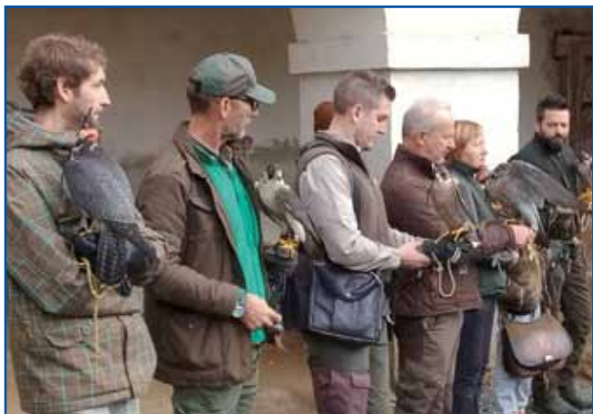
V Beltincih vsako leto organizirajo mednarodno srečanje sokolarjev

Društvo sokolarjev Pomurja povezuje lastnike in ljubitelje sokolov ter drugih ptic ujed s goj pa je ljubezen do ptic in sploh do narave,« pravi predsednik Društva sokolarjev