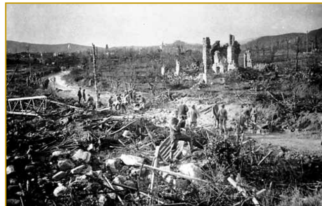
Tak je eden tau Tolmina po konci bitja vögleo. Zaprav, sploj je nika nej vögleo. Prejk dvajsti lejt je trbelo, ka so Tolmin nazaj gorpostavili

vörvanji škeli pokloniti. Zato ga volo je iz sausadnoga varaša Čedad sodačija nutvdarila, njive stare simbole pa sveta mesta so njim vničili. Leko povejmo, ka za cejlo velko ink-