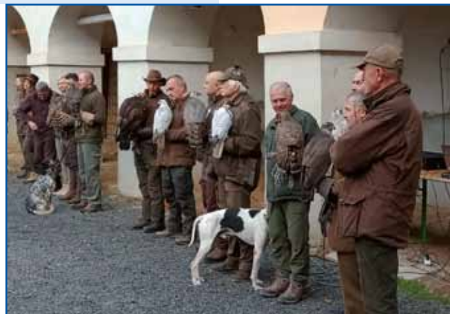
Udeleženci so iz Slovenije in sosednjih držav

»Vzgoja ptic ujed zahteva veliko truda in znanja, po-