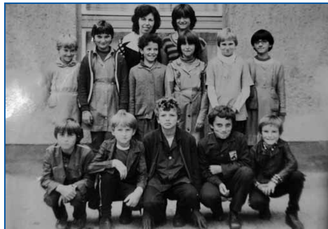
Šaularge števanovske šaule. Dinda pravi, ka je samo zatok rad v šaulo ojdo, ka je leko špilo nogomet pa rokomet

»Dja sem samo v Števanovci špilo nogomet, najprvin v mali ekipi od leta 1990 do 1992. Te sem rutjivo, gda sem