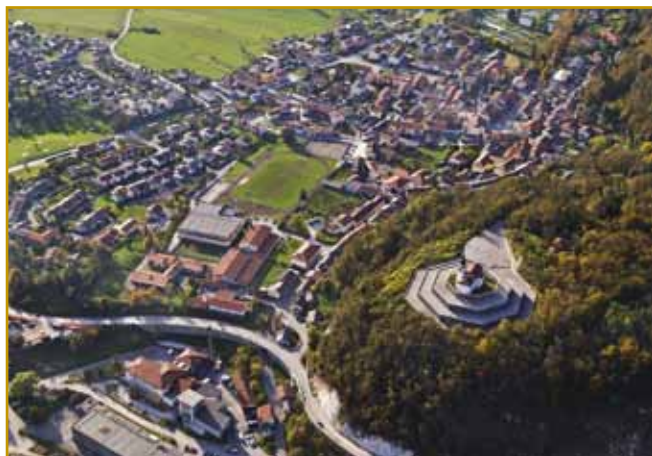
Kobarid se je inda samo na terasi više Soče »stiskavo«. Na brgej više varaša cerkev sv. Antona stodji, kaulak nje pa so v lejtaj po prvaj velkoj bojni graubišče napravili. V njem gnes 7014 čunt (okostje) poznani pa nepoznani talanski sodakov počiva

za sebe krajvzele. Nej samo Kobarid, dosta drugi vekši ali menjši varašov je vcejlak vničeni bilau.