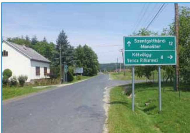
Obnoviti je treba cestne povezave med Monoštrom in porabskimi vasi stran 4

VEČ KAK 200 POHODNIKOV SE JE PODALO NA PAUT MED BÜDINCI PA ANDOVCI