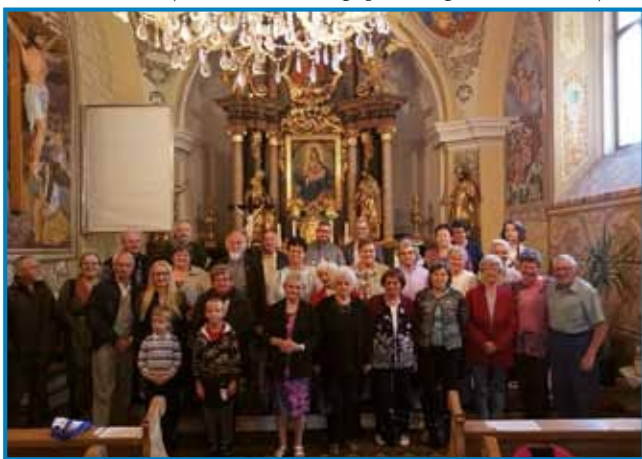
Romarji po maši v cerkvi v Dolencih