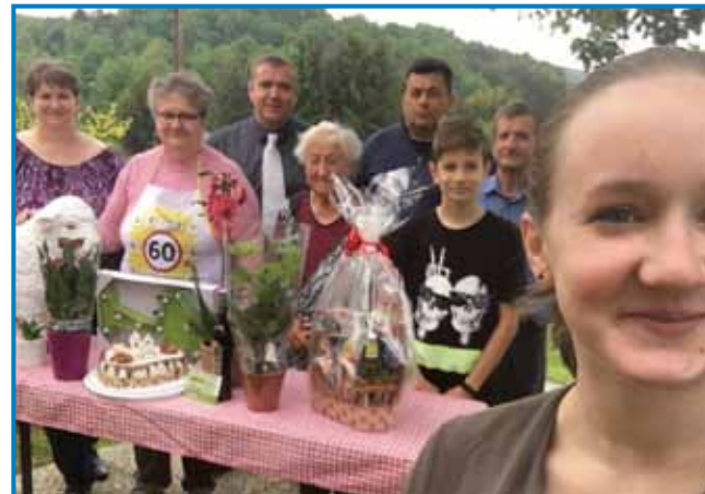
Na ženinom 60-om rojstnom dnevi

»Vsefele, ka smo meli. Bilau tašo, ka dvajsti litrov pörkölt