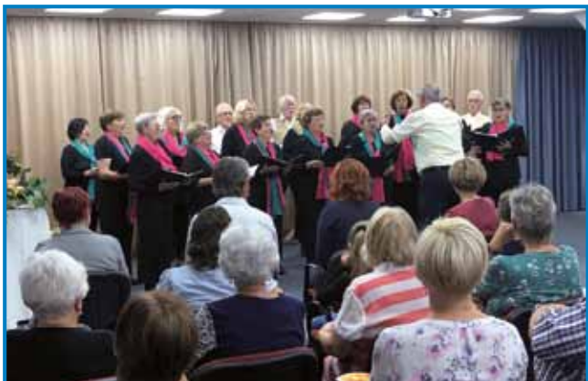
Mešani pevski zbor Slovenski dom iz Zagreba poje slovenske ljudske, tradicionalne in umetne pesmi - letos praznuje 90-letnico delovanja.