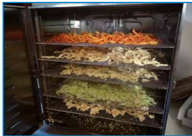
Zelenjave v sušilniku

kuhanju. Posušena jušna zelenjava brez dodane soli je kakovosten, enostavno pripravljen shranek za ozimnico, ki ga uporabljamo za pripravo vseh vrst juh,