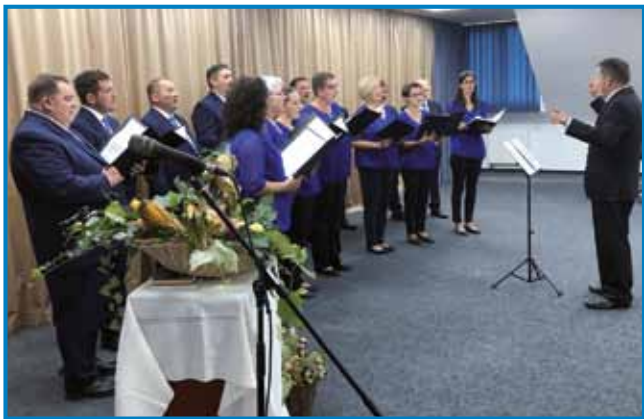
Mešani pevski zbor Avgusta Pavla ZSM z Gornjega Senika se že več kot tri desetletja udeležuje taborov slovenskih pevskih zborov v Šentvidu pri Stični, kjer srečuje tudi druge zamejske zборе.

sveta. »Prišlo je enajst združenj, od Švedske do Avstralije, od Sarajeva do srbskega Zaječarja. In seveda še druga društva iz Slovenije,« je povedala predsednica in pristavila, da so na četrti mednarodni pevski fes-