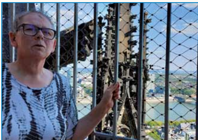
»Ferencváros, Ferencváros« stran 4