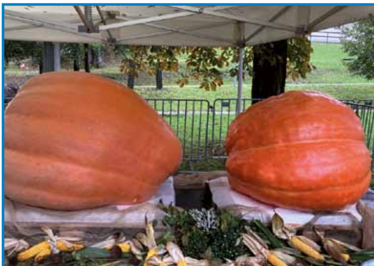
Buči, ki sta bili razstavljeni na festivalu v Óriszentpéteru

Ádám Vajda iz Sakalovcev ima ne-navaden konjiček. V prostem času se namreč že dve leti resneje ukvarja z gojenjem buč velikank. Leta 2021 je prvič nastopal na 17. festivalu buč v Órségu z bučo velikanko, ki je tehtala 180,9 kilograma. V letošnjem letu pa mu je uspelo vzgojiti kar dve buči velikanki. Prva je tehtala 320, druga pa 465 kilogramov. Organizatorji so ga tudi letos privabili k sodelovanju na festivalu buč v Órségu, kjer je dobil naziv