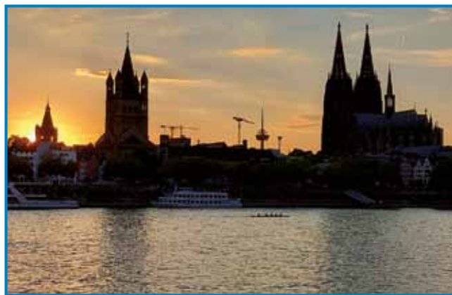
Večerni pogled na center Kölna

V Kölni, steri ma malo več kak milijon prebivalcov, so se špilale tekme B skupine evropskoga prvenstva v košarki. S sestoro Editto sve se že lani odlaučili, ka de tau cilj najnoga letošnjoga dopusta. In tak je bilau tó. Paut iz Murske Sobote do štrtoga največšoga varaša v Dajčlandi je duga, malo več kak 1000 kilometrov, zatau sve si že prva tak vözbrodile, ka ve šle na paut en den prva kak je bila 1. septembra zadvečarka