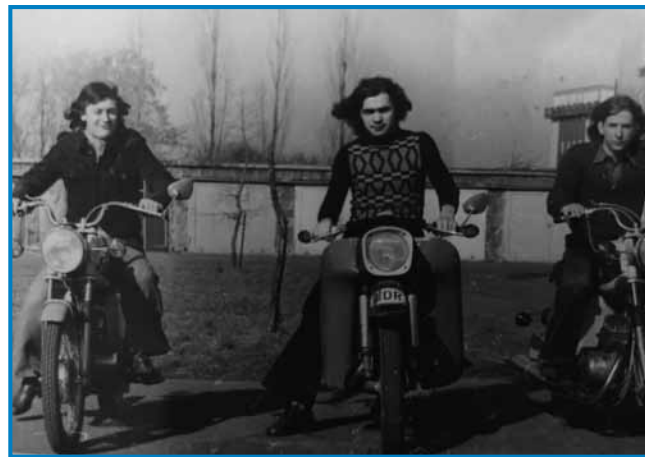
Podje so iz DDR-a večkrat prišli domau z motori

do Bulgarije, tauga so tak zvali, ka Meridian ekspres. Na taum cugi je telko lüstva bilau, ka največkrat si ranč dolasesti nej mogo. Bilau tak, ka smo se s fligarom pripelali, te smo se najprvin dvanaj-