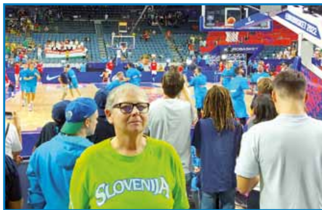
Tekmo med Slovenijo in Madžarsko sam si leko poglednola čista blüzi igrišča

Stolnica svetoga Petra, stero so začnili zidati že davnoga leta 1248, je