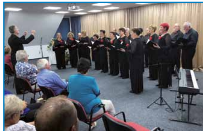
Korenine MePZ Ivana Cankarja z Vrhnike segajo v 70. leta 20. stoletja - v središču njihovega repertoarja so klasična zborovska dela in za njih uglasbena Cankarjeva besedila.