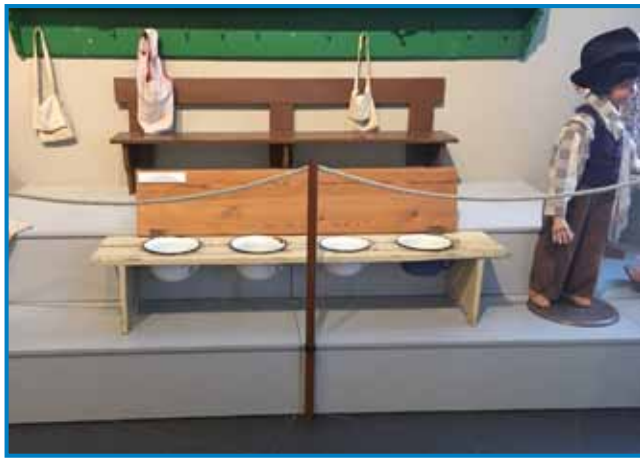
V Muzeji vrtcov leko spoznamo zgodovino té mlašeče inštitucije - na kejpi »zimski šeblinge«, štere so nücali do 1960-i lejt

komunizma - Lenina, Marxa in Engelsa. Prva, kak liki bi pa nutstapili v park, leko eške sédeme v eden Trabant, ka je za mlajšo generacijo