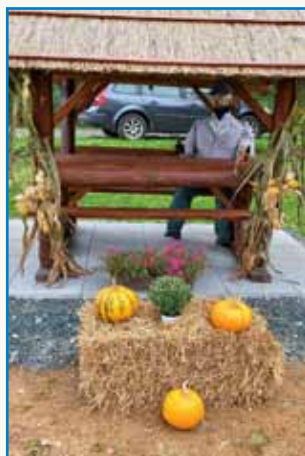
Aktivni Otkaučani za svojo lepšo ves stran 6