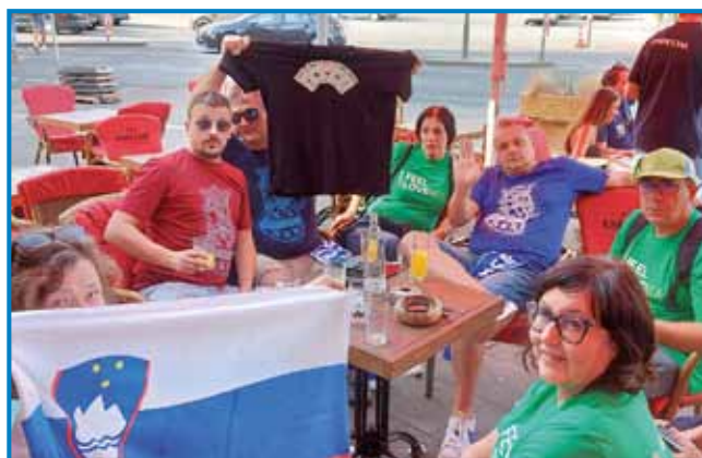
Slovenski in bosanski navijači v Kölni