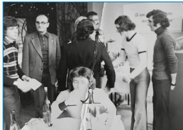
Naši podje so delali v DDR-i stran 8