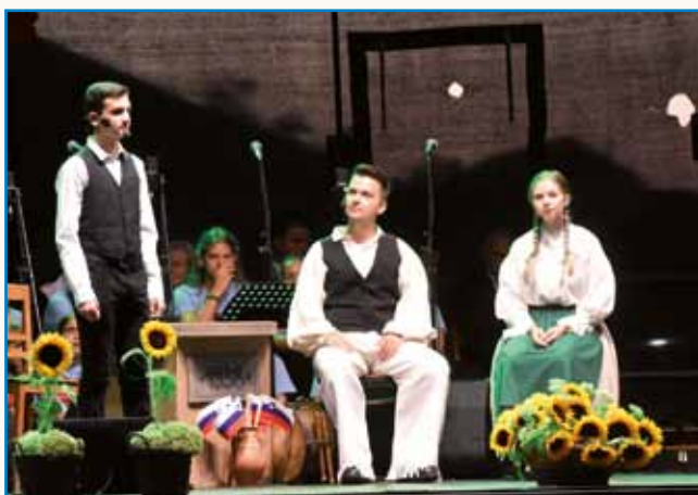
Slovenec sem! Slovenka sem! Slovenci smo! stran 3