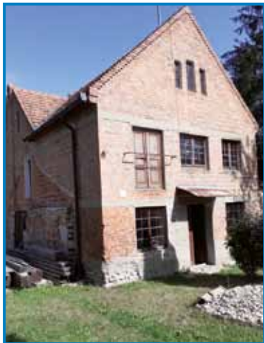
Nekdanji mlin na Gornjem Seniku

Državna slovenska samouprava je odkupila 125 let star mlin s pripadajočim zemljiščem na Gornjem Seniku. Podpis kupoprodajne pogodbe, s katero je nekdanji Filo mlin prešel v last krovne organizacije, je potekal v četrtek, 18. avgusta, v ožjem krogu na sami lokaciji kupljene stavbe.