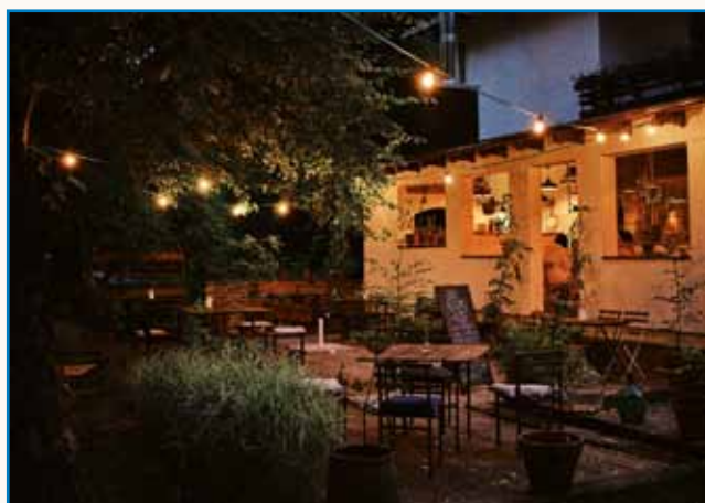
»Trbej si napraviti tak, ka ti je vredi« stran 7