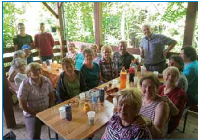
Kak veselo so si spočinili, tak veselo so se vrtili med grmauvi vsi vküper

Slovenski narod je prej trno delavan, Slovenci so flajnsni, ne menjarijo, ne poznajo trüdnost, na tejm so, aj vse baugše opravijo svojo delo. No, depa tau tü istina, ka so naše porabske Slovence drüge narodnosti ranč zatoga volo nej mele rade v fabrikaj, ka so na telke gnali delo, ka so paul leg niji eške norme gorazdigavali. Tau flajnsnost, pridnost Slovincov