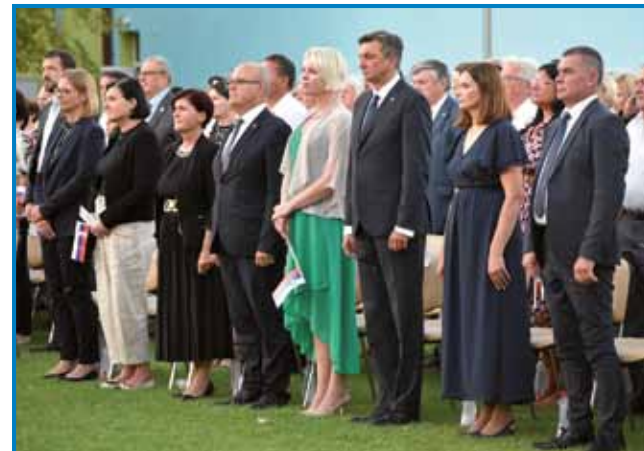
Na proslavo je prišlo veliko visokih gostov, med katerimi je bil tudi predsednik države Borut Pahor

vedamo svojih korenin«. Predsednik države Borut Pahor, ki je pred proslavo v skladu s tradicijo položil venec pred spomenikom Jožefa Klekla, je v slavnostnem govoru najprej opozoril na skupno odgovornost do skupnosti: »Ne morem, pa tudi ne znam dovolj poudariti, kako