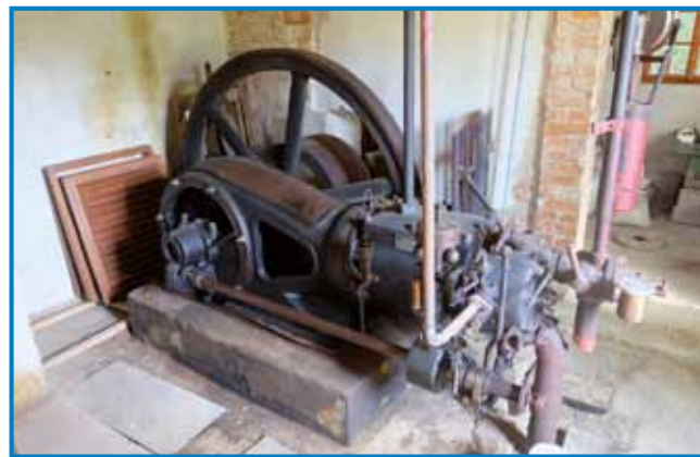
Motor na paro

mlinsko kolo poganjati na izvirni način. Za vsa ta dela so že na razpolago kompleksne študije in načrti. Po vseh obnovitvenih delih bi obiskovalcem predstavljali