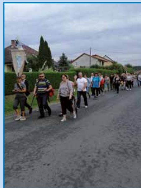
Verniki na poti