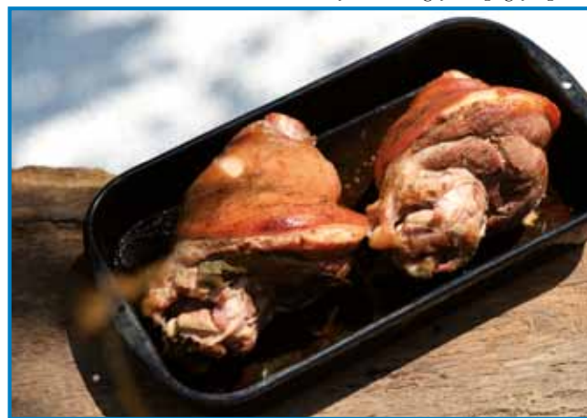
V Zelenom gaji küjajo in pečejo samo domanjo prekmursko pa slovensko rano