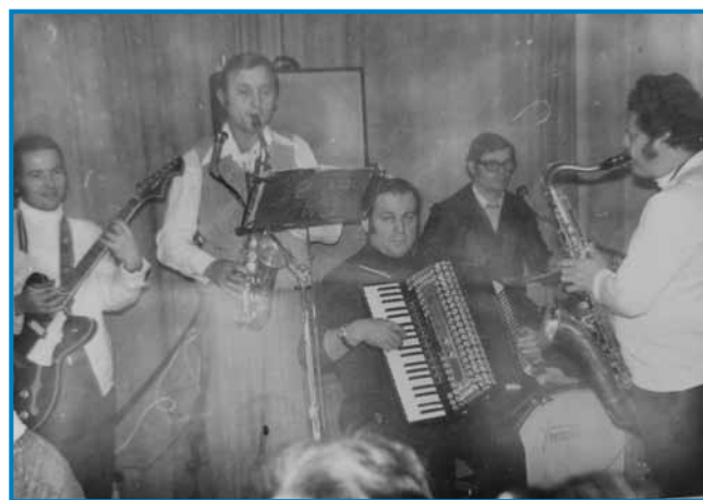
Makoš banda je bila gnauksvejta trno irešnja po Porabji

ženo so za vraga nej steli. Gda so name tū v Sakalovci steli, aj párttikár (partijski sekretar) baudem, te sem dja pravo, ka nej, pa še párttagkönyv (izkaznico) sem doladau. Zato ka mena se je nej vidlo, ka drūdje vse goradjamejo,