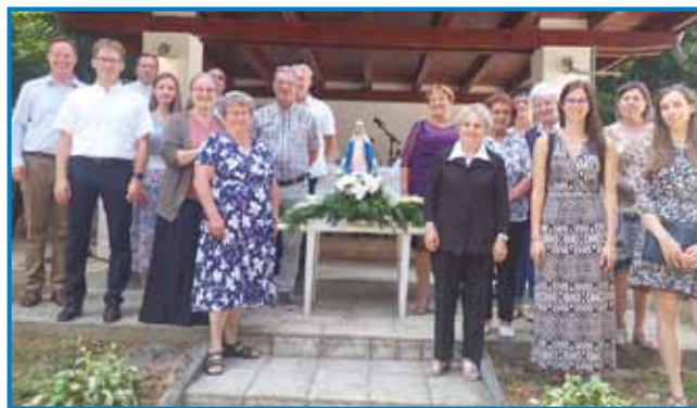
Porabski verniki v Pusztacsátáru

V Pusztacsátáru, ki administrativno spada pod Vaspör, potekajo redne maše, vendar je glavno proščenje v kapelici, zgrajeni Mariji na čast, vezano na dan Blažene device Marije, to je 15. avgusta. Svetišče na gozdni jasi običajno gosti večdnevni program ob koncu tedna, ki je najbližji cerkvenemu prazniku, in tako je bilo tudi letos.