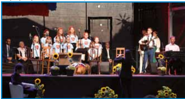
Kulturni program je pripravilo Kulturno-turistično društvo Črenšovci