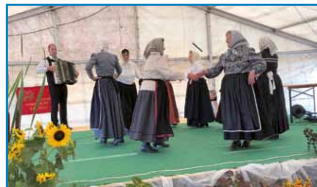
Na srečanju penzionistov so zaplesale tudi porabske penzionistke