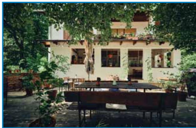
Krčma Zeleni gaj

samo dva dneva v kedni, pa tau ne drži, vej pa trbej v torek krčmo pucati pa kaj popravlati, v sredo in četrtek pa že iskati vse tisto, ka de se te cvrlo, peklo in küjalo v petek in v soboto. Krčmo pa goropre tüdi med kednom, če jo rezevera kakša vekša skupina lidi, bar deset. Ovak pa je tüdi tak, če škete v Zeleni gaj priti gejst pa pit, najbolje gvüšno sto dobite, če ga prva rezerverate: »Vzeme-mo mi vsakšoga gosta, če se li da, ali leko se zgodí, ka mam