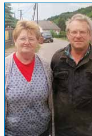
Gol sem brsno ... stran 8