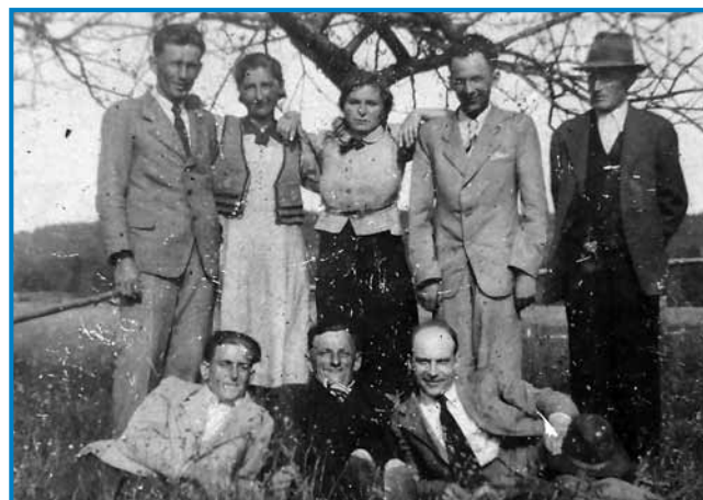
Indasvejta, gda so se lidgé dali slikati, so se oblekli v svoje najlepše gvante

»Zato so redli tjejpje, aj majo za spomin, zavolo toga, gda so se doladjemali, vsigdar so se v