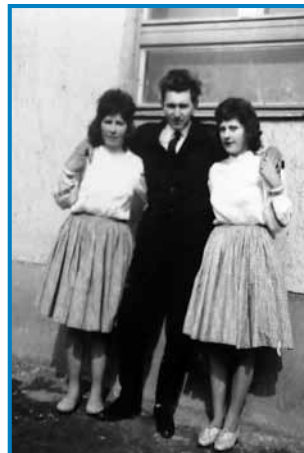
Kejpa iz mladi lejt

»Tau je cejlak do šestdeseti lejt tak šlau, zato ka prvin so bili taše razglednice (képeslap),