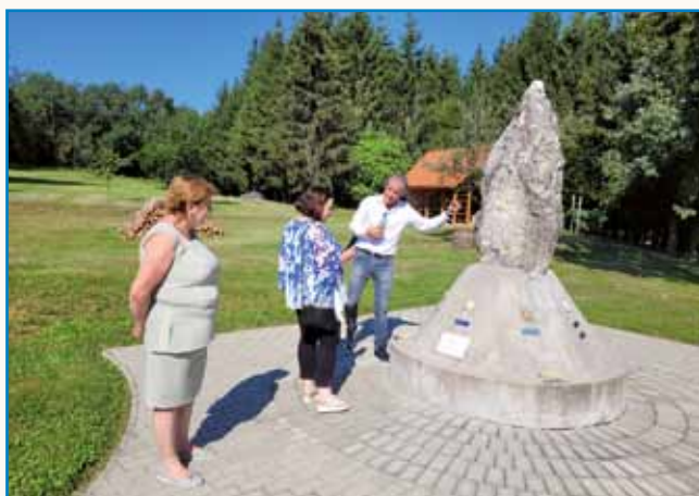
Slovenska skupnost v Porabju je morda res majhna, ampak dejavna stran 45