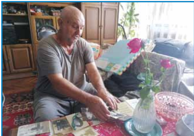
Joži Dončec dosta stari kejpov majo

pa leta 1926 sta domau prišle. Oča, on se je leta 1911 v Meriki v Brooksvilli naraudo.«