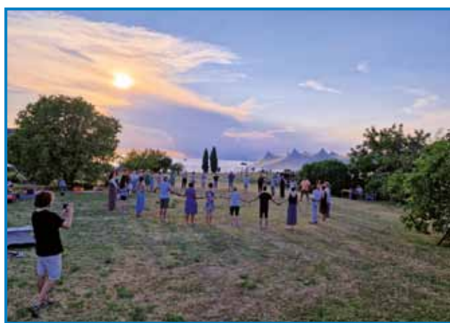
Pridi, zapleši z menoj

Ob takšni zgodovinski izkušnji izolskega mesta po nekem srečnem naključju pride do prepletanja med naravo in umetnostjo, ki samodejno vpliva na naše estetske potrebe in ob