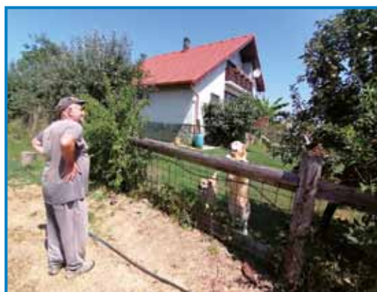
Joži ma trno rad svoj »ranč«