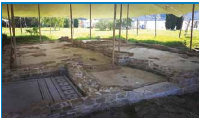
Ostanek rimske vile

Po čem je Izola tako specifično, obalno mesto? Nedvomno po svoji daljnosežni zgodovini, ki ji je pri tem še posebej