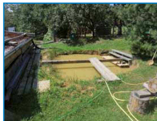
Mlaka pri rami

»Nej samo oča, mataré družina je tü vanej bejla, edna v Bethlehemu, drüga pa v Brooksvilli. Obadvej družine sta pred prvov svetovnov bojnov odišle