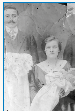
Nej gvant, grünt stran 8