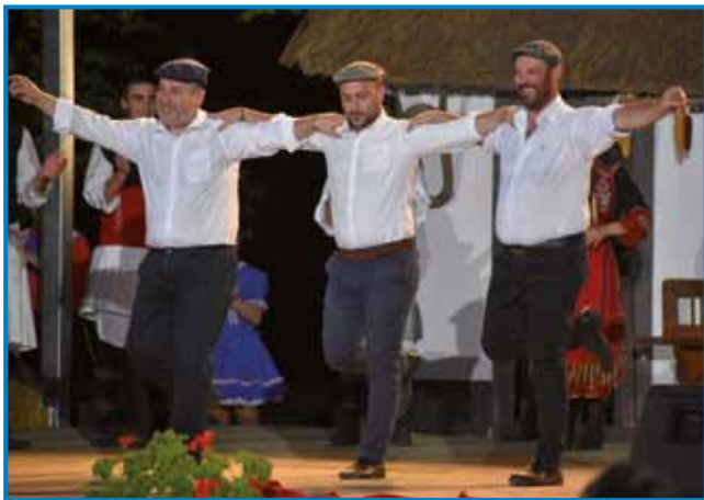
Na večeri tihinskih folklornih skupin so Grki zaplesali tudi njihov erični ples sirtaki

Čiglij je tak plesalcom kak tudi obiskovalcom zavolo vročine