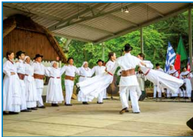
Na glavnom tali svetka slovenske folklore je zaplesalo osem folklornih skupin