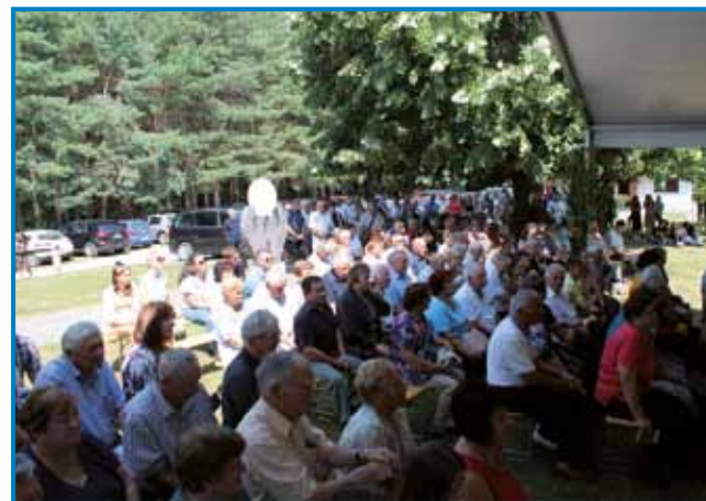
Zbrani vörnicke ob praznovanji 500-letnice