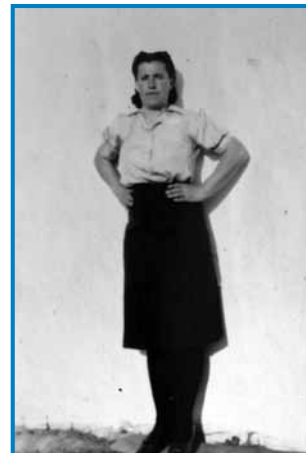
Materna družina je tö iz Merke (Bethlehem) prišla domau

- Maš edno lejpo mesto vöna-pravleno na srejdi ogradca, na srejdi brga, gde kaulak-