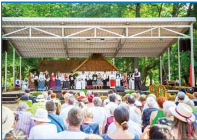
V Böltincaj majo nauvi oder, steri ma tudi strejo

fejst teko švic s čela, vseeno je na festivali vse do konca bilau veselo. Po svečani povorki nastopajočih je biu v nedelo zadevčarka na redi glavni tau svetka slovenske folklore. Paul leg domanjih plesalcev (KUD