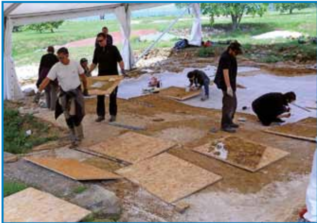
Arheologi pri delu

Skorajda ne dvomim, da bo marsikoga v tem poletju iz Porabja vzel v svoj objem primorski svet oziroma slovenska obala. Tako kot sleherna pokrajina v naši deželi ima tudi življenje ob našem morju veliko zabavnih in znamenitih točk, ki si jih je vredno ogledati.