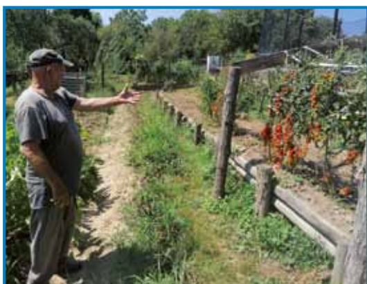
Paradajsi visijo pa zrejljo kak grauzdje

»Vsikši keden se pelam, če se srečam s kakšnimi spoznanci, te malo parklajamo, povejmo