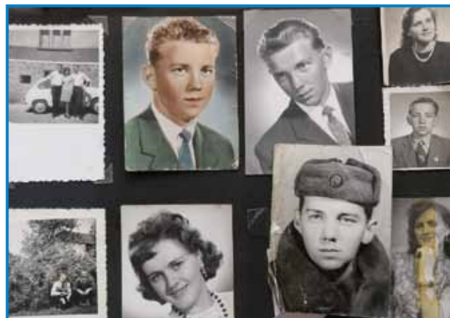
Ani pa mauž Karči v mladi lejtaj

- Če gledamo te tjejpe, stera lejta so bila tista, stera so najbola baukša pa vesela bila?