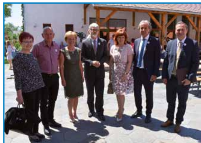
Na Porabskem dnevu na Verici-Ritkarovcih

- Katera so tista področja, na katerih je sodelovanje med