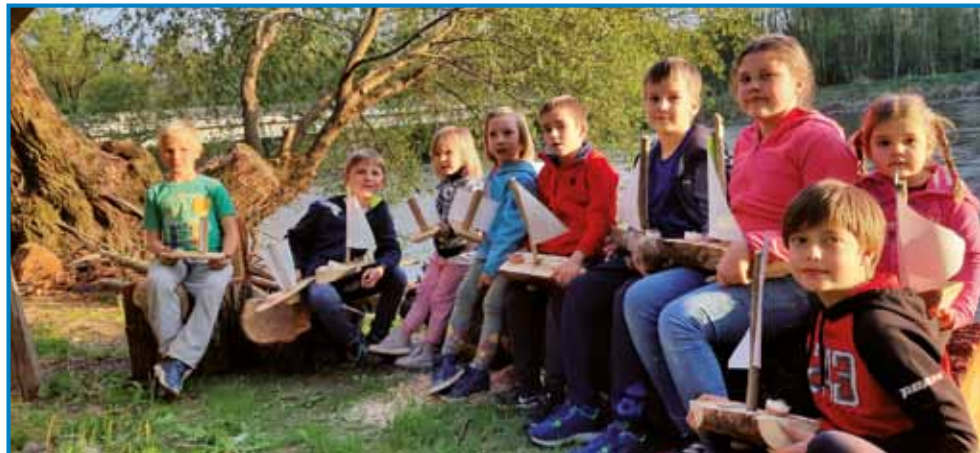
Najmlajša generacija »čolnarjev« z lesenimi ladjicami

jev Pomurja. V zadnjih dveh letih je bilo zaradi pandemije čolnarjenja po Muri manj,