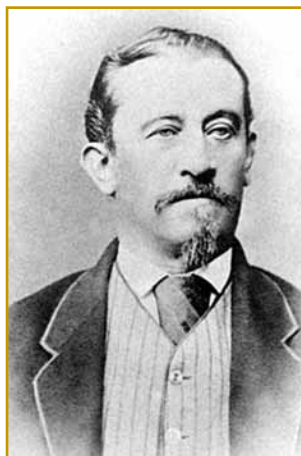
Josip Stritar 1836-1923

začnili. Za center te krajine Velke Lašče valajo, eni malo ovak pravijo, depa o tom malo sledi kaj več vöovadimo. Velke Lašče so nej ves pa varaš tö nej. Nin zmejs je leko dene mo. Po slovenski se takšnomi kraji trg pravi. Oprvin dokumneti o vejsi Sele, tau je prvo poznano menje, nam leta 1145 pripovejdajo. Kak zvekšoga po cejlj krajini so Velke Lašče Törki tö večkrat gorvužgali. Kuman po tejm leko od trga s tejm imenom tadale pripovejdamo. Pravi jo, ka na mestaj, na steraj se telko lagvoga zgodi, pomalek začne vse dobro vörasti. Leko ka ranč zatoga volo so kaulak Lašč se tej velki štirge najšli. Ja, v Velki Laščaj se eden od nji nej naraudo, vse se je kaulak nji zgodilo. Depa kak eden mali center aj bi une Slovenske Atene bile. Po redej demo. Primož Trubar se je v Raščici pri Velki Laščaj naraudo. Fran Levstik v Retjaj pri Velki La-