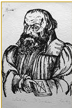
Primož Trubar 1508-1586

Primož Trubar, Jurij Dalmatin, Fran Levstik pa Josip Stritar so možakarge, zavolo steri so lidge krajino tak zvati