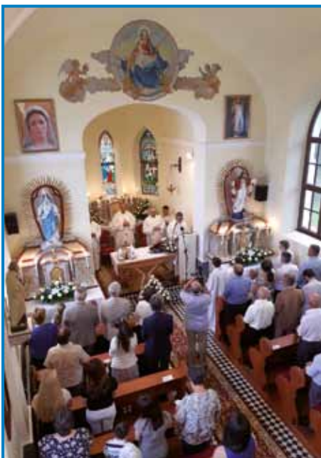
Sakalovska kapela, ki je bila zgrajena pred 100. leti, je bila od zunaj in znotraj obnovljena

blaženem stanju in s tem o srečanju dveh otrok, svetega Janeza Krstnika ter našega zveličarja, Jezusa. Cerkev je prostor, ki služi trem srečanjem: sreča-