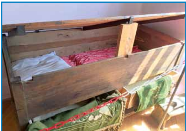
V muzeji v Staroj Gori majo eden »sto«, v šterom so spali tŭ – starejši vrka, mlajši pa v spaudnji mali kištaj

Po kratkom pelanji smo prišli v malo prlečko vesnico Stara Gora , gde pauleg glavne pošti-