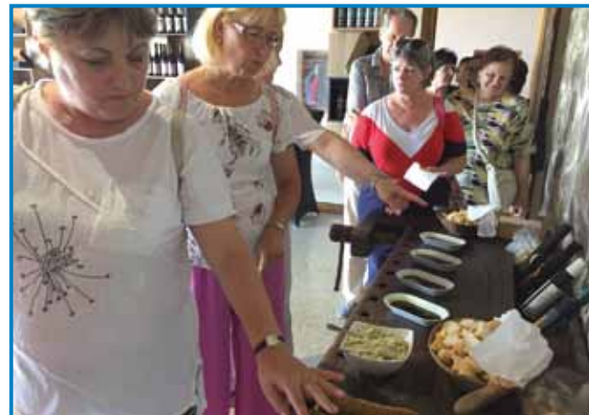
Ladno pa toplo stiskavani oli mata ovaško farbo – če štoj pride v Oljarno Kocbek, leko vsikšoga kaušta

V zidini nekdešnje šaule so domanji napravili eden mali etnografski muzej , v šterom nutpo-