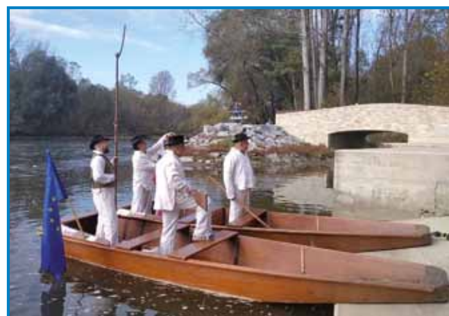
Člani društva z lesenima murskima čolnoma, kakršne so imeli čolnarji nekoč

rejših murskih čolnarjev, ki se udeležujejo promocijskih spustov z lesenimi murskimi čolni,« še pojasni predsednik. V društvu imajo