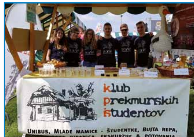
KPS, steri ma 300 članov, organizera dosta aktivnosti

steri je Jakobovo pout preodo v enom slabom meseci. »Čiglij je bilo vrauč, te tau ne mouti preveč. V glavej maš vsakodnevni cilj, oditi in oditi. Nejsam meu nekših vekših problemov, stero bi rešavo s tau hojo. Bole sam pa kak v kakšom vekšom kraji, gē si samo številka,« je zanimiva misel sogovornika, steri je po zgotovljeni drugi soboški osnovni šauli in Srednji zdravstveni šoli Rakičan odišo na študij v Ljubljano: »Študerati sam začno zdravstveno nego. V cajti študija sam ugotovo, ka me delo v javnom sektori omejuje, vej pa sam nej mogo izkoristiti vsej svojih idej in potencialov. Zatau sam se zdaj odlaučo, ka se vpišem na magistrski študij, in sicer na program psiho-socialnoga svetovanja, vzporedno pa mo študero ške psihoterapijo. Tak brodim, ka mo v toj stroki najbolje leko pomago sočloveki.«