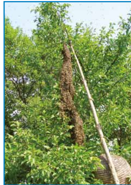
Stara matica se je meknila, je prejkpistéjla svoj daum, panj za nauvo mlado matico

vöro kaulak 30-40 kilomejtrov se nesejo (letijo). Delavci malo časa živejo, samo kaulak šest tjednauv. Tak pravijo, ena fčela v svojom življenji, če eno malo žlico meda prinesé