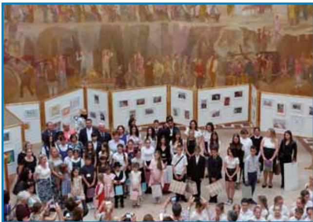
Stvaritve in ustvarjalci na razstavi

fotografije za malčke, osnovnošolce in dijake, pripadnike raznih narodnosti, ki obiskujejo različne oblike narodnostnega pouka.