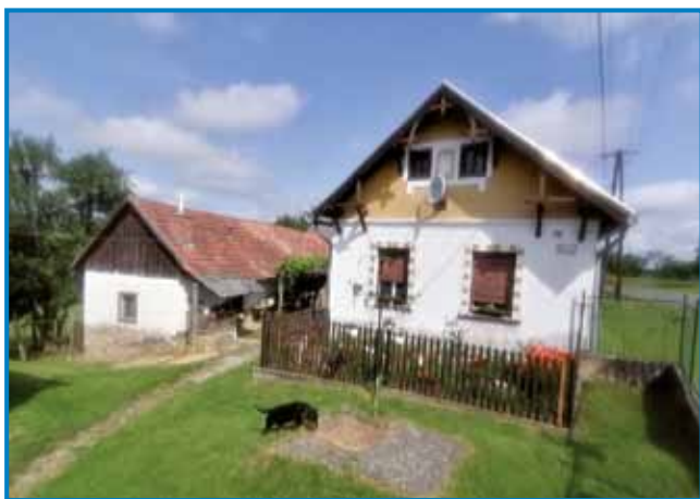
Lejpi mali ram na Verici-Ritkarovcih, gde živita oča pa sin

»Töj na Verici smo Bejbrstji, pogledni nauvo hišno številko, tam tü tau piše. Doma v Števanovci, kama sem valaun, tam so nas pa tak zvali, ka Fiškališ.«