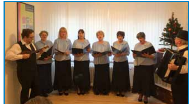
Nagrajenec pri ljudskih pevcih Sombotelske spominčice sodeluje kot tamburaš in pevec - glavni cilj skupine je ohranjanje pesemskega izročila Slovencev na Madžarskem

diplome, in sicer iz slovenskega jezika, zgodovine in tudi računalništva: »Še preden sem napisal svojo zadnjo diplomsko nalogo, me je takratna odgovorna urednica Slovenskih utrinkov vprašala, če bi sodeloval pri pripravi teh oddaj. Najprej sem se samo nasmehnil, potem pa mi je oče rekel, naj premislim, morda pa je to služba, ki bo primerna zame. In zdaj sem že desetletje in pol na televiziji. Novinarstvo mi je zelo všeč, ker je to razgiban poklic. Ogromno smo potovali tako v matični domovini kakor tudi na Madžarskem in spoznal sem veli-