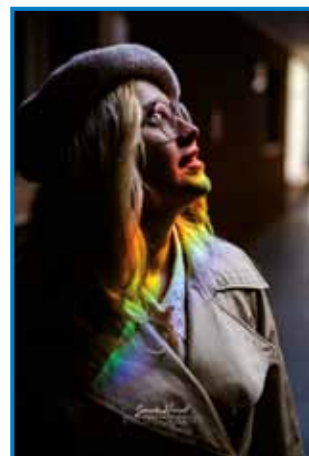
Ške eden od Sandijovih kejpov romskih žensk

najbole opisov v svoji prvi knjigi, po tistom pa je znau, ka ške vsevküper napisati štiri knjige o svojom žitki. In tak je leta 2019 vöprišla knjiga Preprosto enostavno: hvaležen, pred dvema letoma pa ške Preprosto enostavno: čütim: »Leko povem, ka so bile te knjige po eni strani terapija, po drügi strani sam ges raso z njimi. Gda si zbrodim na prvo knjigo, te mi po glavej dě, kelko vsega sam od tistoga cajta že doživo. Nej pa mi je žau, ka sam svoje pripovesti delil z lidmi, aj se o Romaj neka