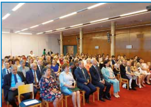
Gostje, učenci, učitelji in starši na priveditvi