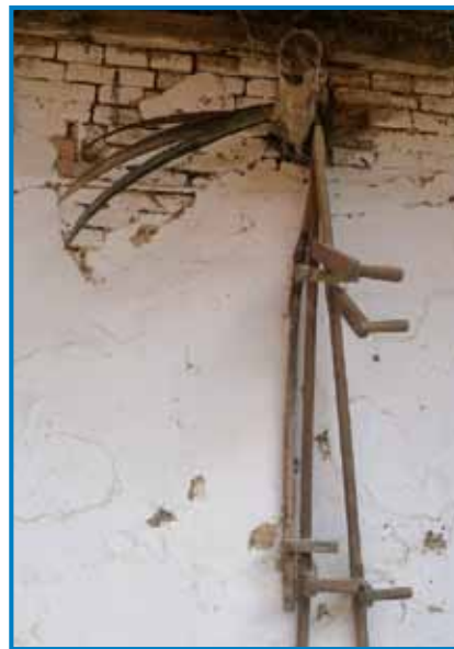
Gda so Lajoš v kosavnoj fabriki delali, so se poskrbeli, ka je pri iži vsigdar zavole kos bilau

več nej, te tö samo zato, aj nede tak prazno dvorišče, aj me zazranka zbidi. Depa