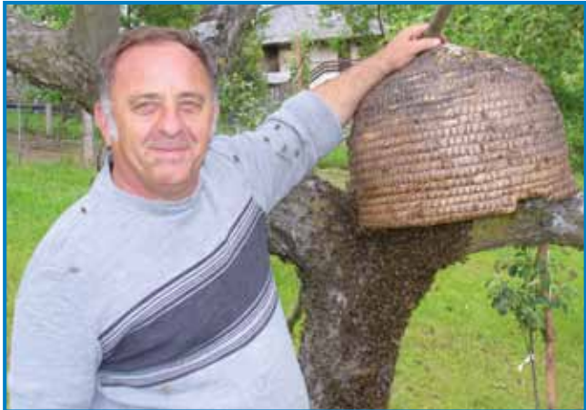
Tak batrivno pa s tašnjim veseldjom samo tisti čebelar leko nazaj zbabiva z medeno košontov svoj veltji roj, steri s srca rad dela s fčelami

20. majuš je že štrto leto den fčel na svejti, za steroga je idejo dala Slovenija, tau pa zatok, ka se pri nijj spravljajo najbola s fčelami, s čebelarstvom. S tejm tau želijo dosegniti, aj lüstvo dosta bola za resnico vzeme, dosta bola pazi na fčele, aj se na veliko vej, kak so potrebne za člo-