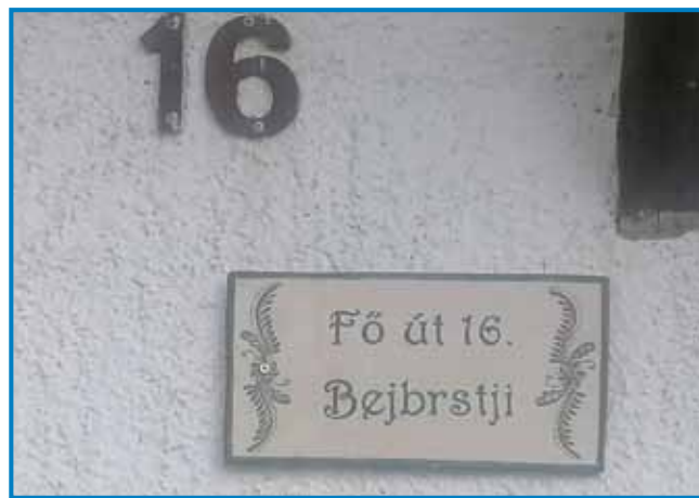
Tabla z hišno numero pa domanjim slovenskim ménjom

»Že samo dve kokauši pa enga kokauta mam, nika