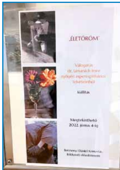
Tokratna razstava nosi naslov »Veselje do življenja« - prinaša izbor iz pokrajinskih, socialnih in tihožitnih posnetkov župnika

ki so se v tem času pripravljali v Prekmurju,« je zaključil gost iz Murske Sobotice.