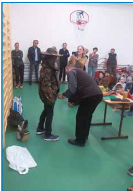
Letos v okviru medenoga zajtrika na števanovskoj šauli so mlajši nej samo dostavse čüli pa vidli od fčel, litji sami tü aktivno sodelovali

»Že kaulak februara začne cvesti lejšnjak, te se že vönesejo na cvetlični pra, ga nota prinesejo, nika meda že tü djeste. Mati (matica) te že dola dejva dijaca. Potistim začnejo cvesti divdje črešnje, sploj dosta pa dober med dájó. Fčele vseveč delajo, mati vse-