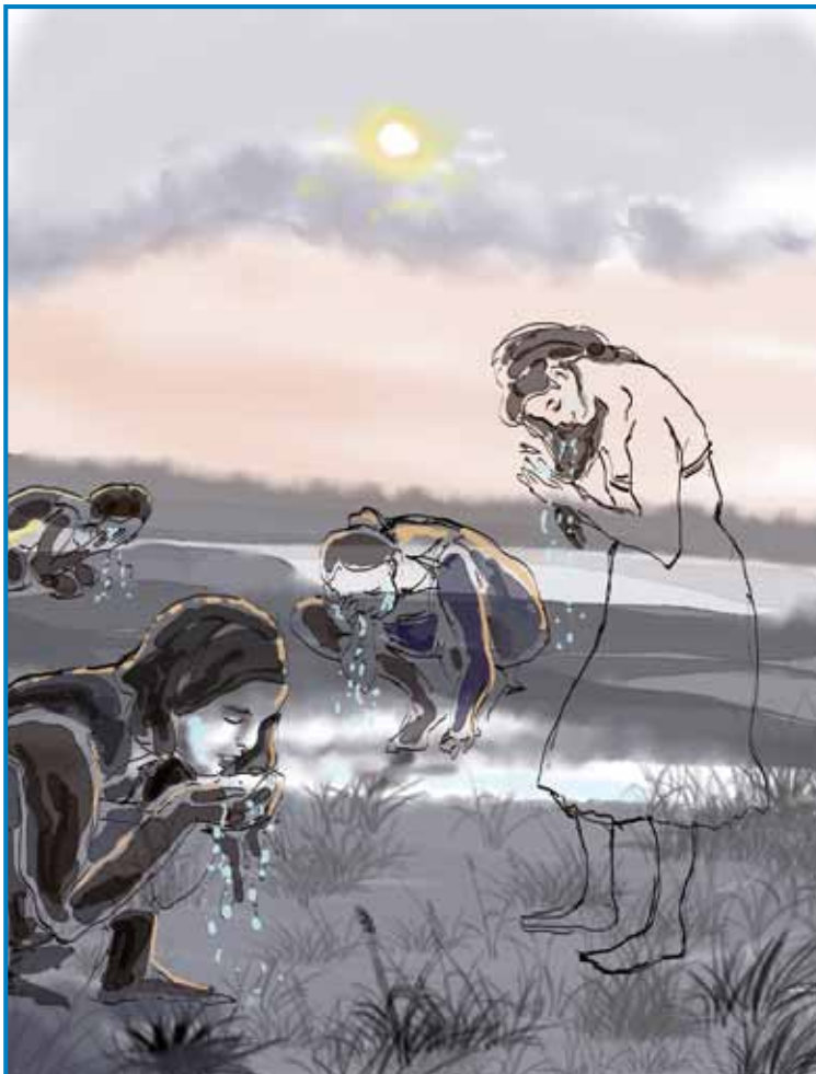
Vseposedik na Slovenskom so dekle vörvale, ka jim mujvanje z rosov na risauski zranek dá lejpi obraz in kaužo - na Koroškom pa so brodile, ka je oči tö nedo bolele

njegvoj kravi pa so v šinjek obesili venec s kopriv in eden leseni zvonec, v šterom je visala edna žaba. Na Štajerskom so mogli pastérge na risausko nedelo maro na pašnjek prignati že pred zordjov. Najprvi je grato »krau Gonjaš«, kak krono je daubo farbasti venec s cvejto, v rokau pa pisano palco. Najslejdnji je grato »Lükec«, vej je pa daubo krono z vonječi rauž in lüka.