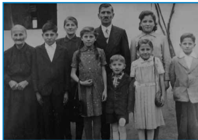
Njina družina v Sakalavci je vólka bila. Bilau nji je osem mlajšov. Na kejpi stara baba, mati (Lina tetica) oče (Cica bači) pa šest mlajšov

»V kosavnoj fabriki, dja pa v židanoj fabriki dočas, ka so me nej taposlali. Potejm sem v več mejstaj delala, največ v Meriki.«