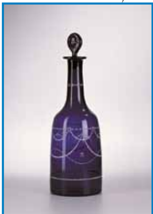
Steklenica z zamaškom, stekl. Josipdol

Razstava v Pokrajinskem muzeju Maribor prikazuje drobce neprecenljivega bogastva, ki je sredi pohorskih gozdov živelo svojo dvestoletno zgodbo. S človeško sapo