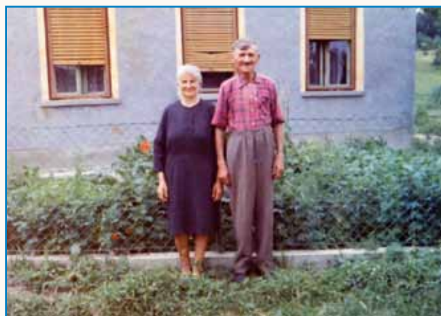
Žir, krij pa mesau je zaprejo bilau stran 8