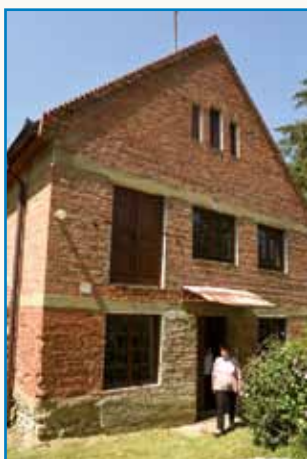
»Ka se leko napravi, ...« stran 45