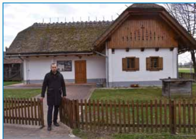
»Morem povedati, ka si v naši vesnici vsi pomagamo« stran 6