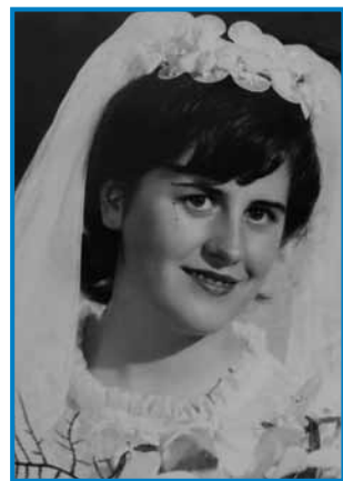
Erži kak sneja

»Dja sem sedma bila, od mene je samo eden pojep