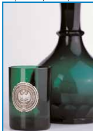
Kozarec in karafa, Stekl. grofa Zabea

stavljeni izdelki pohorskih steklarjev iz bogate muzejske zbirke pa bodo na ogled vse do 14. maja, v pritličju grajske bastije.