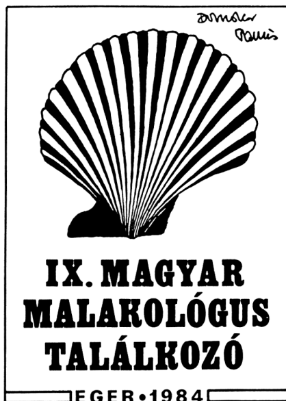
2. Front cover of programme fascicule of IXth HMM

The programme booklets – supporting the organization of the meetings – proved to be very useful. These booklets were generally edited according to the following aspects: programme; informations relating to the traffic and accommodation as well as to the excursion for collection; list of the participants indicating also their addresses. On many meetings the participants received also memorial certificate, occasionally memorial articles – showing the place of the meeting and being decorated with the logo of the place.