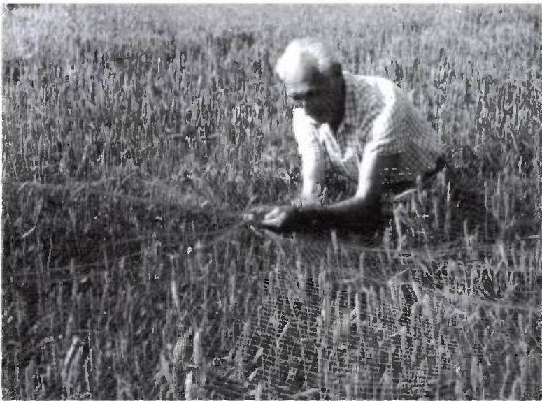
3. kép. „Megvan!”

a tyúk válaszából pedig a következőt: -„Vártalak, vártalak, vártalak.” 10