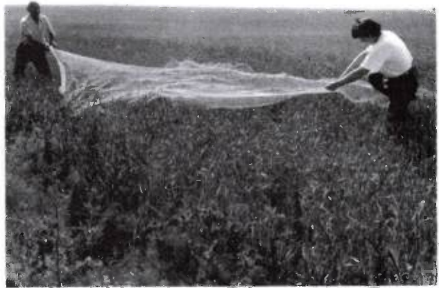
2. kép. A háló leterítése

Egykor a füves, erdős sztyepp lakója volt, ám a későbbiekben a kultúrsztyeppéken találjuk. Gabonatermő rónáink madara, hasznos, mert gyomot, bogarat irt. Jellemző rá, hogy igen szereti a gabona- és pillangóskultúrákat, a borsót, de a gypet és a gazosokat sem veti