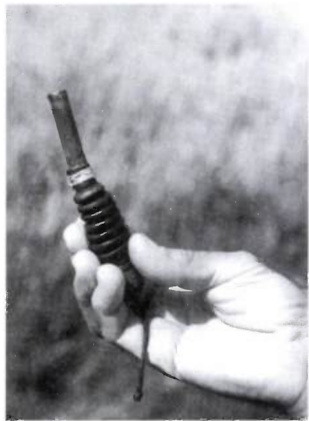
1. kép. Csalisíp, hívó

Bél Mátyás szerint a magyarok mindenkinél jobban értettek a madarak fogásához. Részletelesen leírja azokat a hálókat amelyeket használtak, és azt is leírja, ahogyan használták. Az egyszerű madarászhalóról a következőket írja: „Hosszúkás háló ez, kifeszített állapotban hozza a hátoldalon kiágazásképpen kúpszerű kitüremlés csatlakozik...A madarászhaló (németül Steckgarren) fiókokkal, mintegy zsákocskákkal van ellátva. Reggel is, napközben is ott állítják fel, ahol gondolják, hogy meg szoktak ülni a madarak: foglyok, nyírfajdok, vagy fűrjek. Mihelyt észreveszi a madarász, hogy ott csipegetnek, ezzel körülkeríti a kettejük közti helyet, majd síppal utánozza a nőstény hangját. Ennek hallatára az óvatlan madarak előretörnek... belebonyolódnak a zsákocskába.” 5