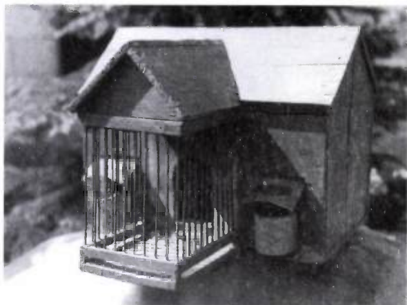
6. kép. Kalitka

jön ki pitypalattyolni. Nem szereti a nyitott kalitkát, a sötétet, a csendes zugot kedveli. Úgy kell elkészíteni, hogy az alja kihúzható legyen, amibe homokot kell tenni. Hátul is kell egy kis ajtó. A kalitka tetejét minden esetben ki kell bélelni, mert a fűrj ideges természettől, állandóan ugrál a lábával rúgva egyet és így a fejét beleveri a kalitka tetejébe. Az előteret is célszerű kibélelni. Amikor megfogjuk, nagyon kell vigyázni arra, hogy a lába az ujjunk között legyen, mert én is jártam már úgy, hogy a lába ugyan a tenyeremben volt, de nem fogtam szorosán és amikor egy nagyot rúgott, kirepült a kezemből.