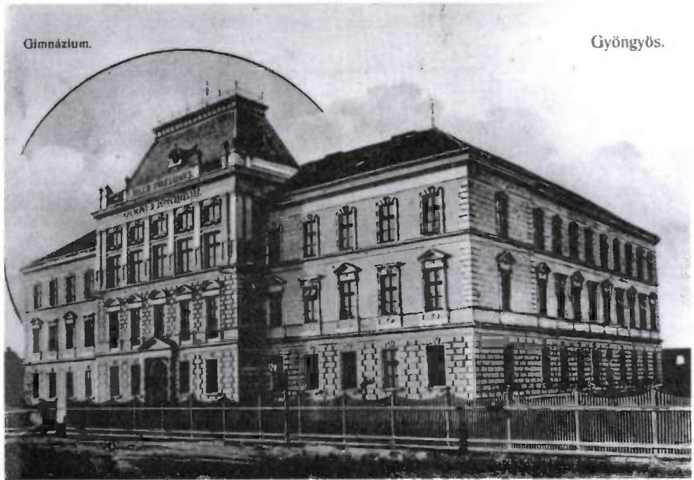
1. kép. A gimnázium 1899-ben

A zsidók számának alakulását kedvezőtlenül befolyásolta a rossz születési és halálozási statisztikájuk. Nem segítette a nyugodt életüket a politikai élet jobbra tolódása. 1920-ban a városi közgyűlés például javaslatot tett a numerus clausus bevezetésére a középiskolákban is. 1944 májusában megtiltották a zsidó diákoknak az iskolai jelvények és egyenruhák viselését. Viszont a gimnázium tanárai bátor magatartásról téve tanúságot kihozták zsidó diákjaikat érettségizni 1944-ben. 13