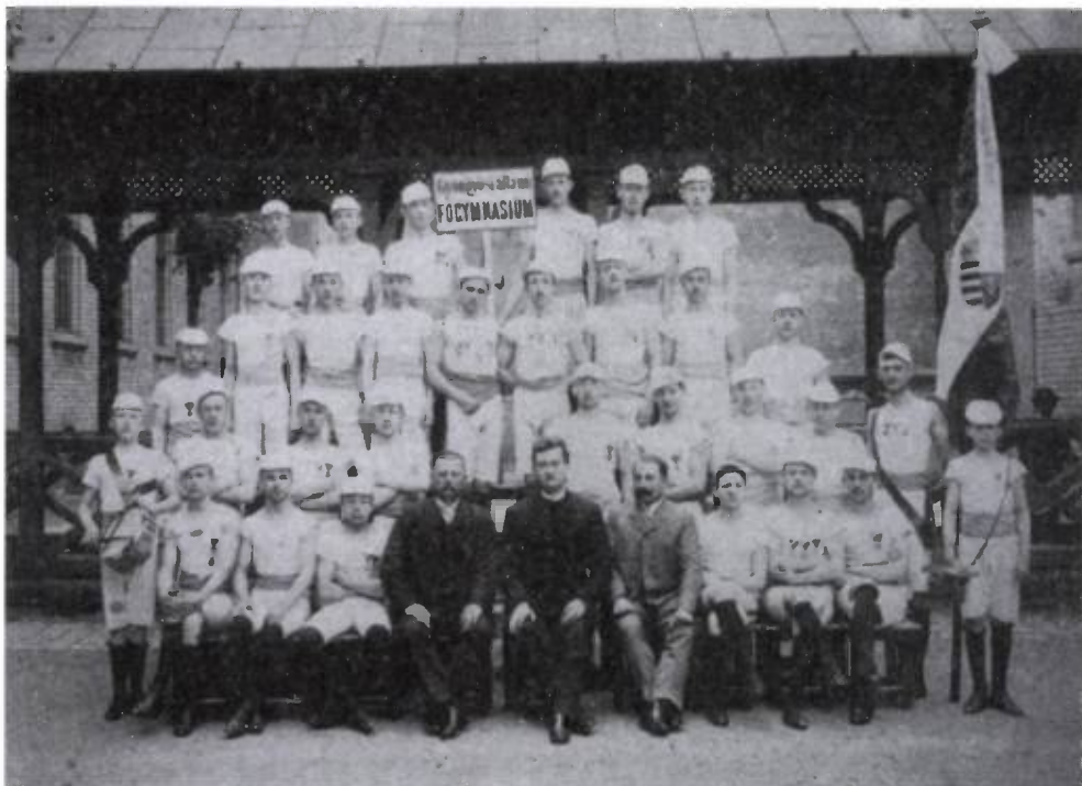
3. kép. A gimnázium tornacsapata

ezzel biztosítva a lehetőséget ennek nyelvnek a még alaposabb elsajátítására, ezzel éltek is a diákok, mindig sikerült több csoportot szervezni. Hasonlóan alakult a gyorsírás sorsa is, rendkívüli tantárgy volt, majd 1932-től kötelező lett, de Gyöngyösön lehetett továbbra is rendkívüli tantárgyként is tanulni.