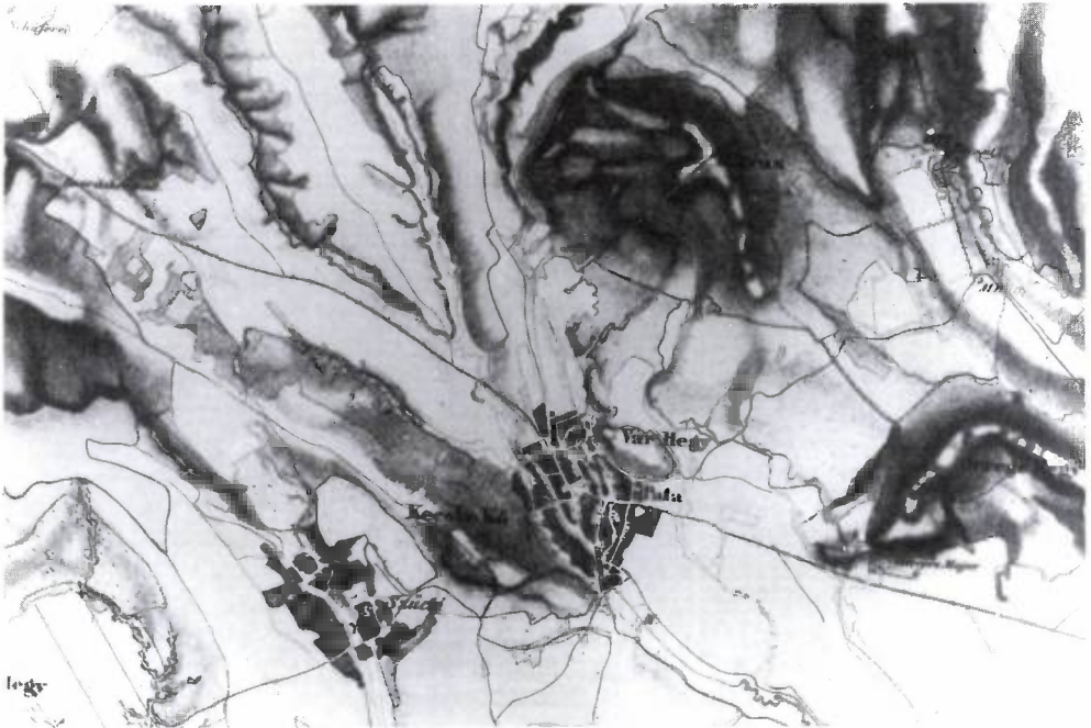
7. kép. A második katonai felvétel részlete (1853)

1848 februárjában készítették az utolsó feudális összeírást, „Czéh János bíróságában”, rovásadó-kivetés céljából. 101 Ekkor a teljes adóalapot összeírták, hisz minden 480 forint jövedelem után egy rovást tettek. A családfőket tekintve 45 jobbágyot, 136 zsellért és 16 lakót találtak, s hozzájuk 16 éven felüli családtagként 5 testvér, 207 fiú és 31 leány tartozott. A településen élő szolgák száma 19, a szolgálóké 2 fő volt. 946 épület találtatott, szántóföld 1442 hold, kaszáló 513, kapás szőlő 1282. A közösen használt legelő összes kiterjedését 1485 holdnak írták, amelyen 245 ökör, 116 tehén, 25 tinó és 15 borjú legelt 114 ló és a két csikó mellett. Viszonylag magas volt a juhállomány 891 állattal, viszont meglepően kevés sertést tartottak, 76-ot.