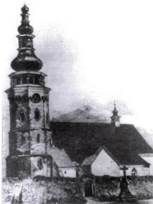
4. kép. XVIII. századi rajz a templomról

ván a terhek enyhítésére írt beadványok, kérelmek, könyörgések száma is. Valószínűleg ezzel függ össze, hogy ismereteim szerint ekkor alkották meg először Pata hivatalos pecsétjét. Az 1710-ből származó ezüst pecsétnyomó réten futó vadászkuttyát ábrázol, amely a szájában nyilat tart, felette kereszt. Körirata: "Patha városa peccith 1710". 62 Egyébként Pata városi jogállása is megerősített ezekben az években. Az 1715. évi összeírás szerint Heves és Külső-Szolnok vármegyében egy város (civitas) Eger, és hat mezőváros (oppidum) található: Pata, Gyöngyös, Pásztó, Hatvan, Szolnok és Túr, a 84 falu (possessio) mellett. 63