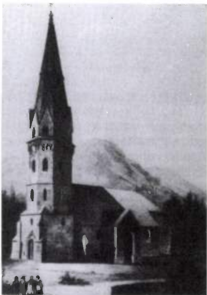
8. kép. A második katonai felvétel részlete (1853)

befejezetlen tagosítás végrehajtását is, s ezzel együtt a közbirtokossági aránykulcs megállapítását. A földesúr természetesen az úrbéri birtokokat a határ legtávolabbi részén, csupa árkos, gödrös, vízmosásos, majdnem hasznavehetetlen dűlőkben kívánta a parasztság részére kiadni. Egyébként ekkor az 1200 holdas patai közlegelőn idegen, bérelt marhákat és juhokat is legeltettek, fokozatosan kiszorítva onnét a helybeli gazdák állatait. 119 Végül is a földesurak és parasztok abban egyeztek meg, hogy a közlegelőről minden idegen jószág kitiltatik, de a felesre felfogadott állat továbbra is legeltethető, feltéve, hogy egész házhely nem tart többet 40 juhnál, 4 ökörnél, 2 lónál, stb. A bíróságnak ezután a következő jogállapotú földek kérdésében kellett döntenie: vitatott volt 401 kishold megváltandó maradványföld, továbbá a majorságtól bérelt ún. váltott (cenzuális) föld 650 kishold terjedelemben. Ezekért a parasztság korábban pénzbeli cenzuson kívül terménybeli tizedet adott, de a földesúr mindig fenntartotta a földekre vonatkozó szabad rendelkezési jogát, s ezúttal a majorsághoz való visszacsatolásukat kérte. Voltak végül az irtványföldek, a cigányok által közlegelőből tett foglalások. Ezek visszaadását is kérte a földesúr. 120