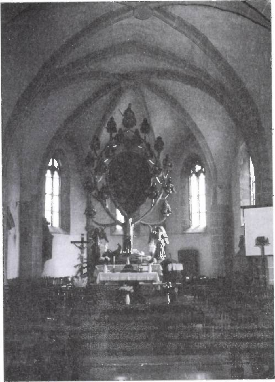
3. kép. Jessze-oltár a templomban