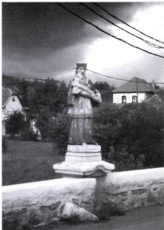
6. kép. Nepomuki Szt. János szobra a hídon

ban, hogy az urbáriumban rögzített szolgáltatásokat még nagyon sokáig a teljes telekszám után szedjék. Az „elkopott” öt és háromnegyed házhely utáni úrbéri föld kiadása a határbeli erőzóra hivatkozva sohasem történt meg, sőt ezeket a földeket véglegesen megsemmisítettnek mondták ki. 96