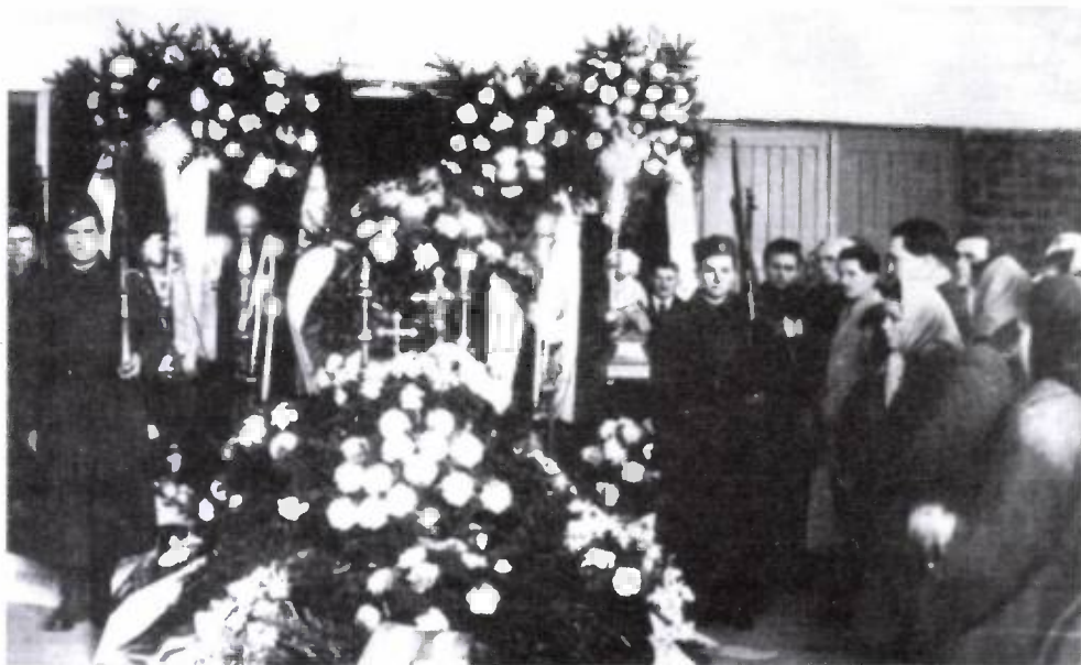
4. kép. Nemzetőr ravatala Gyöngyösön 1956-ban.

hogy elkerüljük Gyöngyöst, de még jóformán vissza sem értünk a Szurdokpartról, – a találkozó helyszínéről – amikor már megkezdődött a páncélosok átvonulása a városon. Mindenestre a nemzetőrség felállt és őrködött a város és környékének biztonságán.