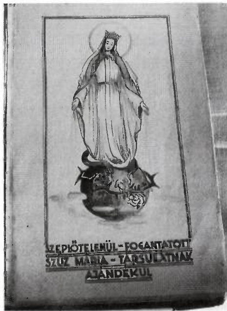
3. kép: a megörökítési jegyzőkönyv első lapja

minden valószínűség szerint már korábban is rendszeresen összejöttek a tagok, gyűléseket tartottak, vezetőséget választottak, megtartották a társulati miséket, ünnepeket, kivonultak a körmenetekre és tagdíjakat is szedtek. Erre utalnak a miséskönyvben megörökített társulati misék és a jegyzőkönyv bejegyzései is. Az 1909. dec. 19-es választmányi gyűlésen (az első, amiről a jegyzőkönyv beszámol) szó esik „elmaradt taksadíj és kamatokról”, az előző évi „eskümiséről” és „keresztkísértésről”, a társulat „kiadó pénzéről” is, amelyek mind az 1909 előtti társulati életre utalnak.