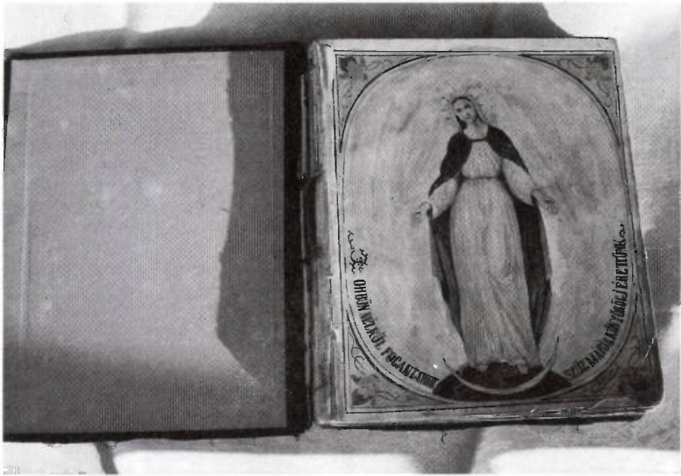
1. kép: az alapító és zárszámadáskönyv első oldala

alakult Gyöngyös város róm. kath. vallású híveinek körében isteni Megváltónk születésének tizenkilenc- és nemzetünk megtérésének kilencszázados emlékeztérére.”