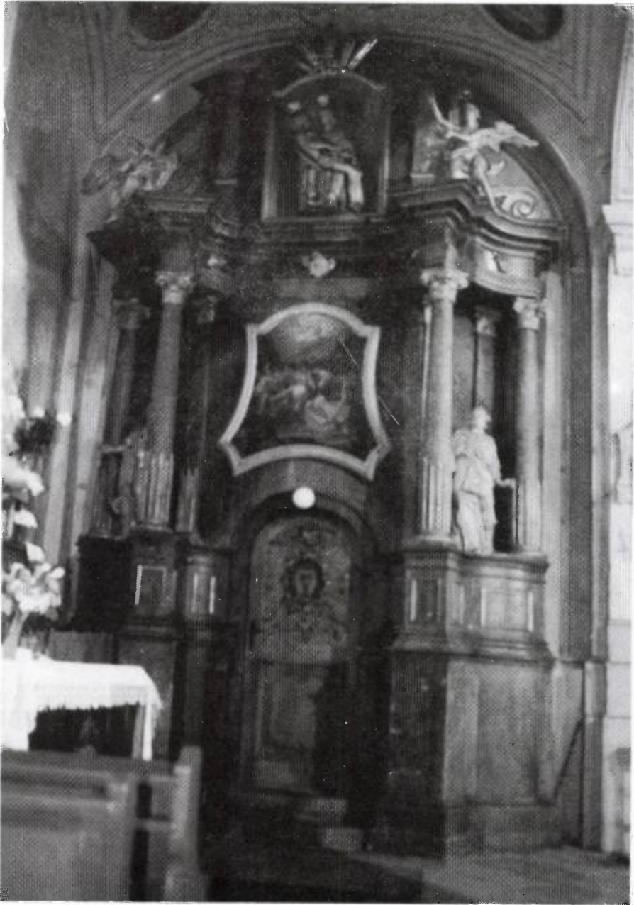
4. kép: a társulat oltárának régi helye, mellette balra a hatvanas évektől használt új oltár (Szent Bertalan templom)