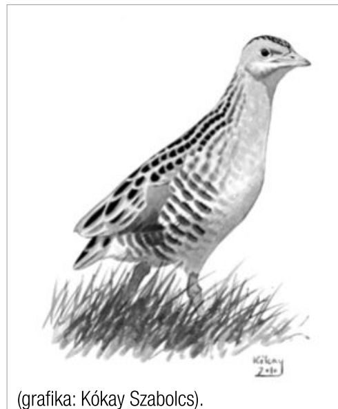
(grafika: Kókay Szabolcs).

Az év hátra lévő időszakában az MME szakmai stábjá kidolgozza azokat az ajánlásokat, amikkel a gazdálkodók segíthetik a fészkelőállomány védelmét, elkészíti a harist bemutató szóróanyagokat, illetve elkezd szervezni azt az országos rendezvénysorozatot, melynek keretében