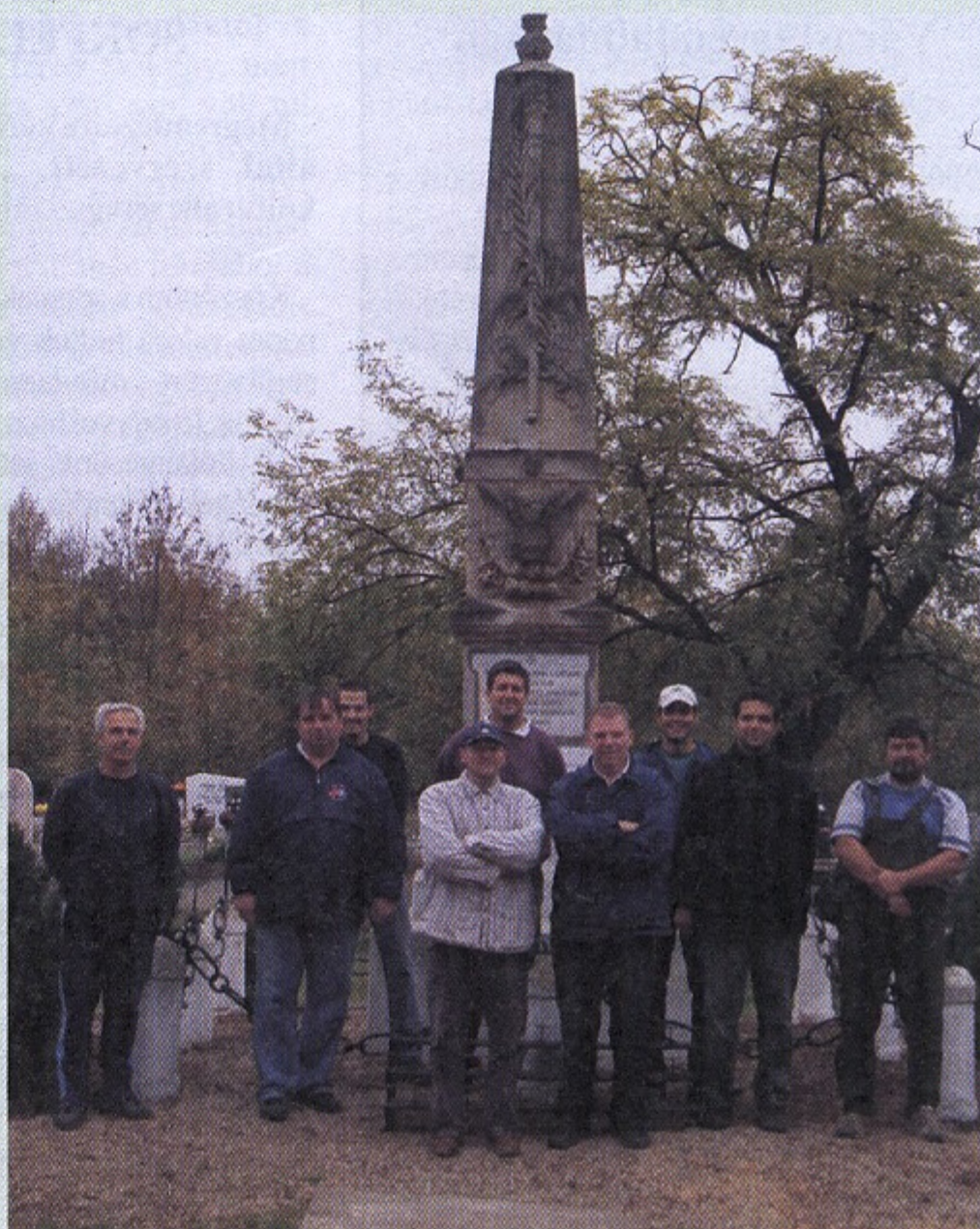
Mindenszentek előtt a városvédők megújították, rendbehozták a katolikus temetőben a Honvéd-síremlék környékét.