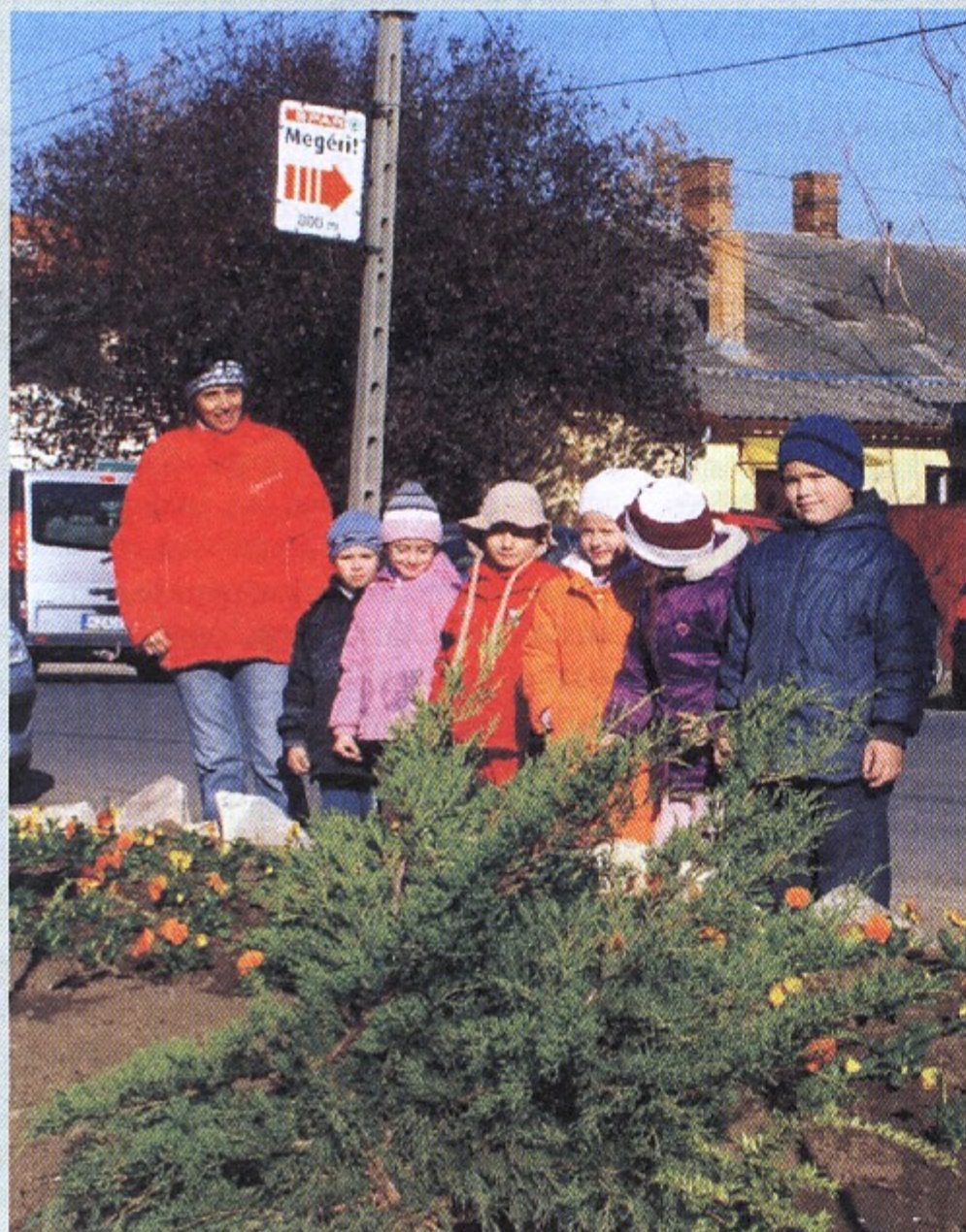
Az Almásy úti Óvoda elé a kivágott fák helyére virágoskertet telepített az önkormányzat.