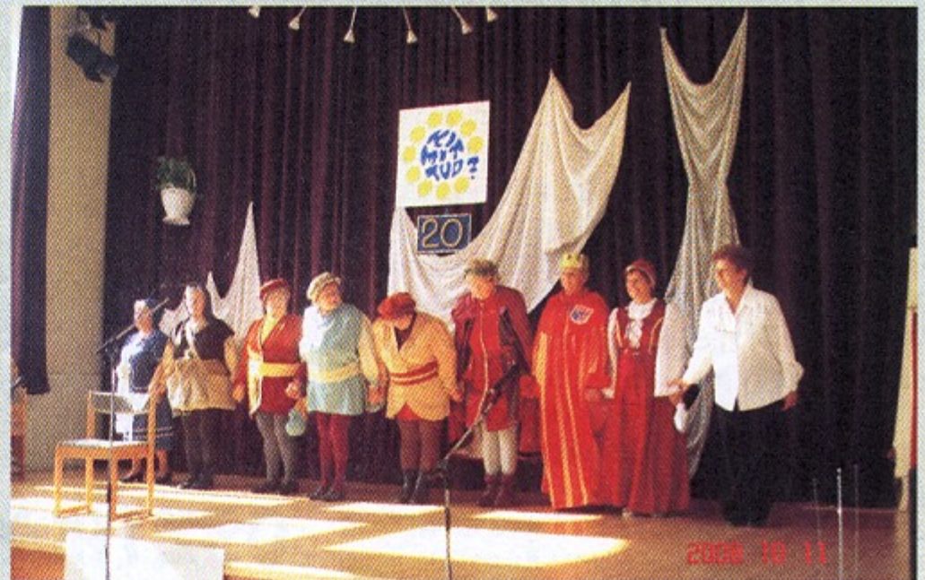
A megyei nyugdíjas Ki Mit Tud idén is nagy sikert aratott.