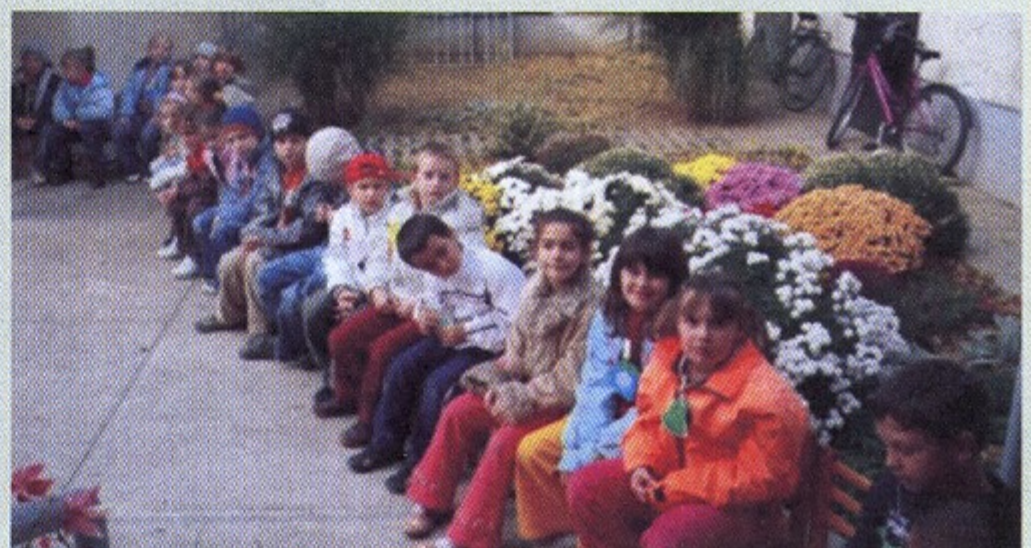
A Ipolyi téri iskola és óvoda szüreti mulatsága is jól sikerült.