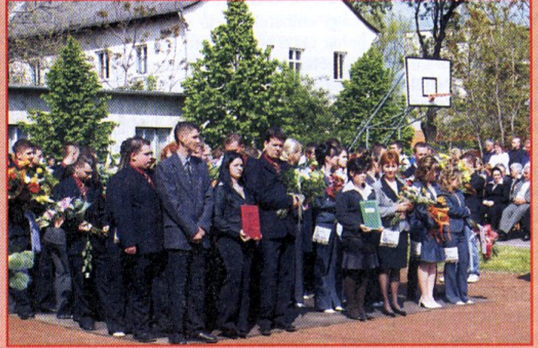
Ballagás volt a Székács Elemér Szakközépiskolában...