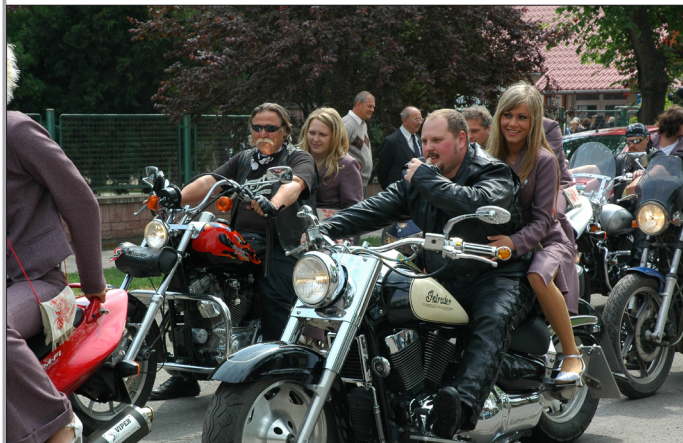
Nem mindennapi látványosság volt a Székács Elelmér Szakközépiskola végzőseinek motoros ballagása.