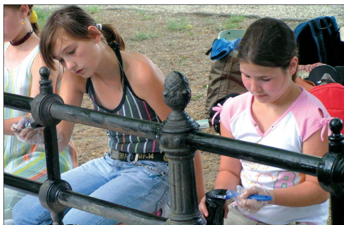
Nem is gondolták a Városvédő- és Szépítő Egyesület hon- és népismereti táborában résztvevő gyerekek, hogy mennyi érdekes és értékes látnivalója van városunknak. A lelkes csapat tagjai a három nap során többek között felkeresték a téglagyárat, feljutottak a református templom tornyába és lefestették a Hősök szobra díszkerítését.