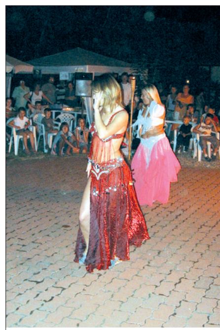
Szent Iván éjjelén varázslatos időutazásban lehetett része a helytörténeti gyűjteményt megtöltő közönségnek. A városi könyvtár és a helytörténeti gyűjtemény rendezvénye óriási sikert aratott. A számtalan látványosság közül a tűznyelőt, a tűzgrást és a hastáncosnők műsorát idézzük fel képeinkkel.