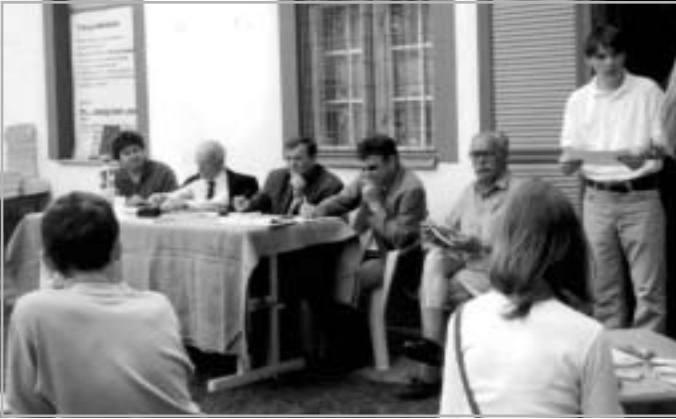
AZ ORSZÁGOS ÁLTALÁNOS ISKOLAI '56-OS EMLÉKVERSENY ZSÚRIJÉBEN

Nagy Imrét és négyszáz forradalmár társát, ezért menekült el kétszázezer magyar szülőföldjéről. Pongrátz Gergely már nem látta meg, nem érte meg itthon azt az áradó erőt, ami a forradalom bukása után még hónapokig működött és hatott, amit csak a legkegyetlenebb eljárásokkal, verésekkel, akasztásokkal, évekig tartó börtönnel, sor-tüzekkel, elbocsátásokkal, évtizedekig tartó féken tartással tudtak megtörni. Gergely már nem élte át a decemberig, majd tavaszig tartó újabb és újabb erődemonstrációkat a forradalmi nemzet részéről és a kegyetlen elnyomás újabb és újabb bilincsszorító akcióit.