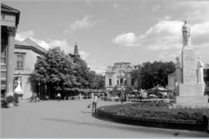
A TÖRTÉNELEMHAMISÍTÁS ÍZLÉSTELEN PÉLDÁJA: A FŐ TÉREN CSERNI JOVÁN „CÁR” SZOBRA

fonon elérni a Szabadkán maradt barátokat, akik megpróbáltak segíteni. Az egyik autó tehát visszaindult a városba, a többiek pedig átlépték a határt. Miközben az ismerős utakat róttuk, sms-ben jött a hír, hogy épp az évszázad Bajnokok Ligája döntőjét szalasztjuk el. Az autó is rakoncátlankodni kezdett, de végül visszaértünk Szabadkára. A határat-