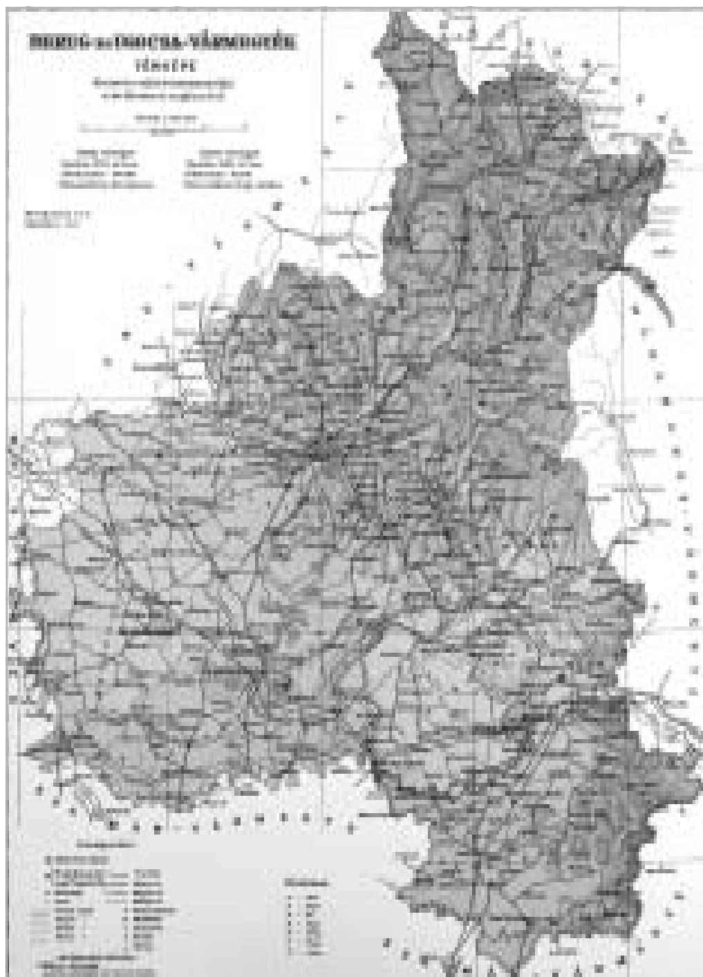
Bereg vármegye térképe