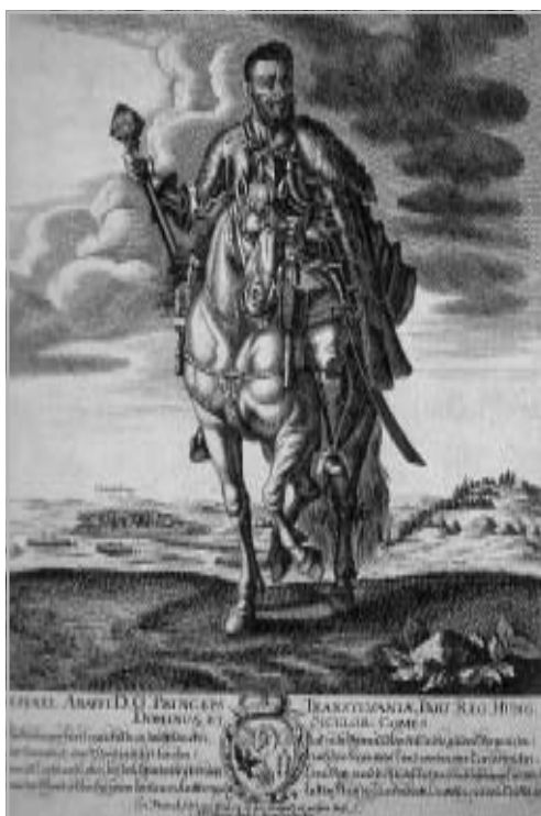
I. APAFI MIHÁLY ERDÉLYI FEJEDELEM (1661–1690)