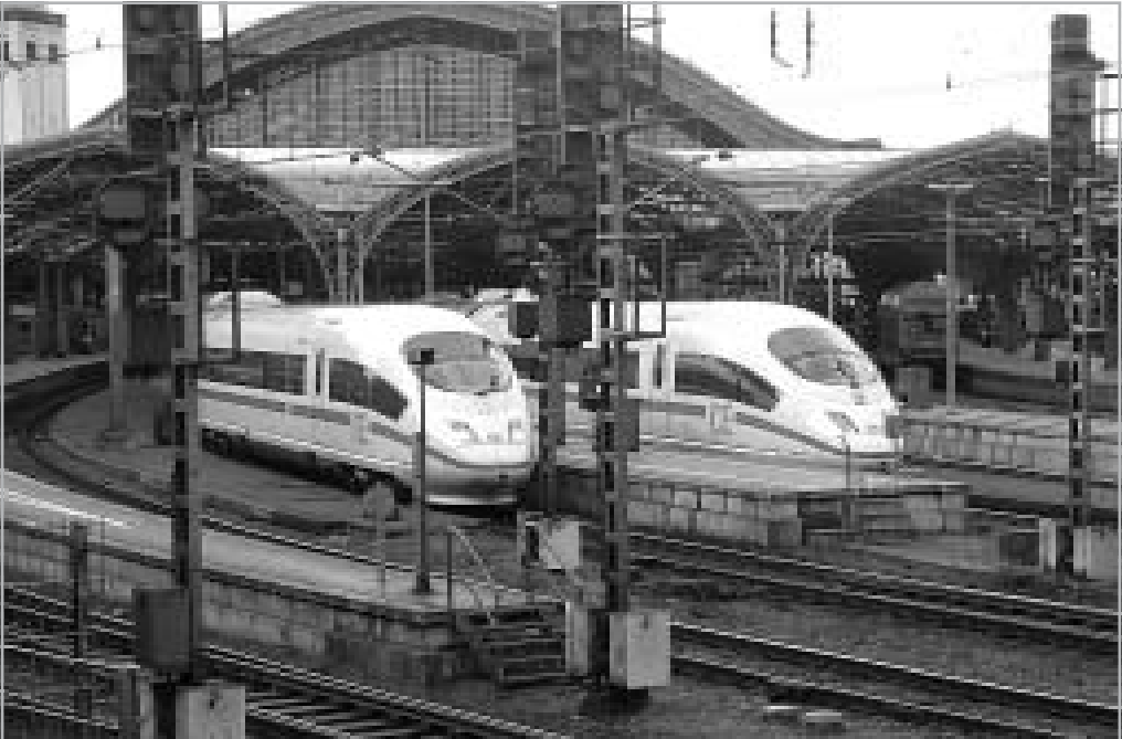
EGY INDULÁSRA KÉSZ ÉS EGY MOST ÉRKEZETT ICE 3 A KÖLNI FŐPÁLYAUDVARON. A CSARNOK MELLETT TALÁLHATÓ A VILÁGHÍRŰ DÓM 157 MÉTER MAGAS TORNYAIVAL