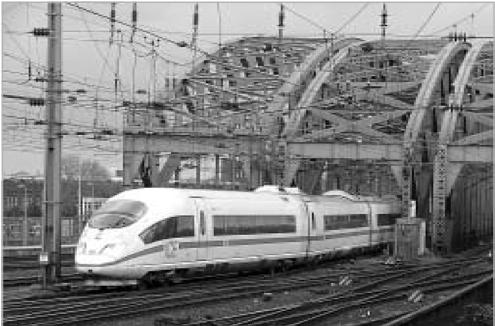
ICE 3 ÉRKEZIK A RAJNA HATVÁGÁNYÚ HÍDJAIN KÖLN FŐPÁLYAUDVARRA