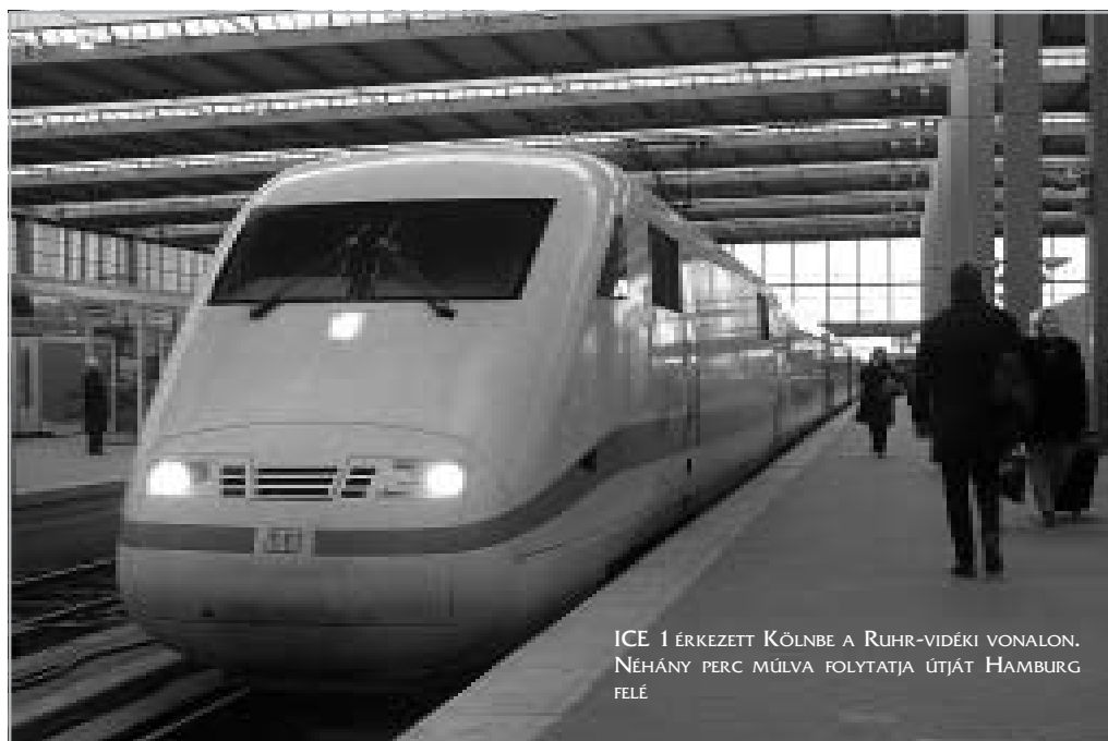
ICE 1 ÉRKEZETT KÖLNBE A RUHR-VIDÉKI VONALON. NÉHÁNY PERC MŰLVA FOLYTATJA ÚTJÁT HAMBURG FELÉ

Aztán 1998. június 3-án megtörtént az, amit minden német ember korábban elképzelhetetlennek tartott volna. A Münchenből Hamburgba közlekedő 884. sz. „Wilhelm Conrad Röntgen” nevű vonat – ICE 1 típusú szerelvény – négyszáz utassal a fedélzetén nem sokkal azelőtt, hogy Hamburgba érkezett volna, délelőtt 11 órakor 200 km-es sebességgel Eschede állomás bejárati váltóján kisiklott, és egy közúti felüljáró hídnak csapódott. A mozdony és az első két kocs kiételével a járművek egymásba torlódtak és összeroncsolódtak. 101 ember meghalt, 43-an súlyosan, 57-en könnyebben megsérültek. A mentésben 1100-an vettek részt. A hosszan tartó szakértői vizsgálat megállapította, hogy a balesetet az egyik kocs acélabroncsának elkopása és leszakadása idézte elő. A vonat hat kilométeres szakaszon magával hurcolta a leszakadt fémdarabot, ami az első eléje kerülő sínillesztésbe beleakadt, és a forgóvázat megemelve kisiklást okozott. Az újraegyesített ország leghíresebb technikai vívmányának katasztrófája nemzeti trau-