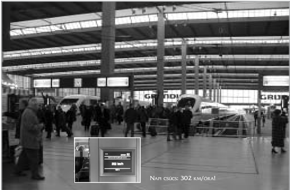
PONTOSSÁG, TISZTASÁG, KÉNYELEM

Az ICE-vonaton az utazás nem olcsó. Egyértelműen drágább, mint a személygépkocsival való közlekedés, és a fapados repülőgépek is lényegesen olcsóbbak. Az egyébként is borsos árú menetjegyen felül ICE-pótjegyet kell váltani, ami ülőhelybiztosítást nem foglal magában. Ha biztosan ülni akarunk, még helyjegyet is kell vennünk. Az interneten keresztül bármelyik vonatra bárhol lehet jegyet váltani. A fizikai vagy virtuális vásárlást követően a jegyigénylés ténye megérkezik a vonatvezető számítógépébe, aki szintén elektronikus módon jelzi