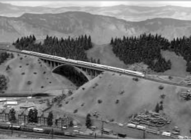
ICE 2 A NÜRNBERGI DB-MÚZEUM TEREPASZTALÁN

a helyfoglalást az ülőhely feletti kijelzőn. A szabadon maradt ülőhelyeket aztán bárki elfoglalhatja. Azt az érzést, amit az utazóközönség körében az ICE 3 okoz, amikor 300 km feletti pillanatnyi sebessége minden kocsibelső „műszerfalán” megjelenik, szavakkal aligha lehet kifejezni.