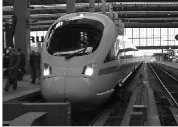
ICE T ÉRKEZÉSE KÖLNBE