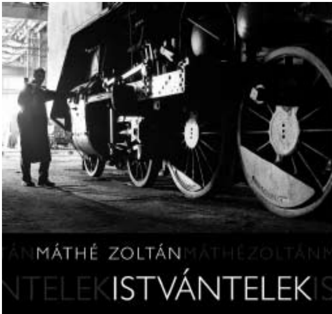
A FOTÓALBUM MAGYARORSZÁG ELSŐ ÉS UTOLSÓ GŐZMOZDONYJAVÍTÓ-MŰHELYÉNEK, AZ ISTVÁNTELKI JÁRMŰJAVÍTÓNAK A MINDENNAPIAIBA NYÚJT BEPILLANTÁST. A MŰVÉSZI KÉPEKET MAGYAR ÉS ANGOL NYELVŰ KÍSÉRŐSZÖVEG EGÉSZÍTI KI.