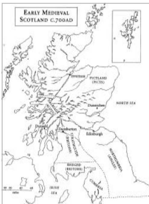
A KORA-KÖZÉPKORI SKÓCIA A KR. U. 700 KÖRÜL

Mint láthatjuk Skócia déli részének etnikai összetevői igen sokszínűek. A történelmi