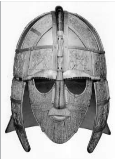
VIKING DÍZSISAK A VII. SZÁZADBÓL. A IX. SZÁZADI S KÉSŐBBI DÁN PORTYÁK BETÖRÉSEI SÚLYOS KÁROKAT OKOZTAK A SKÓT-ALFÖLDÖN

Jelenleg Skócia öt és félmillió főt kitevő lakosságának csupán egy elenyésző hányada, mintegy hetvenezer felvidéki lakos beszél kelta őseinek nyelvét, a gaelt. 3 Ez természetesen nem azt jelenti, hogy Skócia lakosságának csupán 1,2 %-a rendelkezne kelta felmenőkkel, hisz a több mint ezeréves elangolosodási folyamat eredményezte ezt a gael nyelv szempontjából oly reménytelen állapotot. Azonban az angol nyelv ilyen mértékű diadalát a modernizációt mindig követő angol kulturális hatás nem magyarázhatja meg kizárólagosan. 4 Skócia területén ősi idők óta fogva jelentős létszámú angol nyelvet beszélő lakosságnak kellett élnie ahhoz, hogy nyelvük az évszázadok folyamán az egész ország anyanyelvévé váljon. Ezt a problémakört szeretném most ezzel az írással körbejárni, hogy megvilágítsam, milyen etnikai összetevők is formálták, és alakították ki a