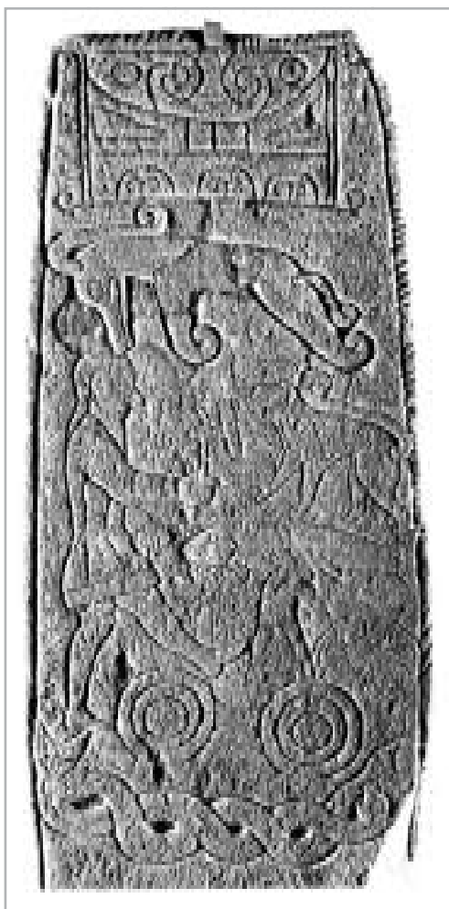
PIKT KŐLAP, ISMERETLEN JELENTÉSŰ VÉSETTEL

Végeredményben bátran állíthatjuk, hogy Skócia déli részének, az Alföldnek a lakossága döntő részben germán etnikumú vagy, hogy Andrew Lang történész sorait idézzem: „Az eredetileg ír származású skótok adták a nevét annak az országnak, amely lakosságának legnagyobb része vérségileg és nyelvileg is angol származású.” 24