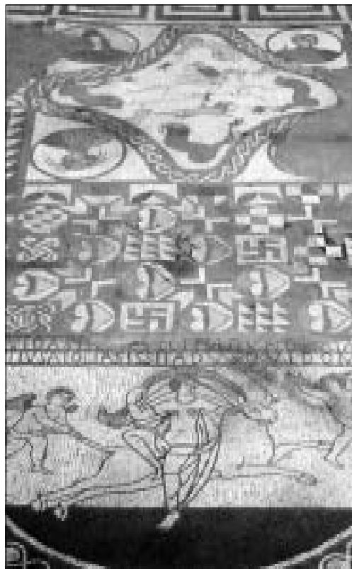
EURÓPA ELRABLÁSA EGY KENTBEN FELTÁRT RÓMAI MOZAIKON

Agricola ambícióit azonban nem elégtette ki a dél-skóciai területek meghódítása. Az ő végső vágya az volt, hogy egész Britanniát meghódítsa Rómának. Kr. u. 83-ban félelmetes haderő 7 élén megindította északi hadjáratát, mely a még mindig dacoló, független észak-britanniai területeket lett vol-