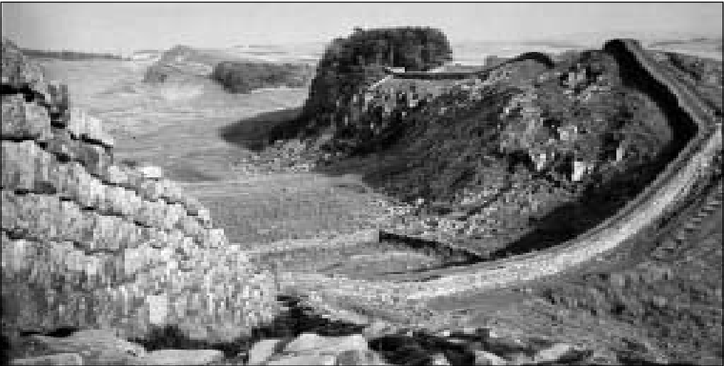
AZ EGYIK LEGJELENTŐSEBB RÓMAI ÉPÍTMÉNY A BRIT-SZIGETEKEN SKÓCIA TÖRZSEI ELLEN ÉPÍTETT HADRIÁNUS FALA

Ez az általános folyamat játszódik le a brit szigeten is, amelyet Julius Caesar két rövidebb expedíciója (Kr. e. 55 és 54) után, végül a Claudius császár uralma alatti hadjáratot (Kr. u. 43) követő négy évtizedben hódítanak meg a rómaiak. A negyven évig tartó folyamatos előrehaladás és hódítás során a rómaiak fokozatosan a sziget teljhatalmú uraivá lettek, s megkezdheték saját kultúrájuk terjesztését a már lecsendesített brit néptörzsek között. Kr.u. 79-re a mostani Anglia és Wales egész területe római fennhatóság alá került. A jelenlegi Skócia azonban „ terrae incognitae ” 1 , vagyis teljesen ismeretlen terület volt Róma számára, melyet vad barbár törzsek népesítettek be.