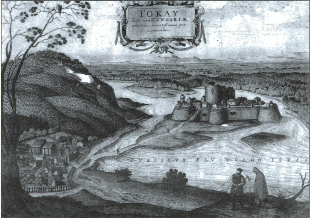
TOKAJ VÁRÁNAK LÁTKÉPE 1660-BÓL. A KÉPEN JÓL KIVEHETŐEN LÁTSZANAK A HEGYOLDALBAN MŰVELT HATALMAS SZŐLŐÜLTETVÉNYEK

A vidék őstörténete lényegileg az itt levő vulkánok geológiai kialakulásával kezdődik. Ez a nagy átalakulás a geológiai harmadkorban játszódott le. A vulkáni kitö-