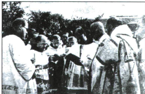
A RENDHÁZ ALAPKÖLETÉTELE 1941 JÚNIUS 22-ÉN