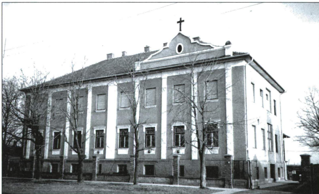
A JELENLEG IS MŰKÖDŐ KUNSZENTMÁRTONI KÁRMELITA RENDHÁZ ÉPÜLETE