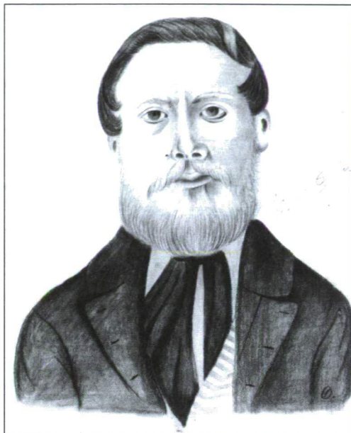
PADOS JÁNOS OLMÜTZBEN KÉSZÜLT ARCKÉPÉNEK MÁSOLATA

Későbbi leveleiből kiderül, hogy bensőséges kapcsolat lehetett közte és szülei között. Erre és ifjúkori komolyságára utal az, hogy nem akart szülei terhére lenni a szemináriumi szünet alatt, ezért elszegődött házitánítónak egy gazdag család fia mellé. 35 Másik levele, ami hasonlóan a szüleihez fűződik mély kapcsolatra világít rá, jóval későbbi, a szabadságharc utáni időből való, mikor is édesapjánál Bőben (Vas megye) talál mendedékre. 36 Most azonban térjünk át tanulóéveinek vizsgálatára. Elemi iskolai tanulmányairól nem maradt fenn irat, nem tudni, hogy hol végzett. Tény azonban, hogy felvették Budára gimnáziumba, középiskolai tanulmányait azonban Kőszegen fejezte be (szüleihez később ebbe a városba is visszatér a szemináriumi szünetek alkalmával). 37 Iskolai bizonyítványa alapján eminens diák volt. Tantárgyait – vallástudomány, matematika, történelem, metafizika, fizika, morálfilozófia, magyar nyelv – kiválóra teljesítette. 38