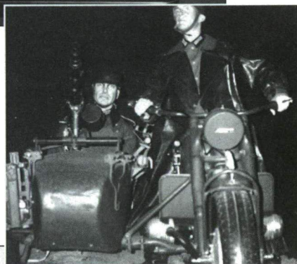
7. ábra MG-34 TÍPUSÚ GÉPPUSKÁVAL FELSZERELT NÉMET OLDALKOCSIS MOTORKERÉKPÁR ÉLETNAGYSÁGÚ MODELLJE